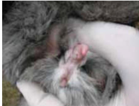
Slika 5. Spolni organi mužjaka kunića

Spolni sustav mužjaka sastoji se od parnih sjemenika ( testis ), parnih pasjemenika ( epididymis ), sjemenovoda ( ductus deferens ), mošnjice ( scrotum ), muškog uda ( penis ) i akcesornih spolnih žlijezda (Slika 5).