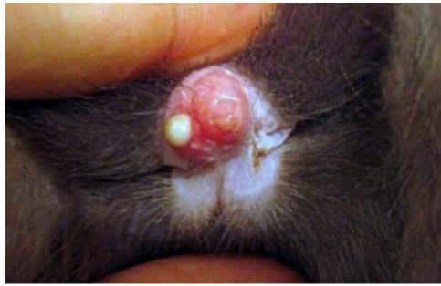
Slika 6. Bakterijska infekcija penisa u mužjaka kunića