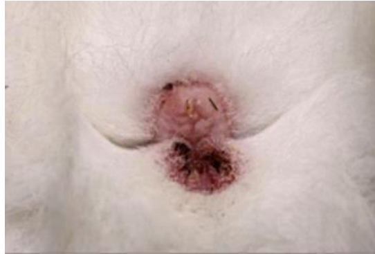
Slika 9. Kraste i čirevi na vanjskim spolnim organima ženke kunića, tipičan su znak sifilisa kunića

koitusom. Bolest je benigna i pojavljuje se u obliku crvenila na vulvi i prepuciju. Područje postaje edematozno i dolazi do pojave vezikula i čvorića, koji s vremenom prelaze u kraste (Slika 9). Lezije se mogu proširiti i na glavu. Bolest se liječi kloramfenikolom i tetraciklinima.