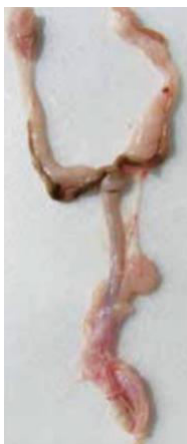
Slika 1. Unutarnji spolni organi ženke kunića

Ženski spolni sustav dijeli se na unutarnje (Slika 1) i vanjske spolne organe (Slika 2). Reproductivni sustav kod ženki kunića sastoji se od parnih jajnika ( ovarium ), parnih jajovoda ( tuba uterina ), maternice ( uterus ), grljaka maternice ( cervices uteri ), rodnice ( vaginae ), predvorja rodnice ( vestibulum vaginae ), stidnice ( vulva ) i dražice ( clitoris ) (SAMARDŽIJA i ĐURIČIĆ, 2011.).