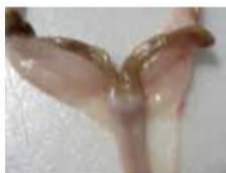
Slika 4. Rogovi maternice i cervix duplex ženke kunića