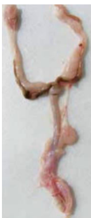
Slika 1. Unutarnji spolni organi ženke kunića