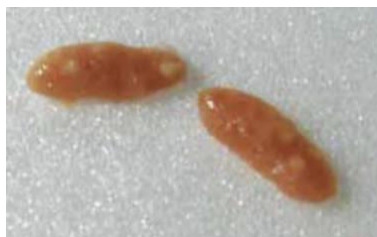
Slika 3. Jajnici ženke kunića

Jajnici ženki kunića su elipsoidna oblika i duljine između 1 i 1,5 cm, nalaze se na kraju maternice, točno ispod bubrega (Slika 3). Skriveni su perimetrijem i masnoćom (ADUKU i OLUKOSI, 1990.). Jajovodi nemaju puno zavoja i neprimjetno prelaze u rogove maternice. Maternica ženki kunića pripada tipu uterus duplex . Maternica ima 2 neovisna roga, od kojih svaki ima svoj vlastiti maternični grljak (Slika 4). Duljina rogova maternice iznosi oko 7 cm (SAMARDŽIJA i ĐURIČIĆ, 2011.). Rodnica je velika, s uretrom koja ide do pola, u razini predvorja rodnice (ADUKU i OLUKOSI, 1990.).