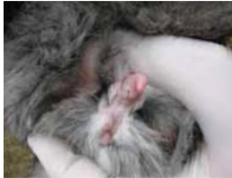
Slika 5. Spolni organi mužjaka kunića

Spolni sustav mužjaka sastoji se od parnih sjemenika ( testis ), parnih pasjemenika ( epididymis ), sjemenovoda ( ductus deferens ), mošnjice ( scrotum ), muškog uda ( penis ) i akcesornih spolnih žlijezda (Slika 5).