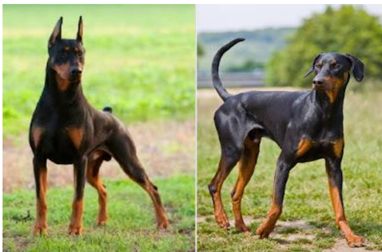
Slika 1. Pas s kupiranim uškama i repom i nekupirani pas.

zadovoljavanja spolnih potreba čovjeka. Nadalje, zabranjeno je izlaganje životinja vatri, vrućim predmetima, nagrizajućim ili otrovnim tvarima te drugim fizikalnim ili kemijskim djelovanjima, pucanje u životinje neovisno o vrsti oružja ili sprave za pucanje (osim u svrhu zaštite sigurnosti ljudi i životinja), bacanje petardi na životinje ili drugih pirotehničkih sredstava (osim u interventnim situacijama kada se u skladu s posebnim propisima provodi rastjerivanje životinja) i trčanje životinja privezanih uz motorno prijevozno sredstvo koje je u pokretu. Zabranjeno je koristiti za rasplod životinje koje nisu spolno zrele i koje nisu završile svoj rast, zatim životinje nakon odbijanja mladunčadi koje se još nisu oporavile te bolešću iscrpljene, ozlijeđene životinje ili životinje koje nisu spremne za parenje. Zabranjeno je držati životinje u svrhu ukrašavanja prostora u ugostiteljskim i trgovačkim objektima (osim u objektima registriranim za prodaju kućnih ljubimaca ili ako se životinjama osiguraju primjereni uvjeti držanja i onemogućiti uznemiravanje). Zabranjeno je izlaganje pasa s kupiranim uškama i repovima (osim lovačkih pasa), parenje domaćih pasa i domaćih mačaka s divljim životinjama iz prirode ili uzgoja i zajedničko držanje nezdružljivih životinja.