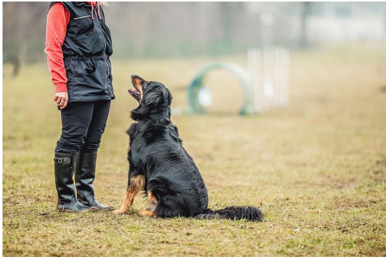
Slika 3. Dresura psa.

Prema Zakonu vlasnici kućnih ljubimaca moraju osigurati kontrolu razmnožavanja životinja pod njihovim nadzorom i odgovorni su za zbrinjavanje mladunčadi vlastitih kućnih ljubimaca. Ako vlasnici kućnih ljubimaca sami ne žele zbrinuti mladunčad kućnih ljubimaca, snose troškove njihova zbrinjavanja, a u slučaju pasa i troškove njihove trajne sterilizacije. Ako vlasnici kućnih ljubimaca ne zbrinjavaju mladunčad kućnih ljubimaca, veterinarski inspektor po utvrđivanju napuštanja mladunčadi vlastitog kućnog ljubimca, može na trošak vlasnika odrediti mjeru trajne sterilizacije kućnog ljubimca.