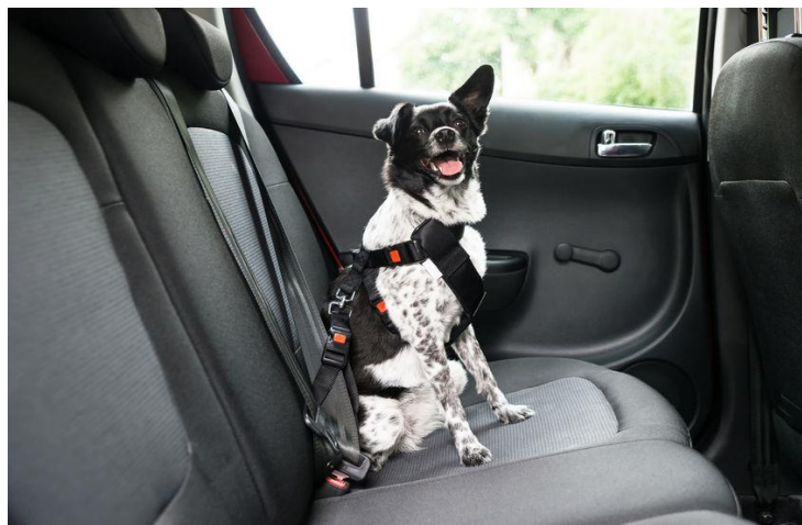
Slika 2. Siguran prijevoz psa u automobilu.