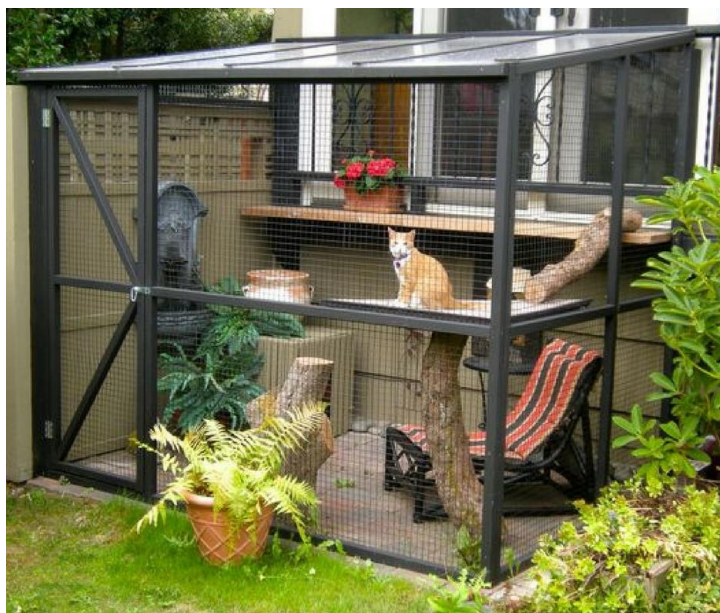
Slika 10. Mačka u ograđenom vanjskom prostoru.

od poznate rutine. Mačka koja ima bihevioralnu slobodu i određenu kontrolu nad svojim fizičkim i društvenim okolišem razvit će fleksibilnije i učinkovitije strategije suočavanja s podražajima. U lošim uvjetima držanja mačke će vjerojatno postati neaktivne i zapostaviti normalna ponašanja, kao što su hranjenje, održavanje higijene tijela, istraživanje i igra, te početi izražavati nenormalna ponašanja. Držanje u okolišu koji potiče normalno ponašanje mačaka pomaže vlasnicima prepoznati znakove njihova narušenog zdravlja (ROCHLITZ, 2007.).