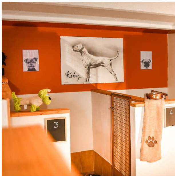
Slika 4. Hotel za pse.

Pravilnikom o uvjetima kojima moraju udovoljavati objekti za privremeni smještaj kućnih ljubimaca (NARODNE NOVINE 110/2021) propisani su uvjeti koje moraju ispunjavati objekti (npr. hoteli za pse, Slika 4.) gdje se kućni ljubimci ostavljaju na čuvanje i skrb o trošku vlasnika, program osposobljavanja osoblja koje brine o kućnim ljubimcima, način postupanja s kućnim ljubimcima, sadržaj upisnika objekata te način vođenja evidencija i sadržaj evidencija o kućnim ljubimcima u tim objektima.