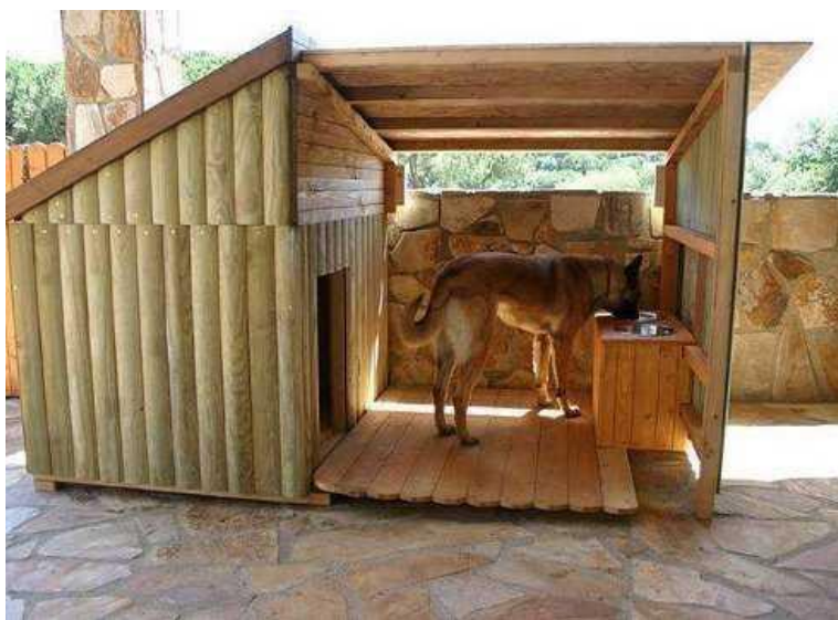
Slika 5. Pseća kućica i prostor za hranidbu u dvorištu.

kućnim psima u stanu može osigurati kutija s pijeskom ili piljevinom za obavljanje fizioloških potreba. U stanu se mogu držati i veće pasmine pasa, ali ih tada moramo nekoliko puta na dan voditi u šetnju, i to najmanje po jedan sat, poželjno je i više sati, kako bi se pas istrčao, obavio nuždu i vratio umoran.