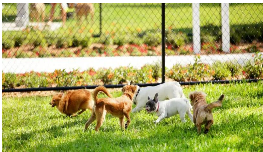
Slika 6. Psi u psećem parku.

Ako je pas trajno smješten u dvorištu, vrtu ili drugom ograđenom otvorenom prostoru, mora mu se osigurati kućica (Slika 5.) koja mora biti primjerena njegovoj veličini na način da pas u njoj može ležati, stajati uspravno, okrenuti se i njegovati te u njoj mora biti zaštićen od nepovoljnih vremenskih uvjeta, a otvori na kućici moraju biti dovoljno veliki da pas može nesmetano prolaziti te pozicionirani tako da su zaštićeni od vremenskih nepravilnosti. Dakle, pri odabiru mjesta za psa u dvorištu u kojem mu se ograđuje prostor treba voditi računa da je ono ispod kakvog velikog drveta, gdje će biti zaštićen od velikih vrućina ili hladnih vjetrova. Poseban problem kod držanja pasa u ograđenom prostoru može biti podloga na kojoj se drže. U praksi se za pse najčešće grade kućice od drveta. One su neusporedivo bolje od kućica izrađenih od betona i opeke. No, u pukotinama i na starijim kućicama taloži se prašina organskog podrijetla, pogodna za razvoj buha i drugih kožnih parazita. To se rješava održavanjem opće higijene u kućici (MATKOVIĆ i VUČEMILO, 2019.).