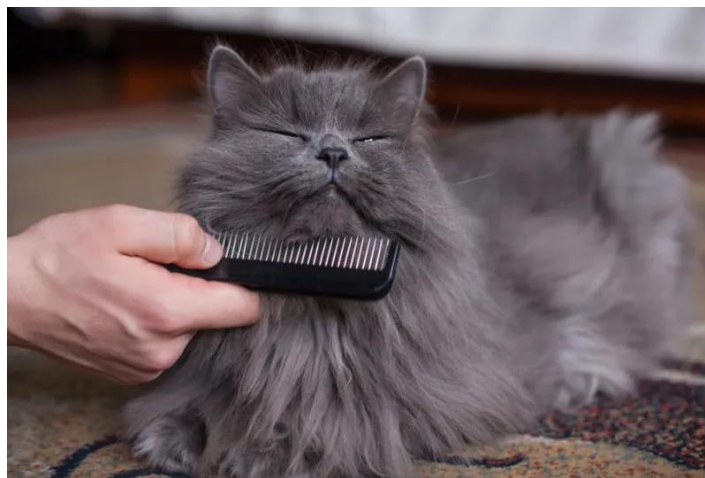
Slika 12. Češljanje dugodlake mačke.