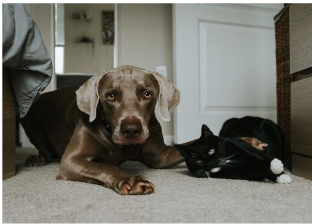
Slika 7. Suživot psa i mačke.

uspostave prijateljske odnose (ROONEY i STAFFORD, 2019.). Između trećeg i dvanaestog tjedna starosti razdoblje je primarne socijalizacije štenadi (VUČINIĆ, 2006.).