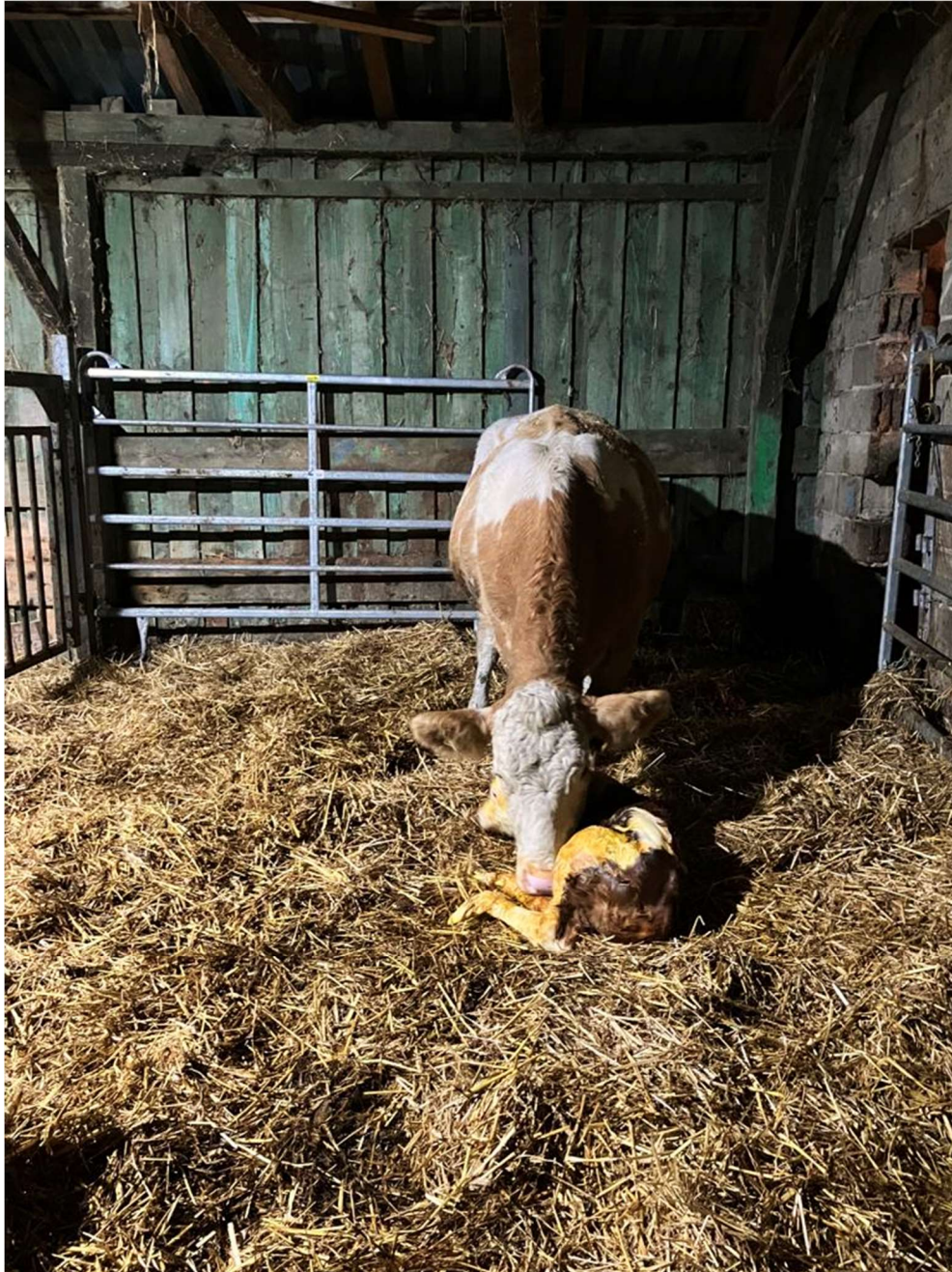
Slika 3. Krava s novorođenim teletom u pojedinačnom odjeljku, na dubokoj stelji

Raspored teljenja djelomično je sezonski, na način da se većina teljenja odvija u razdoblju od ožujka do lipnja, zbog lakše prodaje teladi, ali teljenja su prisutna tokom cijele godine, izuzev prosinaca i siječnja. Stado je uvijek podijeljeno u manje skupine, obzirom na stadij proizvodnje u kojem se goveda nalaze. Na gospodarstvu se provodi gotovo isključivo prirodni pripust licenciranim bikovima simentalске pasmine, iz uvoza ili vlastitog uzgoja.