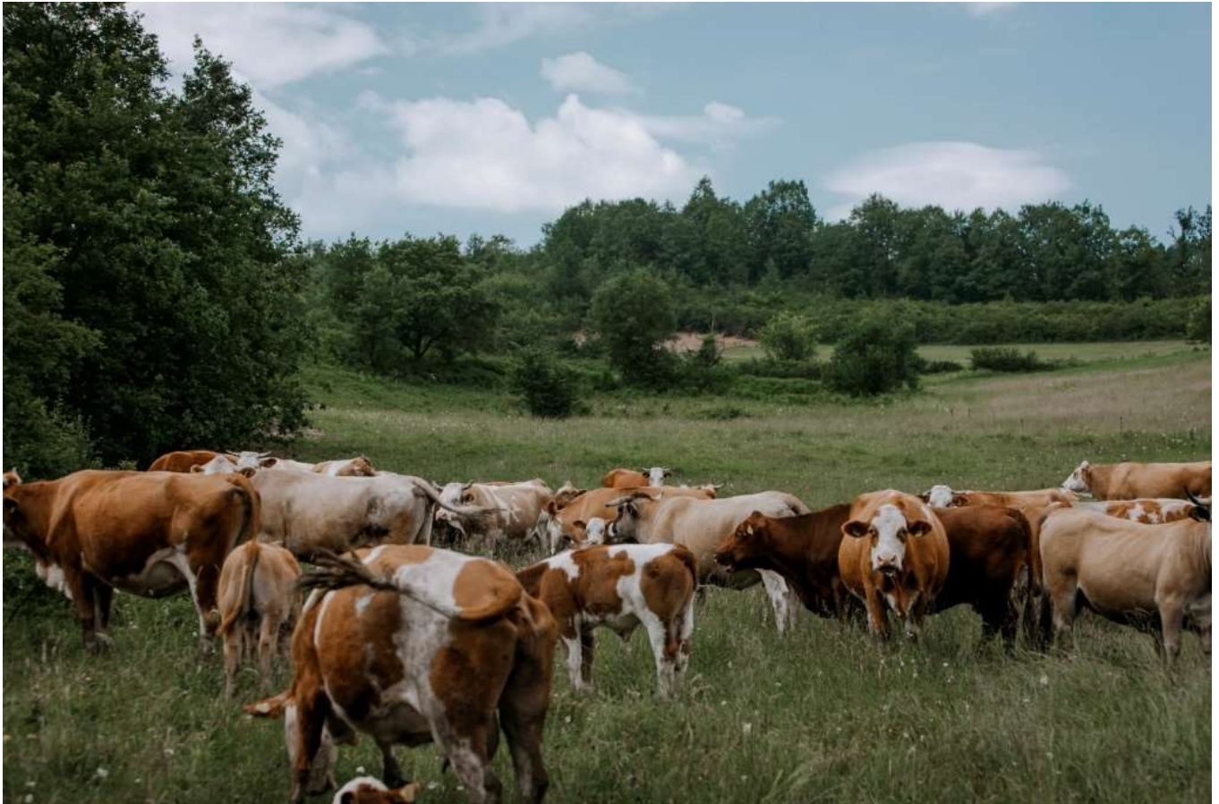
Slika 2. Simentalske krave s teladi na ispaši

veterinarskoj dijagnostici, izbor parametara koje analiziramo također mora biti svrsishodan, ravnajući se uz to prema anamnezi i provedenom kliničkom pregledu (BOUDA i JAGOŠ, 1984).