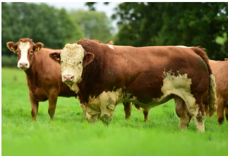
Slika 1. Irski tip simentalčkog goveda

Porijeklo simentalke pasmine seže iz doline rijeke Simme u Švicarskoj. Rasprostranjena je u svim europskim, a i mnogim svjetskim zemljama, najčešće kao pasmina dvojnih proizvodnih karakteristika, no izuzetak čine Britanija i Irska, gdje se simentalac koristi kao mesna pasmina (slika 1.) i pasmina za poboljšanje tamošnjih mesnih pasmina (CAPUT, 1996). Boja simentalca varira od žute do crvene s bijelim šarama, a rep, glava i noge su bijele boje sa manjim pigmentiranim područjima. Pripadnici ove pasmine imaju srednje debelu, mekanu, djelomično pigmentiranu kožu (KATALINIĆ, 1994). Goveda su najčešće rogata, no uvozom homozigotno bezrožnih jedinki, najčešće bikova za rasplod, sve je veći udio bezrožnih goveda, pogotovo u pašnom uzgoju, napose zbog lakoće manipulacije i smanjenja međusobnog ozljeđivanja unutar stada. Krave karakterizira dobro vime, često asimetrične prednje spram stražnjih četvrti, a zahvaljujući dobroj mliječnosti pasmine, moguće je kasnije odbiće i veće težine pri odbiću od nekih drugih mesnih pasmina goveda.