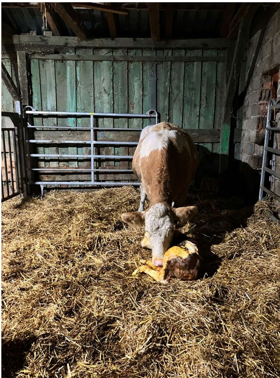
Slika 3. Krava s novorođenim teletom u pojedinačnom odjeljku, na dubokoj stelji

Raspored teljenja djelomično je sezonski, na način da se većina teljenja odvija u razdoblju od ožujka do lipnja, zbog lakše prodaje teladi, ali teljenja su prisutna tokom cijele godine, izuzev prosinaca i siječnja. Stado je uvijek podijeljeno u manje skupine, obzirom na stadij proizvodnje u kojem se goveda nalaze. Na gospodarstvu se provodi gotovo isključivo prirodni pripust licenciranim bikovima simentalске pasmine, iz uvoza ili vlastitog uzgoja.