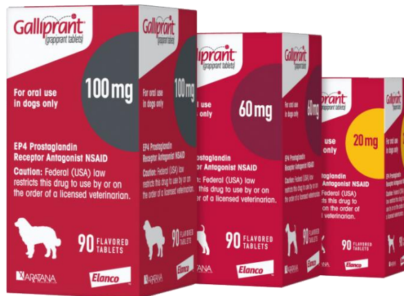
Slika 4: pakiranje Gallipranta®

Ukoliko se tableta uzima s hranom, dolazi do smanjenja biorasploživosti – kod uzimanja natašte, biorasploživost je iznosila 89%, a ukoliko je tableta uzimana sa hranom ona je iznosila samo 33%, što je znatna razlika.