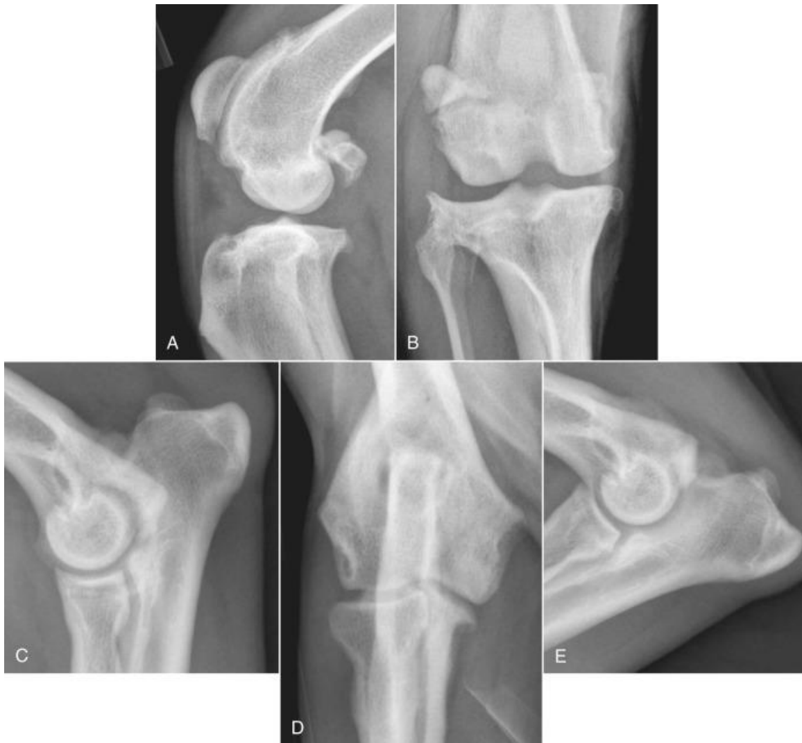
Slika 2: A i B: koljeno njemačkog ovčara, C do E: lakat njemačkog ovčara

U koksofemoralnom zglobu može doći do subluksacije zbog sinovijalnog izljeva. Distrakcijski indeks (DI) označava udaljenost glave bedrene kosti od acetabuluma u trenutku distrakcije. Izražava se kao broj između nula i jedan, i što je bliži jedan labavost kukova je veća. Postoji jaka povezanost između distrakcijskog indeksa (DI) i kasnijeg razvoja bolesti. Distrakcijski indeks je specifičan za pasminu, za njemačkog ovčara iznosi 0.3 a za labradora i rottweilera iznosi 0.4. (GRAEME i DAVIES, 2017.)