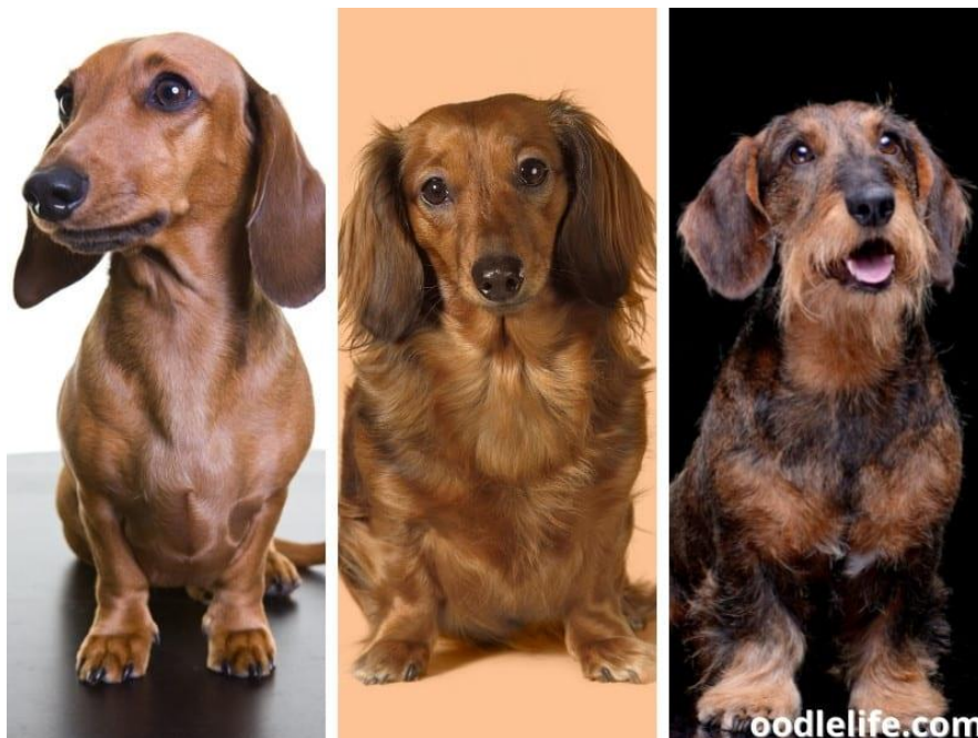
Slika 1. Jazavčari fotografija

Brakovi su vrlo cijenjeni goniči, imaju dobru sposobnost slijediti hladni trag, popularni su među lovcima koji ih koriste za pronalaženje i lov na divlje svinje te ostalu ranjenu divljač (SELIMOVIĆ i REICHER, 2000).