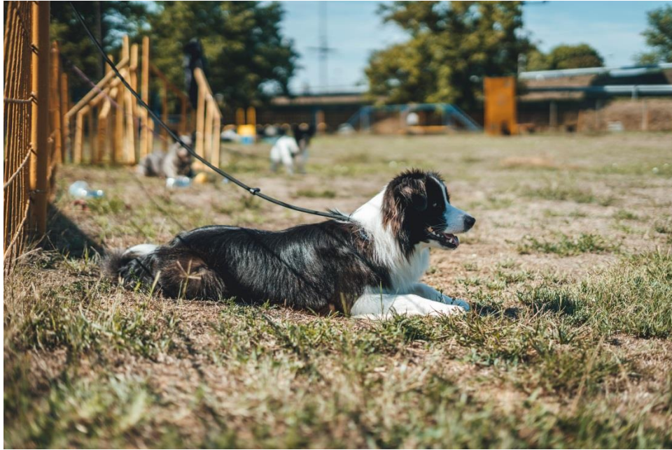
Slika 3 Graničarski koli

polegnuta i kratka na području ušiju i lica, stražnjim nogama od skočnog zgloba do tla i prednjim nogama (osim resa). Dopusnene su razne boje kao što su crno – bijela, blue merle , red merle , crni i crveni trobojni, jetreno smeđa s bijelim, ali bijela boja ne smije prevladavati (HKS, 2022.a; FCI, 2009.).