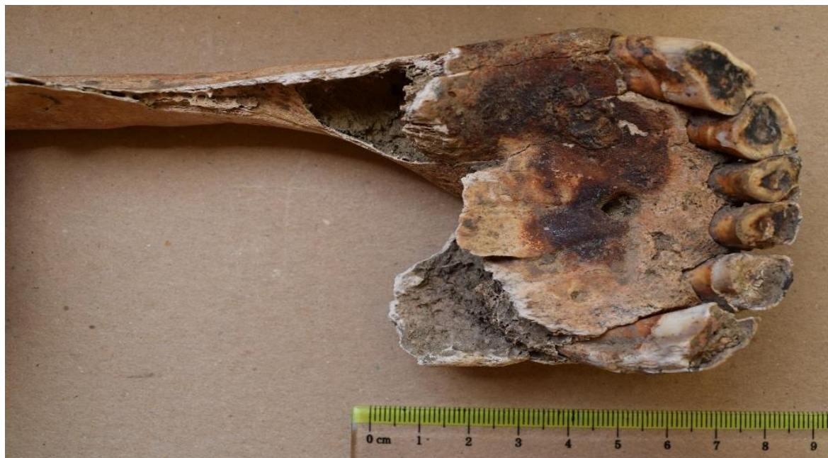
Slika 11. Gornja čeljust kobile iz G-52 s tragovima koji najvjerojatnije potječu od oksidiranih žvala

Osim promjena na lumbalnim kralješcima, na desnoj strani i u sredini gornje čeljusti kobile iz groba 52 uočeni su i tragovi koji najvjerojatnije potječu od oksidiranih žvala (Slika 11). Slične su promjene uočene s desne strane na gornjoj (Slika 12) i donjoj čeljusti (Slika 13) kobile iz groba 25. Rendgenskom pretragom ovih čeljusti, na dijelovima na kojima su bile žvale nisu uočene promjene na kostima i/ili zubima.