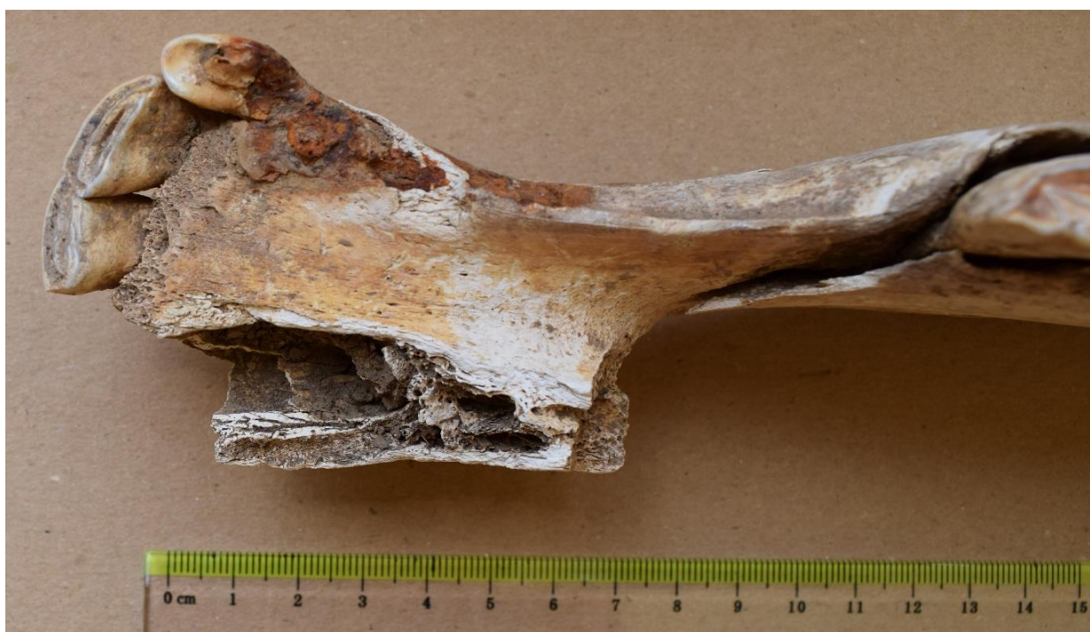
Slika 13. Donja čeljust kobile iz G-25 s tragovima koji najvjerojatnije potječu od oksidiranih žvala