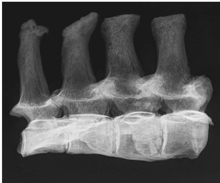
Slika 8. Rendgenogram 4. - 7. lumbalnog kralješka kobile iz G-52 ( norma lateralis sinister )