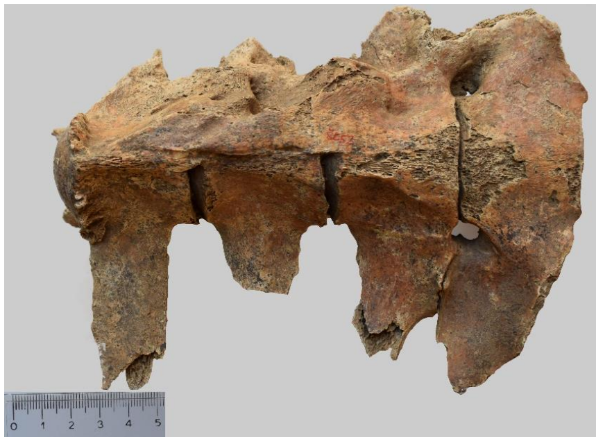
Slika 9. Patološke promjene 4. - 7. lumbalnog kralješka kobile iz G-52 ( norma ventralis )

Masivni osteofiti lijeve strane tijela 4. - 6. lumbalnog kralješka potvrđeni su ventralnom projekcijom (Slika 9) i rendgenogramom (Slika 10). Na Slici 9. vidljivo je kako su srasli i poprečni izdanci ( processus transversus ) 6. i 7. lumbalnog kralješka s lijeve strane.