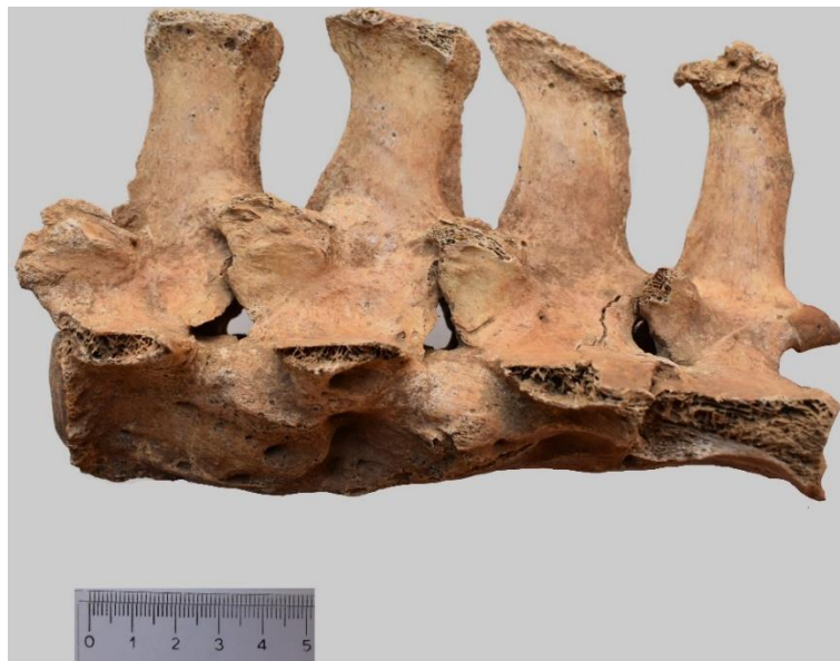
Slika 7. Patološke promjene 4. - 7. lumbalnog kralješka kobile iz G-52 ( norma lateralis sinister )

Nadalje, između 4. i 7. lumbalnog kralješka iste kobile vidljivo je kako su također srasli kranijalni i kaudalni zglobni izdanci ( processus cranialis et caudalis ), a masivni osteofiti su uočeni s lijeve lateralne strane tijela svih kralježaka (Slika 7). Koštana sraštenja zglobnih izdanaka i tijela kralježaka potvrđena su i rendgenogramom (Slika 8).