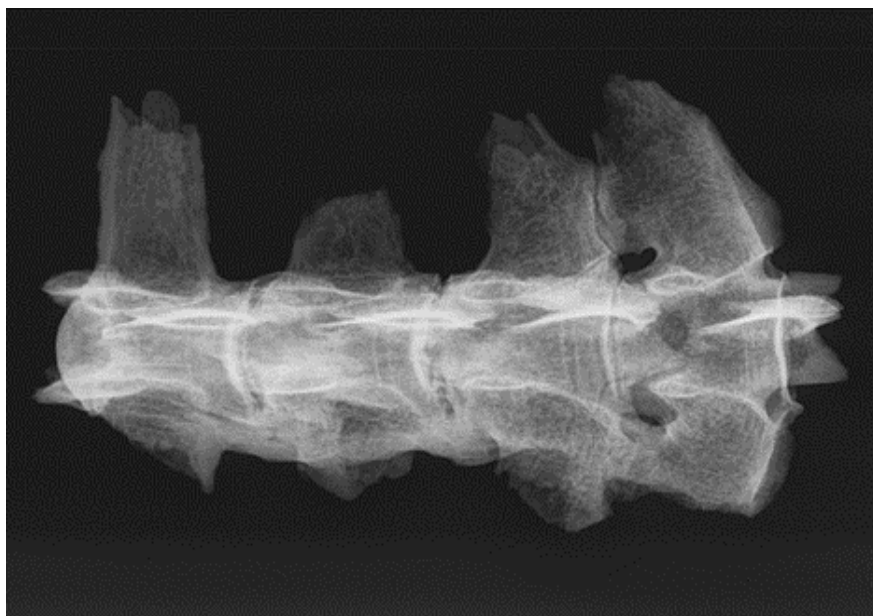
Slika 10. Rendgenogram 4. - 7. lumbalnog kralješka kobile iz G-52 ( norma ventralis )