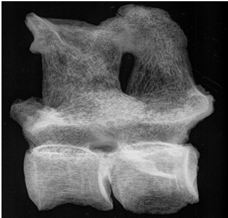
Slika 4. Rendgenogram 2. i 3. lumbalnog kralješka kobile iz G-52 ( norma lateralis )