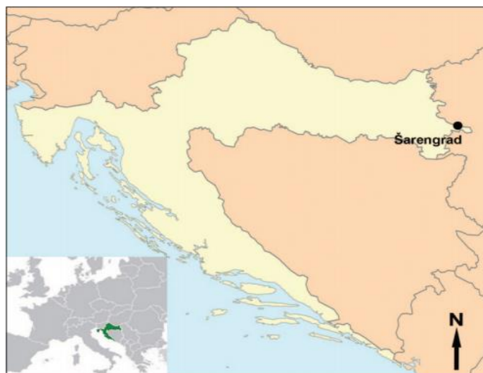
Slika 1. Karta Hrvatske s položajem Šarengrada (izradio: M. Novak), preuzeto iz CARIĆ i sur. (2019.)

Kosti potječu s arheološkog nalazišta Šarengrad – Klopare smještenog na istočnom rubu Šarengrada, sjeverno od ceste prema Iloku u Vukovarsko-srijemskoj županiji (Slika 1).