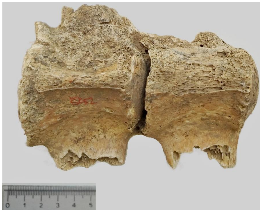
Slika 5. 2. i 3. lumbalni kralježak kobile iz G-52 ( norma ventralis )

Na istim kralješcima s ventralne strane nisu uočeni osteofiti (Slika 5), međutim na rendgenogramu iste projekcije, vidljivo je srašćavanje tijela oba kralješka i međurebrenog diska ( discus intervertebralis ) među njima (Slika 6).