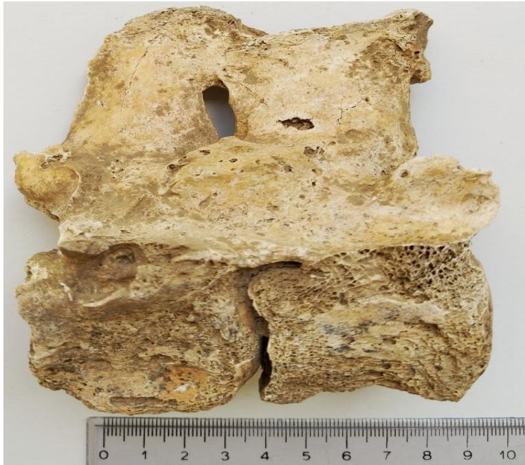
Slika 3. Patološke promjene na 2. i 3. lumbalnom kralješku u kobile iz G-52 ( norma lateralis )