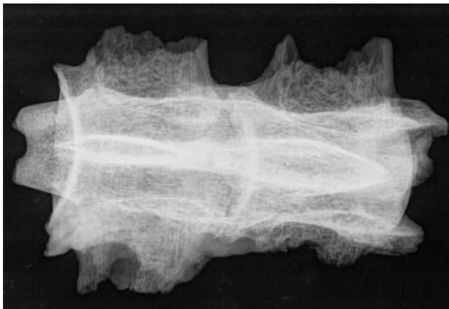
Slika 6. Rendgenogram 2. i 3. lumbalnog kralješka kobile iz G-52 ( norma ventralis )