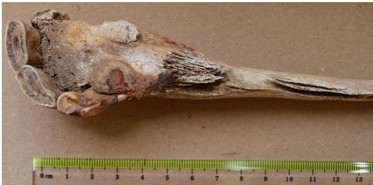
Slika 12. Gornja čeljust kobile iz G-25 s tragovima koji najvjerojatnije potječu od oksidiranih žvala