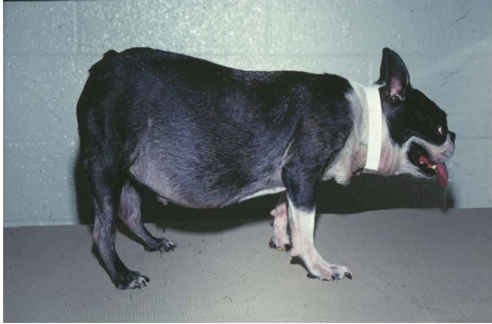
Slika 2. Povećanje abdomena kod psa s hiperadrenokorticizmom

( https://bowwowinsurance.com.au/pet-care/diseases-conditions/hyperadrenocorticism-cushings-disease/ )