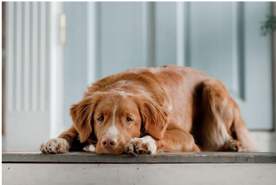
Slika 8. Novoškotski retriever jedna je od pasmina predisponiranih za razvoj Addisonove bolesti ( https://www.northgateveterinary.com/site/blog/2021/02/28/addisons-disease-in-dogs-treatment )

Hipoadrenokorticismam je rijetka bolest u pasa, a još rjeđa u mačaka (WILLARD i sur., 1982., GIUDICE i sur., 2016.). Smatra se da ima genetsku osnovu. Pasmine koje su prema literaturi predisponirane za razvoj hipoadrenokorticisma su: standardna pudla, novoškotski retriever, bradati škotski ovčar i portugalski vodeni pas. Od svih oboljelih pasa 70% čine ženke. Kao što je već spomenuto, klinički simptomi su nespecifični, obično se javljaju naglo ili nastupaju polako i povezani su s nekim stresim događajem, npr. kirurški zahvat ili izložba. Klinički simptomi uključuju: rekurentne epizode gastrointerstinalnih simptoma, letargiju, povraćanje, proljev koji se u pravilu poboljšavaju po simptomatskoj terapiji. Osim toga navode se i anoreksija, slabost, gubitak tjelesne mase, drhtanje, poliurija, polidipsija, bolnost abdomena, hipovolemični šok, dehidracija. Rjeđe se javljaju neki neurološki simptomi kao naprimjer napadaji uslijed hipoglikemije, grčenje mišića, krvarenje u gastrointestinalnom sustavu. Na kliničkom pregledu obično su uočavaju slaba tjelesna kondicija, depresija, bradikardija, slabi puls, melena ili hematoheza, anemija (GRECO, D.S., 2007.).