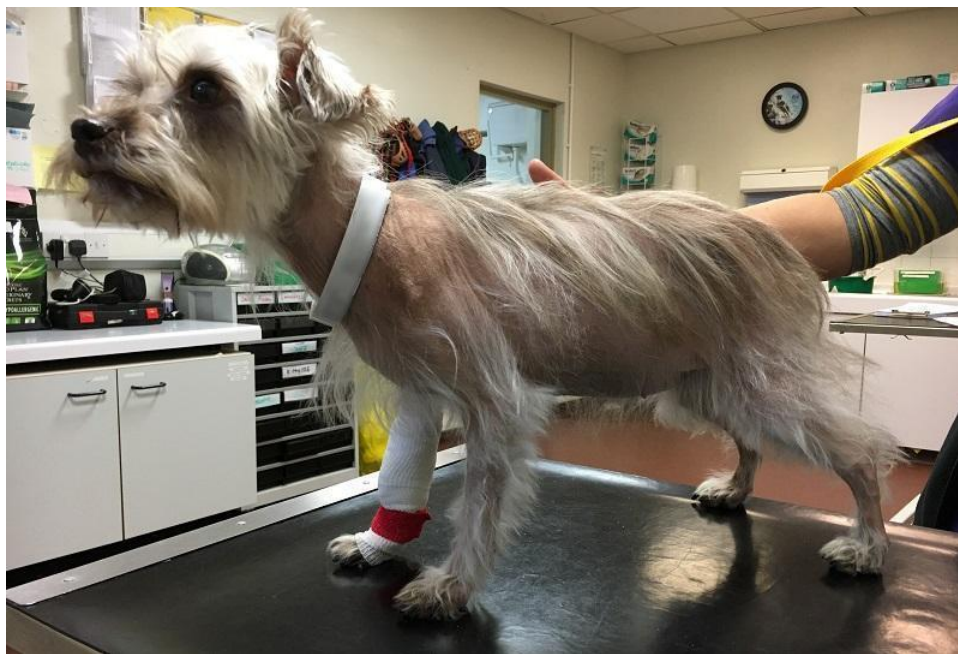
Slika 1. Pas s hiperadrenokorticismom

Do kliničke manifestacije dolazi postepeno i obično bolest sporo napreduje, Najčešći klinički znakovi su: poliurija, polidipsija, polifagija, distenzija abdomena, alopecije, dahtanje, slabost miškulature.