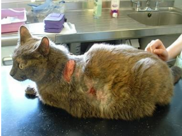
Slika 5. Mačka s kliničkim znakovima hiperadrenokortizma ( https://icatcare.org/advice/hyperadrenocorticism-cushings-disease/ )