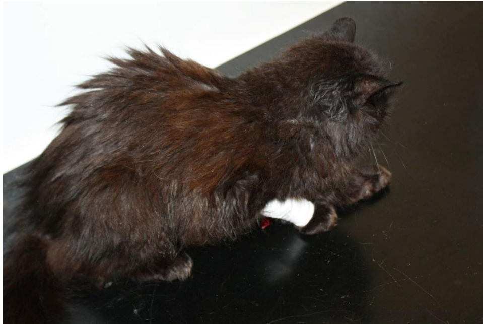
Slika 7. Mačka s hipoadrenokorticismom

U mačaka hipoadrenokorticism je rijetka bolest s tek opisanih 40-tak slučajeva u literaturi. Etiološki smatra se da je posljedica jatrogene adrenokortikalne atrofije odnosno da se javlja sekundarno kao posljedica limfoma u mačaka (PARNELL i sur., 1999.).