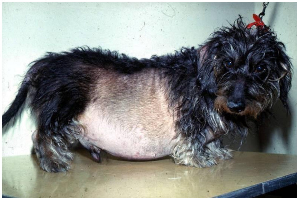
Slika 4. Pas s hiperadrenokorticismom ( https://bowwowinsurance.com.au/pet-care/diseases-conditions/hyperadrenocorticism-cushings-disease/ )

Uslijed rupture adrenalnih tumora može nastupiti akutno krvarenje u abdomenu uz znatno akutno pogoršanje kliničkog stanja koje zahtjeva hitnu intervenciju (WHITTEMORE i sur., 2001.).