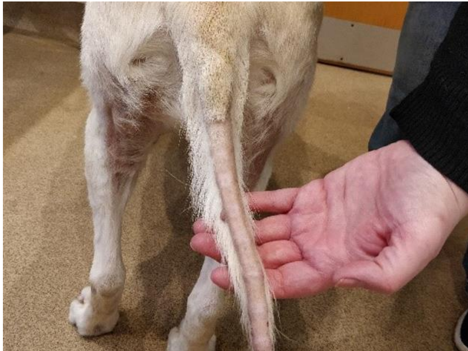
Slika 3. Kožne promjene kod hiperadrenokorticisma

Hiperpigmentacija se javlja u difuznom ili fokalnom obliku i posljedica je povećanja broja melanocita u slojevima kože.