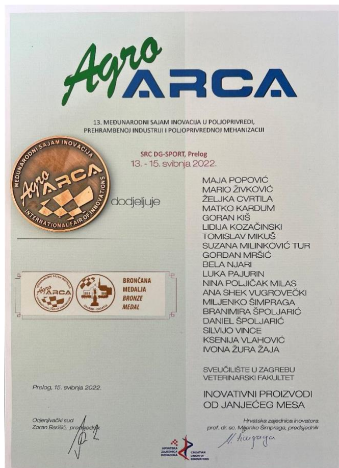
Slika 9. Brončana medalja i plaketa Udruge inovatora Hrvatske za inovativnost HRZZ projekta 2022. (izvor: https://www.inoanjetina.net ).

Od 5 receptura inovativnih funkcionalnih polutrajnih i trajnih proizvodi tri su recepture u sklopu EU projekta „S KLOBASICOM U EU” na međunarodnom sajmu 2. Dani hrvatskih kobasica i salama održanom u Sv. Petar u Šumi 2022. prepoznate kao kreacija inovativnih proizvoda od janjetine s nižim udjelom kolesterola, povoljnim masno kiselinskim i aroma profilom te su im dodijeljene zlatne medalje i plakete (POPOVIĆ i sur., 2022.) (Slika 10, 11, 12).