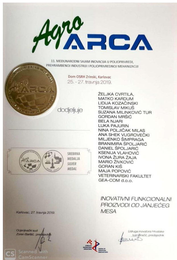
Slika 7. Srebrna medalja i plaketa Udruge inovatora Hrvatske za inovativnost HRZZ projekta 2019..

Udruga inovatora Hrvatske za jedinstvenost inovacije HRZZ projekta kao kreacije novih tehnologija uzgoja i hranjenja janjadi u dijelu koji se odnosi na simbiotsku aktivnost pripravka plemenite pečurke (izravni prebiotik i neizravni probiotik) dodijelila je srebrnu medalju i plaketu za inovacije u poljoprivredi, prehrambenoj industriji i poljoprivrednoj mehanizaciji na 12. Međunarodnom sajmu inovacija u poljoprivredi, prehrambenoj industriji i poljoprivrednoj mehanizaciji održanom od 2. do 4. srpnja 2021. u Prelogu ( https://www.inoanjetina.net/aktivnosti ) (Slika 8).