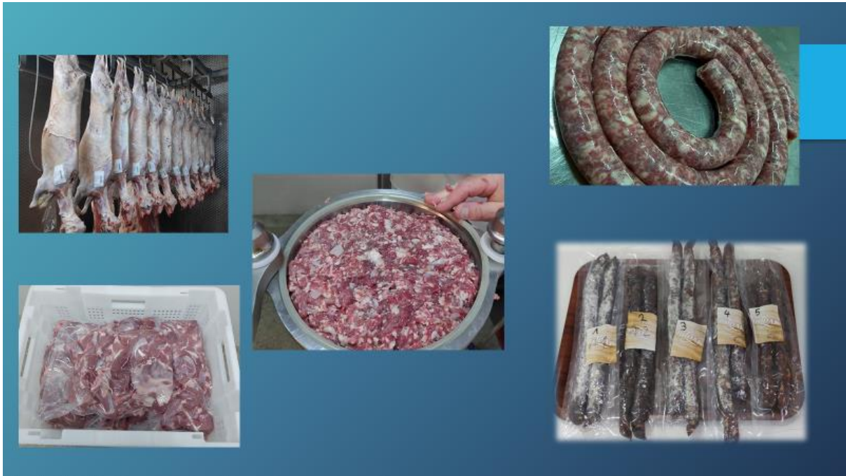
Slika 6. Inovativnost i kreativnost inovativnog proizvoda od inovativne janjetine HRZZ projekta “Inovativni funkcionalni proizvodi od janječeg mesa“ (IP-2016-06-3685) u stupnju razvoja funkcionalnog laboratorijskog prototipa.