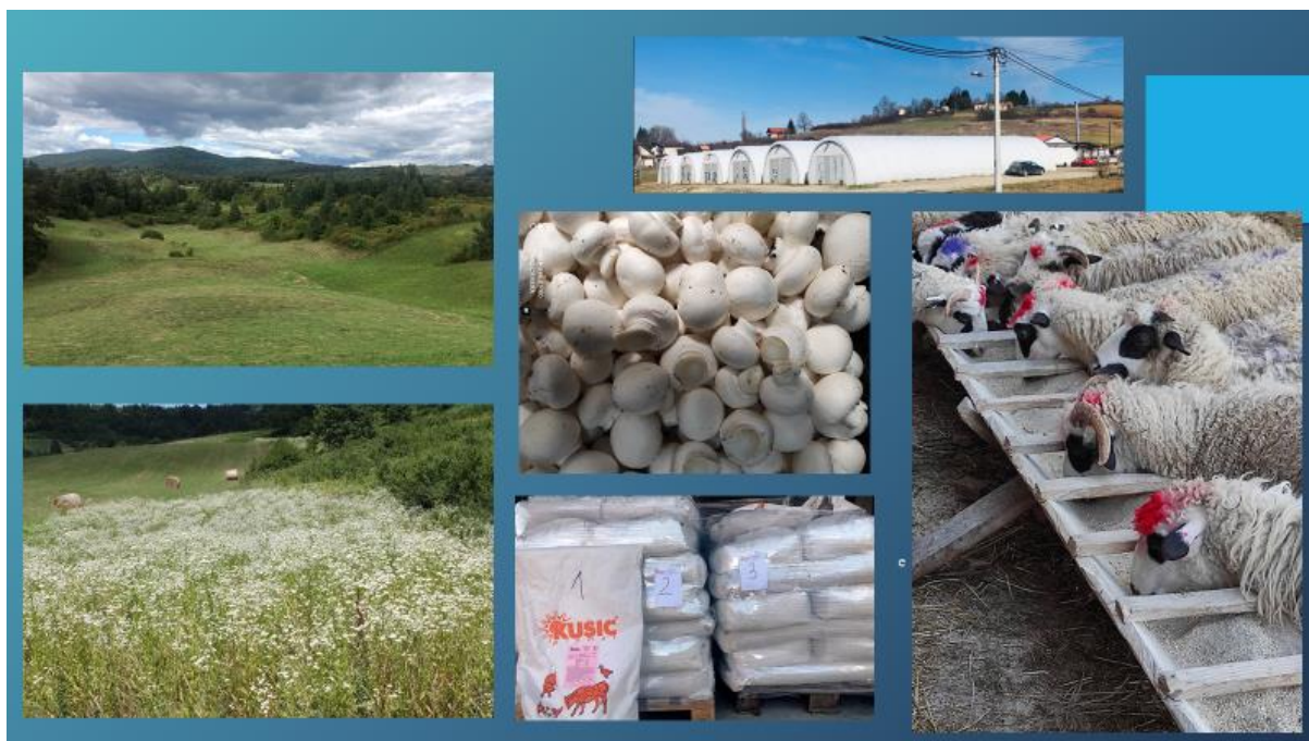
Slika 4. Inovativnost i kreativnost tehnologije uzgoja i hranidbe janjadi HRZZ projekta “Inovativni funkcionalni proizvodi od janječeg mesa“ (IP-2016-06-3685) u stupnju razvoja funkcionalnog laboratorijskog prototipa (izvor: https://www.inoanjetina.net ).