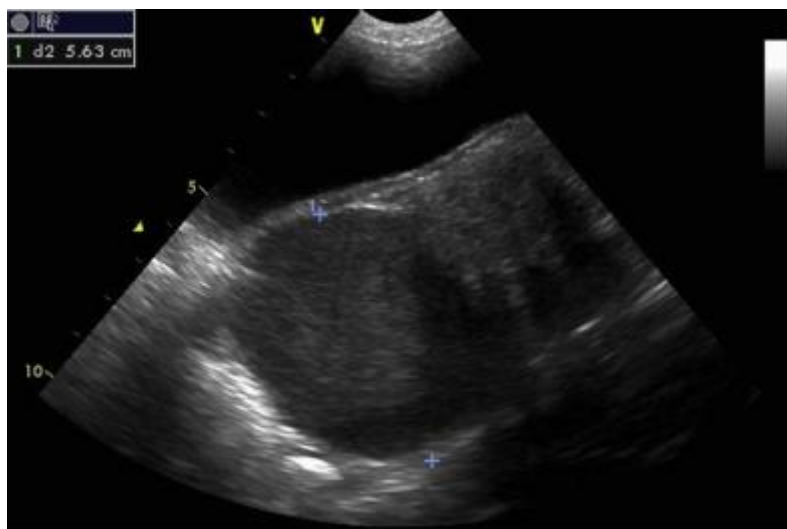
Slika 4. Ultrazvučni prikaz piometre batrljka maternice sa potvrđenim sindromom zaostalog jajnika

Što se ranije prepoznaju znakovi piometre batrljka maternice i adekvatno otklone, to je veća šansa za povoljan ishod koji potencijalno može biti smrtonosan (HAMAIDE, 2017.). Piometra batrljka maternice obično prati sindrom zaostalog jajnika, stoga je prevencija usmjerena na osiguravanje potpunog uklanjanja jajnika tijekom kastracije (ADIN, 2011.). Poznavanje anatomije i pažljiva primjena odgovarajuće tehnike kastracije su ključni za izbjegavanje piometre (VAN GOETHEM i sur., 2006.).