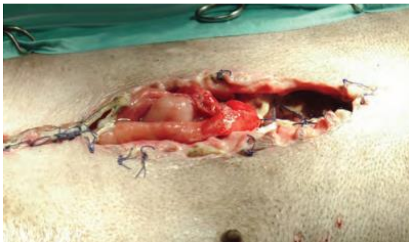
Slika 3. Evisceracija trbušnih organa 3 dana nakon ovariohisterektomije.

čvor prevelik, što će uslijediti upalnim odgovorom (reakcija na šivaći materijal) (BOHLING, 2020.). Ukoliko su šavovi prekinuti i razdvoje se svi slojevi rane (potpuna dehiscencija), postoji opasnost od evisceracije crijeva ili drugih trbušnih organa kroz otvorenu ranu što posljedično dovodi do infekcije potrušnice, tj. peritonitisa (FITZGERALD, 2022.). Na Slici 3. prikazana je potpuna dehiscencija praćena evisceracijom organa 3 dana nakon ovariohisterektomije u kuje kao posljedica neadekvatne tehnike šivanja (CLAEYS, 2017.). U rijetkim slučajevima dehiscencija može biti rezultat teške kirurške infekcije ili poremećaja u cijeljenju rana, kao što se može vidjeti kod šećerne ili Cushingove bolesti (BOHLING, 2008.). Stope infekcije mogu se smanjiti skraćivanjem trajanja operacije i pravilnim korištenjem odgovarajuće kirurške tehnike (npr. zatvaranje „mrtvog prostora“) (MURARO i WHITE, 2014.).