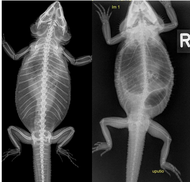
Slika 2. Usporedan rendgenski prikaz kostura zdrave bradate agame (lijevo) i pacijenta s nalazom generaliziranog prorijeđenja kostura, tzv. metaboličke bolesti kostiju (desno)

proliferacijom, stanjeni koštani korteks te patološke frakture i povijanja dugih cjevastih kostiju (HOLMES i DIVERS, 1996.B). Trauma rezultira ozlijedom mekog tkiva, subluksacijom ili luksacijom zgloba i prijelomima kostiju.