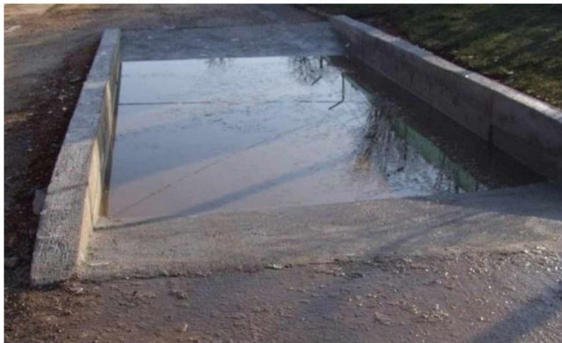
Slika 3. Dezinfekcijska barijera za vozila.

Primarne mjere biosigurnosti odnose se na pravilan izbor lokacije za izgradnju farme, sigurnosnu ogradu oko farme, uvođenje zdravih životinja na farmu, izolaciju novonabavljenih životinja, kontrolu kretanja na farmi, postavljanje dezbarijera i njihov nadzor, sustavno provođenje mjera dezinfekcije, dezinsekcije i deratizacije, propisno zbrinjavanje gnoja i lešina, higijenu ljudi, uporabu zaštitne odjeće i obuće i dr. (OSTOVIĆ i sur., 2019.; MATKOVIĆ i sur., 2020.).