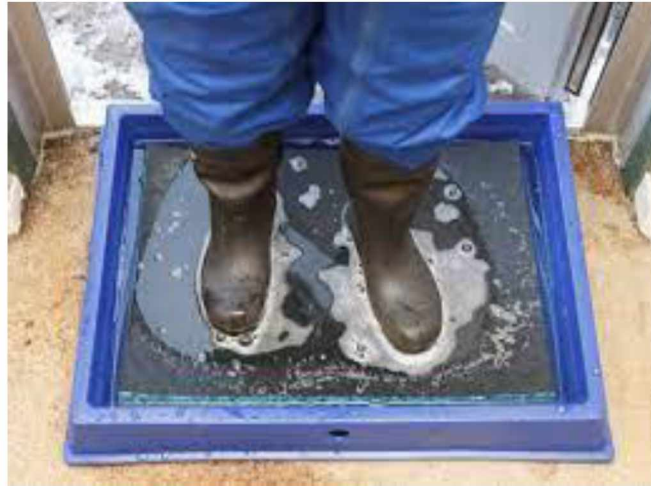
Slika 4. Dezinfekcijska barijera za obuću.

tjedno, a vrstu dezinficijensa (djelatnu tvar) svakih nekoliko mjeseci. Kod niskih temperatura otopini dezinficijensa dodaje se 5 do 10 %-tna otopina kuhinjske soli da se spriječi smrzavanje. Kao dezinficijens uglavnom se koristi 2 do 3 %-tna otopina natrijeve lužine. Dezbarijere za obuću postavljaju se i na prijelazu iz objekta u objekt (Slika 4). Za dezinfekciju predmeta koji ulaze na farmu preporuča se osigurati UV komoru (VUČEMILO, 2007.; ANTUNOVIĆ i sur., 2012.).