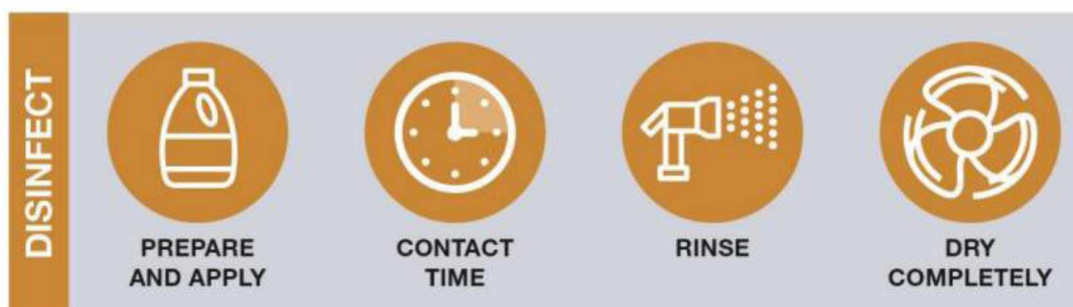
Slika 6. Pravilan postupak dezinfekcije.

Postupak kemijske dezinfekcije prikazan je na Slici 6, a obuhvaća pripremu i aplikaciju odgovarajućeg dezinficijensa, vrijeme djelovanja, koje se često previdi pa dezinficijens djeluje kraće nego što je to nužno, zatim ispiranje vodom nakon što je prošlo određeno kontaktno vrijeme, kako bi se uklonili ostaci dezinficijensa, te potrebno vrijeme sušenja. Korake u čišćenju i dezinfekciji peradarske nastambe prikazuje Slika 7.