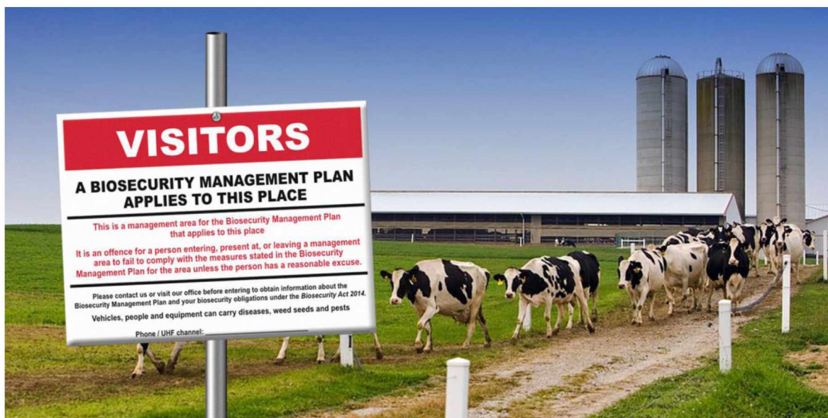
Slika 1. Plan biosigurnosti jedinstven je za svaku farmu.