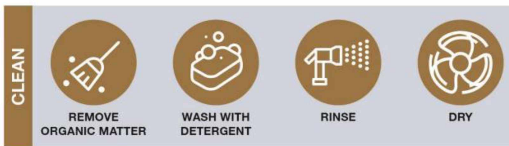
Slika 5. Pravilan postupak čišćenja i pranja.