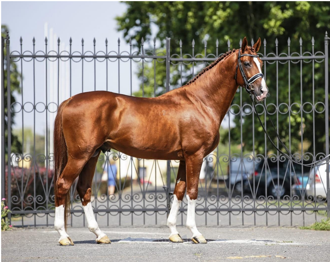
Slika 1. Gidran