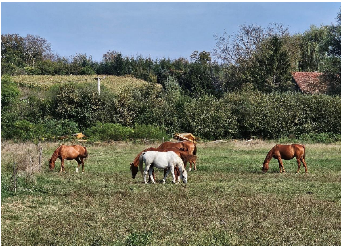
Slika 3. Ispust privatnog uzgajivača gidrana