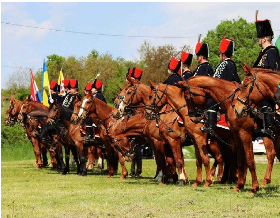
Slika 2. Bjelovarski husari i gidrani na Međunarodnom kongresu u Osijeku

Upravo zbog navedenih osobina same pasmine, danas se gidrani koriste za gotovo sve sportske jahaće discipline – daljinska jahanja, preponsko jahanje, dresura, eventing, cross country, zaprežni sportovi, rekreativno jahanje i manifestacije (KOVAČIĆ i sur., 2019.).