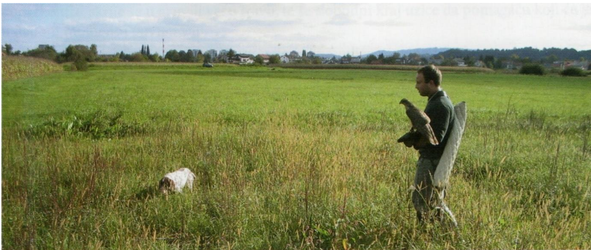
Slika 26. Lov s ruke sa jastrebom i psom ptičarom.

Osim ptičara, mogu se koristiti i psi šunjkavci koji neće markirati divljač, već će ju podizati u krugu od dvadesetak metara (ŠEGRT, 2006.).