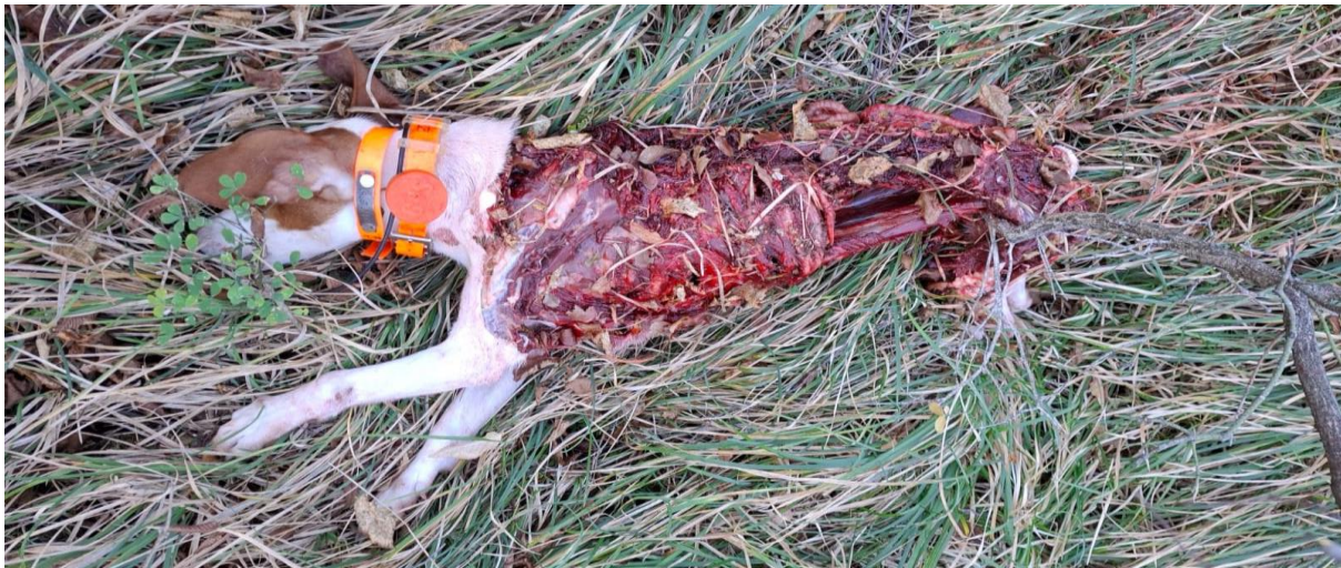
Slika 9: Lovački pas gonič usmrćen i djelom pojeđen od vukova tijekom lova na planini Svilaji 10. 11. 2024.