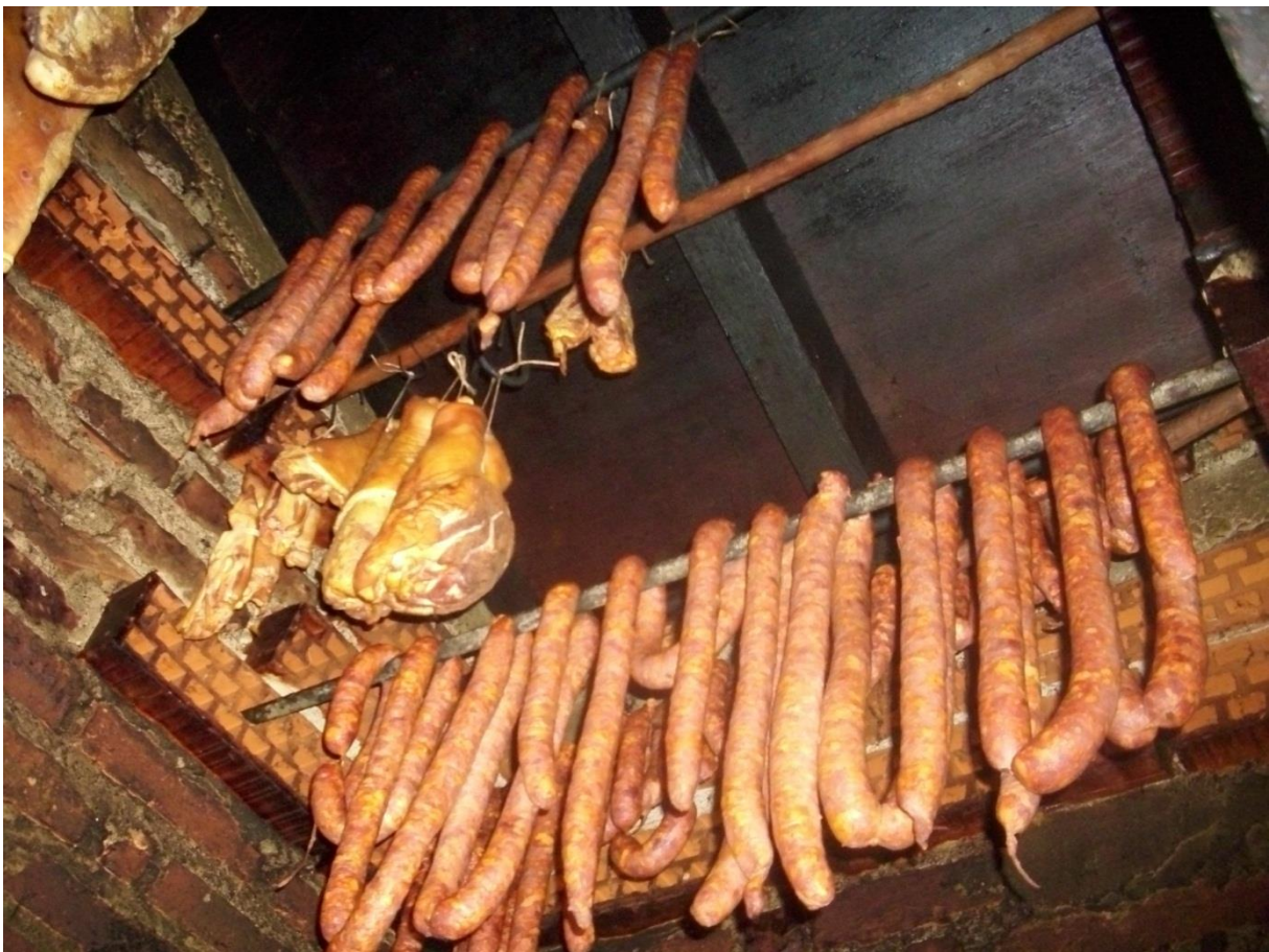
Slika 1. Detalj iz klasične pušnice

populacija kvasaca, plijesni te enterokoka. Svi oni utječu, zasebno i združeno s tkivnim enzimima, na način i stupanj mijenjanja senzornih svojstava kobasice (okus, miris, boja, aroma, konzistencija itd.). Princip metaboličke aktivnosti spomenutih mikroorganizama ustaljen je i možemo reći prepoznatljiv u svakom mesnom supstratu, međutim raznolikosti u načinu proizvodnje fermentiranih kobasica, sirovini i dodatnim sastojcima, podneblju itd. uvelike utječe na stupanj «afirmacije» pojedinih mikrobnih vrsta ili sojeva, a posljedično i na pokazatelje kakvoće i sigurnosti kobasica (ZDOLEC, 2007.).