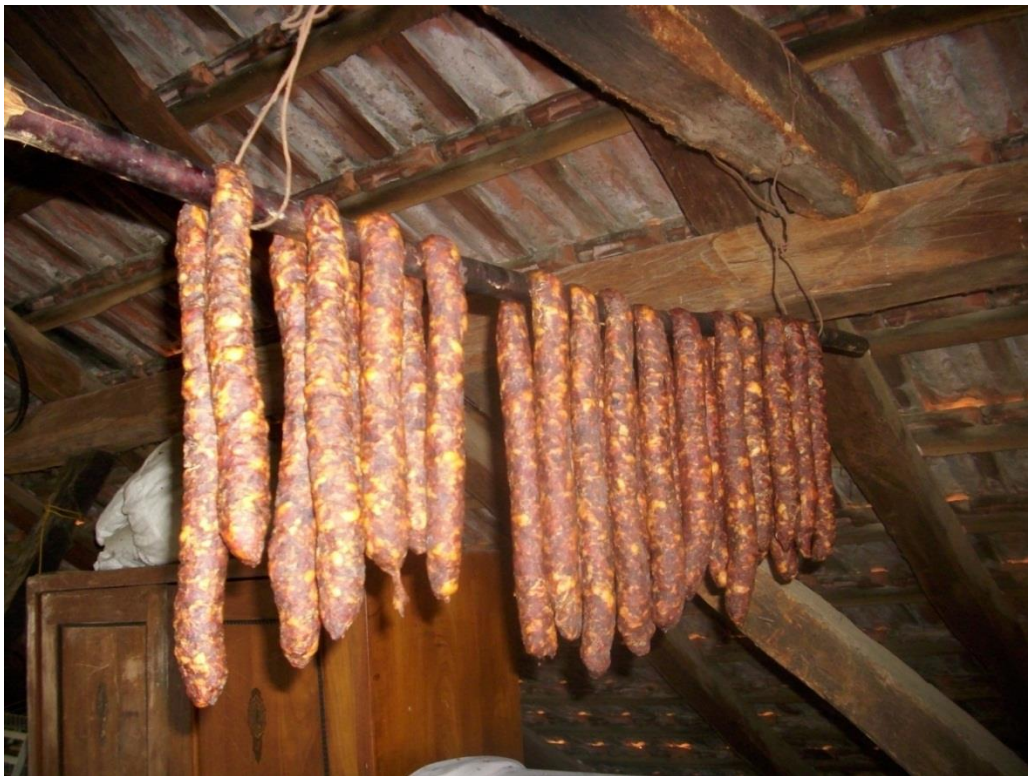
Slika 1. Tradicionalne fermentirane kobasice iz domaćinstva

Proizvodnja domaćih trajnih kobasica u našoj zemlji ima jako dugu tradiciju (ŽIVKOVIĆ, 1986.). Tijekom procesa zrenja se odvijaju jako složeni mikrobiološki, biokemijski ali i fizikalno-kemijski procesi koji utječu na sigurnost i na kakvoću proizvoda (HADŽIOSMANOVIĆ i sur., 2005.). Stupanj početne mikrobne kontaminacije će ovisiti o mikrobiološkoj kakvoći sirovine i dodataka kao i o (ne)higijenskom pristupu prilikom proizvodnje (ZDOLEC, 2007.). Tipične fermentirane kobasice su karakteristične za određena područja (npr. slika 1, Prigorje) kako po svojoj tehnologiji proizvodnje i karakterističnim senzornim svojstvima tako i po dominaciji određene vrste mikroorganizama u nadjevu.