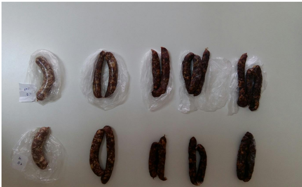
Slika 2. Kontrolne i eksperimentalne kobasice prema danima zrenja (s lijeva na desno od 0., 7., 14., 30. i 40. dan).

Na slikama 2-4 prikazane su kobasice iz istraživanja, prema fazama zrenja (0.-40. dan), te presjek kobasica (40. dan)