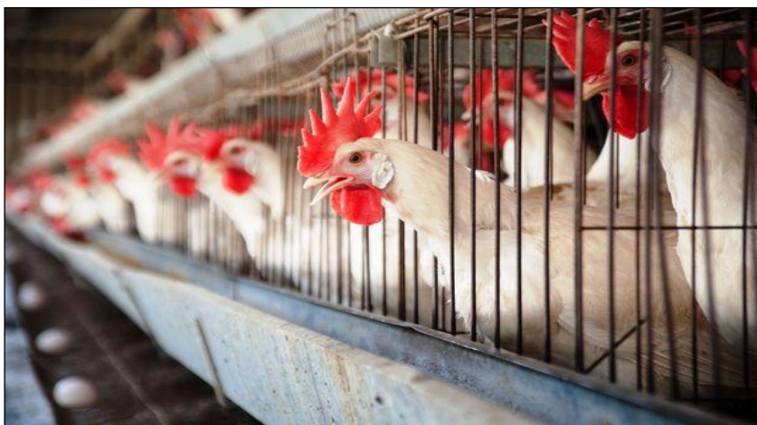
Slika 19. Konvencionalni baterijski kavezi za kokoši nesilice

Proizvođači i znanstvenici složili su se da uvjeti u alternativnim sustavima uzgoja moraju biti što sličniji konvencionalnom načinu držanja kokoši nesilica. Nužno je poboljšati iskorištavanje kutija za gnijezda i smanjiti mogućnost nesenja jaja na pod, njihovo prljanje i lomljenje. Proizvodnost u alternativnim sustavima može također biti poboljšana usvajanjem strategija upravljanja. Alternativni sustav zahtijeva značajan napor u upravljanju proizvodnjom. Iako su visoka proizvodnost, niska smrtnost i sigurno radno okruženje ostvarivi, vještine upravljanja moraju se razvijati kako bi se steklo iskustvo. Razvijanje pogodnog alternativnog sustava držanja kokoši nesilica zasigurno će zahtijevati vremena i rada, ali će svakako bolje povezati potrebe peradi, proizvođača, industrije i okoliša te udovoljiti zahtjevima potrošača (Matković i sur., 2007.; 2013.).