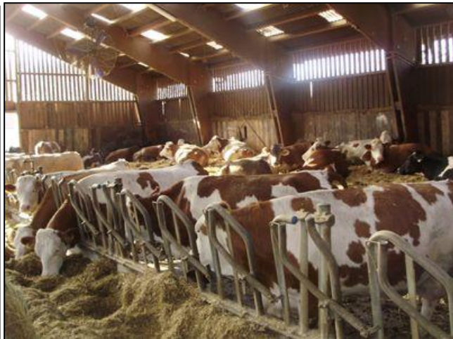
Slika 11. Držanje mliječnih krava u staji s vanjskom klimom

Sukladno Zakonu o zaštiti životinja (Narodne novine 135/06, 37/13), vrsta, kvaliteta i količina hrane za životinje mora biti u skladu s njihovom vrstom, dobi i fiziološkim potrebama, a u svrhu očuvanja zdravlja i dobrobiti. Važan čimbenik koji utječe na proizvodnost goveda je dnevna količina unosa hrane (Mašek i sur., 2012.), a hranidba goveda specifična je zbog njihovih potreba za hranjivim tvarima, odnosno fizioloških značajki kao