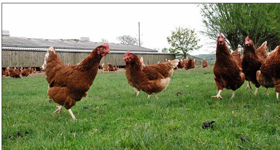
Slika 22. Slobodno držanje kokoši nesilica na otvorenom