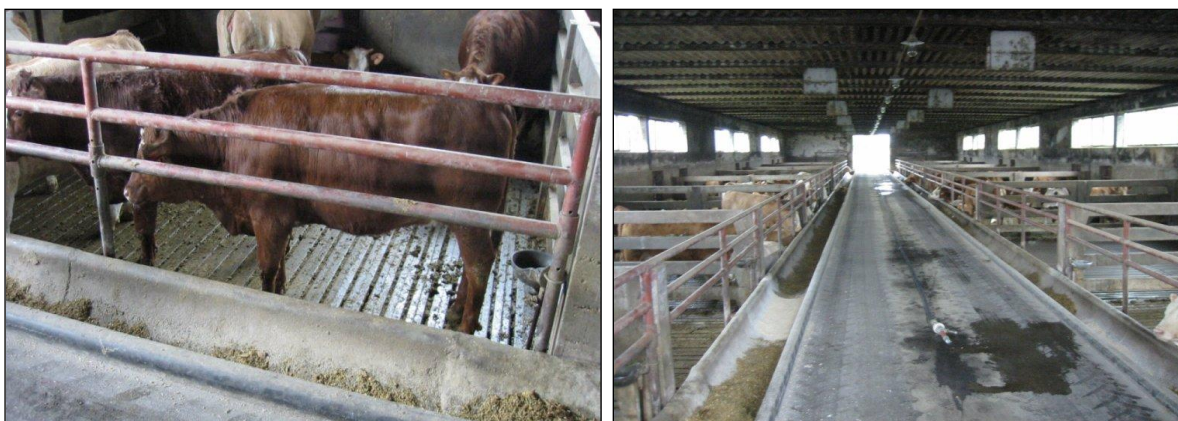
Slika 3. Tov junadi na rešetkastom podu