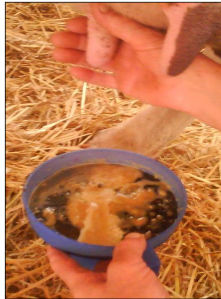
Slika 8. Sekret iz upaljenog vimena