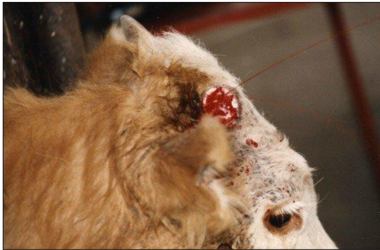
Slika 1. Odrožnjavanje goveda

Odrožnjavanje je postupak kojim se uklanja rožina roga i sloj kože oko roga, a ovisno o dobi životinje, i koštanog tkiva procesusa kornualisa. Provodi se u cilju sprječavanja međusobnog ozljeđivanja, smanjenja rizika od ozljeđivanja ljudi, boljeg iskorištavanja stajskog prostora, lakše manipulacije i prijevoza, preveniranja mogućeg nepravilnog rasta rogova i ozljeda glave životinje te materijalnih šteta u uzgoju rogatih goveda. Preporučuje se odrožnjavanje teladi u dobi od 2 do 4 mjeseca starosti jer je tada najsigurnije da će se postupkom postići željeni učinak – da rog više ne raste. Postupak je bolan te se mora izvoditi pod provodnom anestezijom. Kod teladi do 2 mjeseca starosti provodi se samo termokauterizacija kože oko baze rožnog pupoljka, a kod teladi u dobi od 2 do 6 mjeseci prvo se odsijeca osnova roga s prstenom kože oko baze roga, a krvarenje se zaustavlja termokauterizacijom (Babić, 2012.). Nakon zahvata preporučeno je aplicirati depo-antibiotik i nesteroidni protuupalni lijek kako bi se suzbila upala i bol. Svakako, najbezbolniji način odrožnjavanja je uzgoj bezrožnih goveda (Gregory, 2007.).