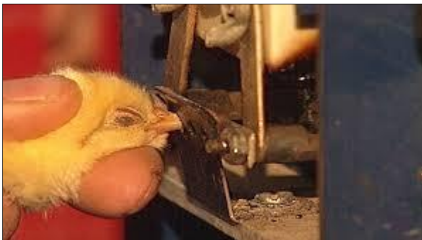
Slika 23. Skraćivanje kljunova kod pilića

Kako bi se spriječilo kljucanje perja i kanibalizam, provodi se skraćivanje kljunova peradi, što je izrazito bolan zahvat te ne isključuje pojavu agresivnosti niti razvoj ovih poremećaja u ponašanju, već samo umanjuje sposobnost ptice da iščupa pero (Broom i Fraser, 2007.). Skraćivanje kljunova u svrhu sprječavanja kljucanja perja i kanibalizma dopušteno je samo pod uvjetom da zahvat izvede osposobljena osoba i to samo na pilićima mlađim od 10 dana koji su namijenjeni za proizvodnju jaja (Narodne novine 77/10., 99/10., 51/11.).