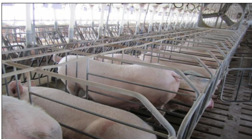
Slika 12. Pojedinačno držanje gravidnih krmača i nazimica

Prema Pravilniku o minimalnim uvjetima za zaštitu svinja (Narodne novine 119/10.), krmače i nazimice moraju se držati u skupinama u razdoblju koje počinje 4 tjedna nakon