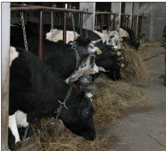
Slika 10. Držanje mliječnih krava na vezu

Mliječne krave uglavnom se drže pojedinačno na vezu ili slobodno – u stajama s ležišnim odjeljcima, rešetkastim podom ili dubokom steljom, ili u stajama s vanjskom klimom (Vučemilo, 2012.). U usporedbi s kravama držanim na otvorenom, na pašnjaku, kod krava držanih u staji puno se češće razvija hromost, posebice ako je pod vlažan i nedovoljno nasteljen. Pojava mastitisa je prvenstveno vezana uz higijenu mužnje, no na nju utječu i drugi čimbenici, uključujući i uvjete držanja. Nedostaci držanja mliječnih krava dodatno su naglašeni ukoliko su staje još i prenapučene. Većina nedostataka pojedinih načina držanja mliječnih krava već je dobro poznata, a sve ukazuje na to da krave imaju poteškoća s prilagodbom na te uvjete, naročito na rešetkaste podove i ležišne odjeljke. Držanje na stelji se pokazalo najučinkovitijim u zadovoljavanju njihovih ponašajnih potreba i interakcije s okolišem. Način držanja utječe na dobrobit životinja, a za krave je karakteristično da se lakše i brže privikavaju na dane uvjete ako imaju rutinu, kao što je hranjenje svaki dan u isto vrijeme, mužnja u podjednakim skupinama itd. (Broom i Fraser, 2007.).