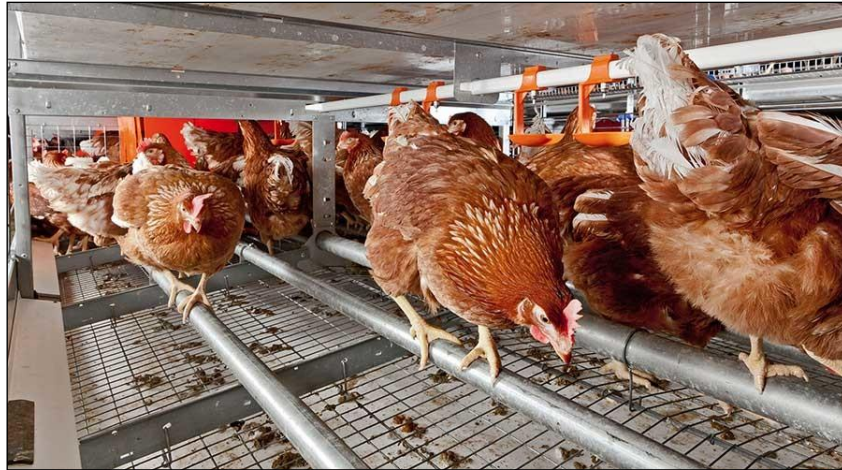
Slika 20. Obogaćeni kavezi za kokoši nesilice