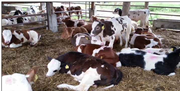
Slika 2. Tov junadi na dubokoj stelji

U nekim tovilištima česte su ozljede životinja, čemu se ponekad ne pridaje dovoljno pozornosti iako su jasan znak da postoji problem dobrobiti. Ozljede mogu nastati u nastambama za uzgoj, tijekom prijevoza te u klaoničkim objektima kao rezultat grube manipulacije životinjama prije klanja (Rushen i sur., 2008.). U većini slučajeva radi se o ozljedama u području stražnjih ekstremiteta, najčešće kuka i koljena. Osim zbog grube manipulacije, do ozljeđivanja zglobova može doći i uslijed pada životinja na skliskom podu. Ozljede ramena mogu se javiti kao posljedica sudaranja životinja tijekom prijevoza ili kod nasilnog povlačenja životinja koje su u ležećem položaju (Gregory, 2007.). Rushen i sur. (2008.) navode rezultate istraživanja provedenog u SAD-u koje je obuhvatilo 12.000 jedinki, odnosno trupova tovne junadi u klaonicama, iz kojih se dalo zaključiti da su ozljede učestali problem njihove dobrobiti. Naime, čak 45% pregledanih jedinki/trupova imalo je manji broj krvnih podljeva, 16% višestruke podljeve, a 5% značajne kritične ozljede. Slični rezultati dobiveni su i istraživanjem provedenim u Kanadi. Ozljede ekstremiteta mogu nastati i kao posljedica međusobnog naskakivanja goveda, posebice na skliskim površinama (Gregory, 2007.).