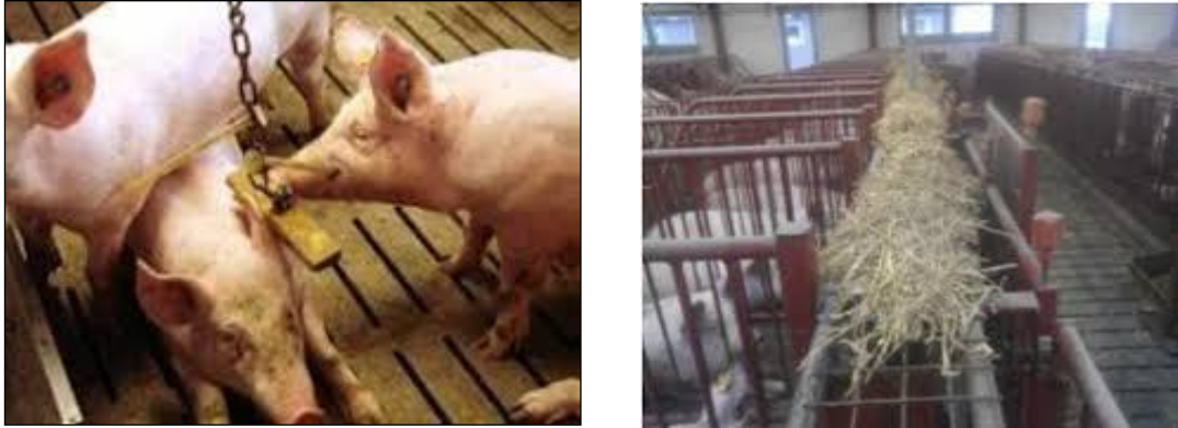
Slika 15. Primjeri materijala za istraživanje i manipulaciju pri držanju svinja na rešetkastom podu

pokazali supstrati određene hranidbene vrijednosti, kao što je duboka stelja i peletirana hrana raspršena u stelji, dok su konopci i predmeti poput komada drveta slabije učinkoviti (Anonimno, 2011.a).