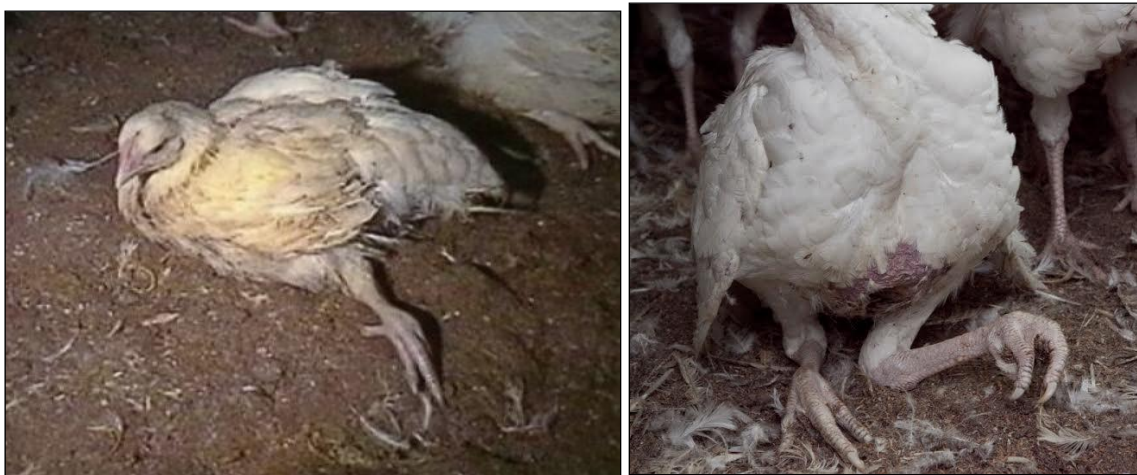
Slika 16. Deformacije nogu kod pilića u tovu (izvor: www.zivinarstvo.com )

uginuća iznosi tek 37 do 69 sekundi. Ascites se razvija postupno te je karakteriziran hipertrofijom i dilatacijom srca, promjenama u funkciji jetara, insuficijencijom pluća, hipoksemijom i zadržavanjem veće količine tekućine u trbušnoj šupljini (Vučemilo, 2008.).