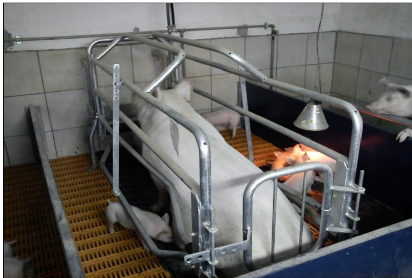
Slika 13. Prasilišni odjeljak

Krmači je ovakvim držanjem dobrobit narušena na više načina. Naime, uklještenjem joj je onemogućeno iskazivanje ponašanja tipičnog za vrstu, poput traženja hrane i gradnje gnijezda, jer se u odjeljcima najčešće ne koristi stelja zbog rešetkastog poda (Pavičić, 2012.a). Takav pod je često i klizav te dolazi do pada i ozljeđivanja krmače, ali i prasadi. Također, krmači su onemogućene tjelesne aktivnosti i odmor od prasadi te je ograničena interakcija krmače s prasadi. Osim toga, različite su optimalne vrijednosti temperature zraka za krmaču i prasad. Prasadi je potrebno osigurati više vrijednosti temperature zraka nego krmačama, koje su posebice osjetljive na visoku temperaturu u području glave. Nazimice se često teško prilagođavaju na odjeljke za prasenje, što uzrokuje stres i njihovu češću agresivnost prema prasadi od starijih krmača (Gregory, 2007.).