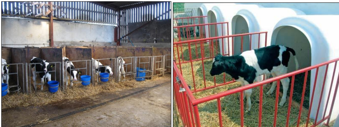
Slika 9. Pojedinačno držanje teladi

110/10.), tele starije od 8 tjedana ne smije biti smješteno u zasebnom odjeljku, osim ako doktor veterinarske medicine potvrdi da ga je zbog njegova zdravlja ili ponašanja potrebno odvojiti u svrhu liječenja.