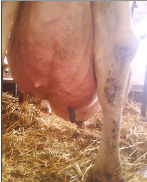
Slika 7. Mastitis