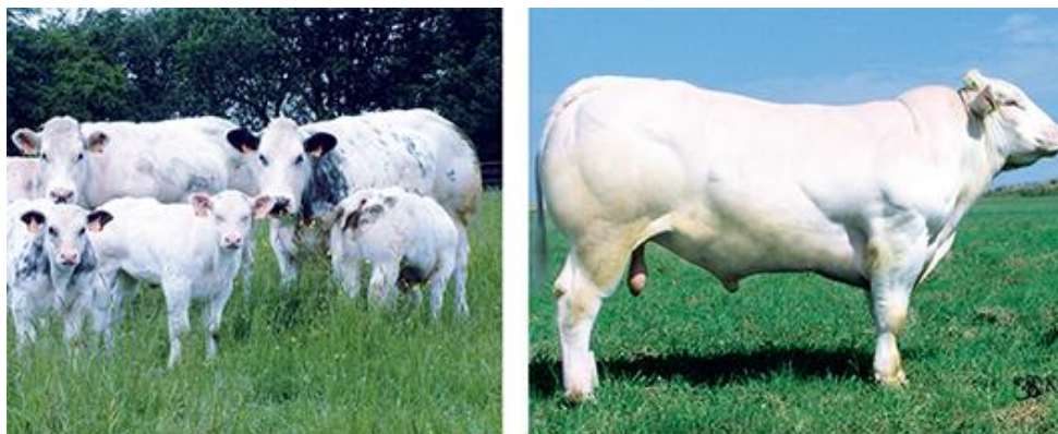
Belgijsko plavo govedo

ploda i porođajnog kanala je paraliza ishijadičnog ili obturatornog živca, što životinji onemogućava stajanje, a kod 30% životinja paraliza je trajna (Gregory, 2007.).