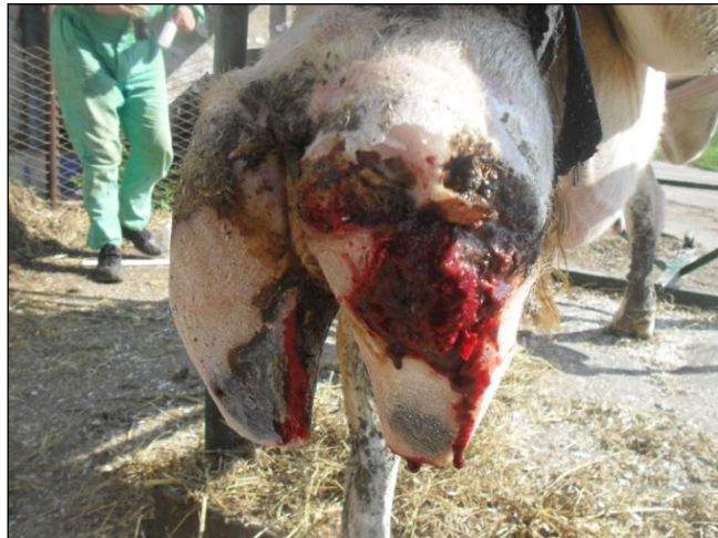
Slika 6. Laminitis

Bitan čimbenik u nastanku hromosti su uvjeti držanja mliječnih krava. Naime, dugotrajno stajanje u vlažnoj stelji i fecesu pogoduje razvoju bakterija te uzrokuje razmekšavanje rožine papaka (Gregory, 2007.).