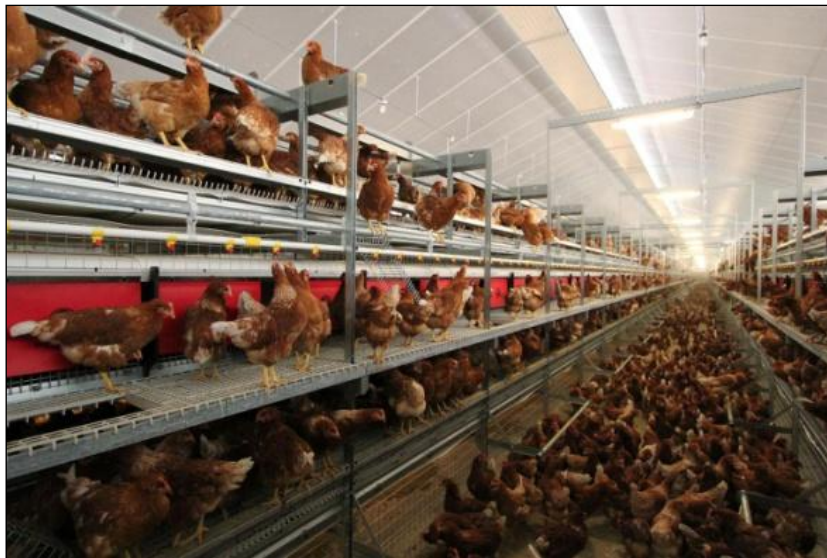
Slika 21. Avijarij