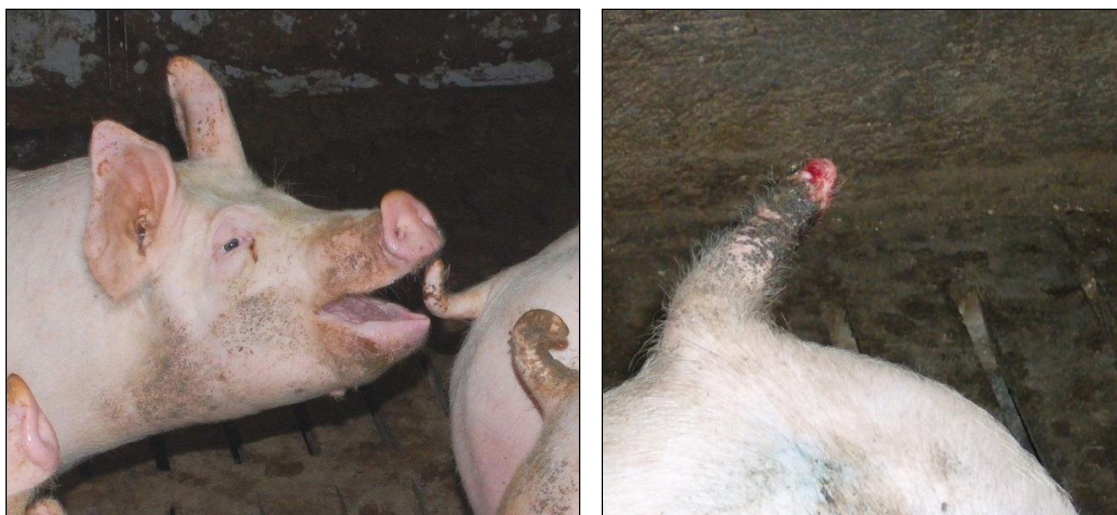
Slika 14. Grizenje repova kod svinja