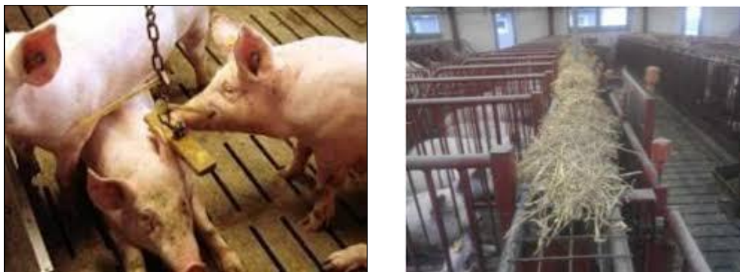
Slika 15. Primjeri materijala za istraživanje i manipulaciju pri držanju svinja na rešetkastom podu

pokazali supstrati određene hranidbene vrijednosti, kao što je duboka stelja i peletirana hrana raspršena u stelji, dok su konopci i predmeti poput komada drveta slabije učinkoviti (Anonimno, 2011.a).