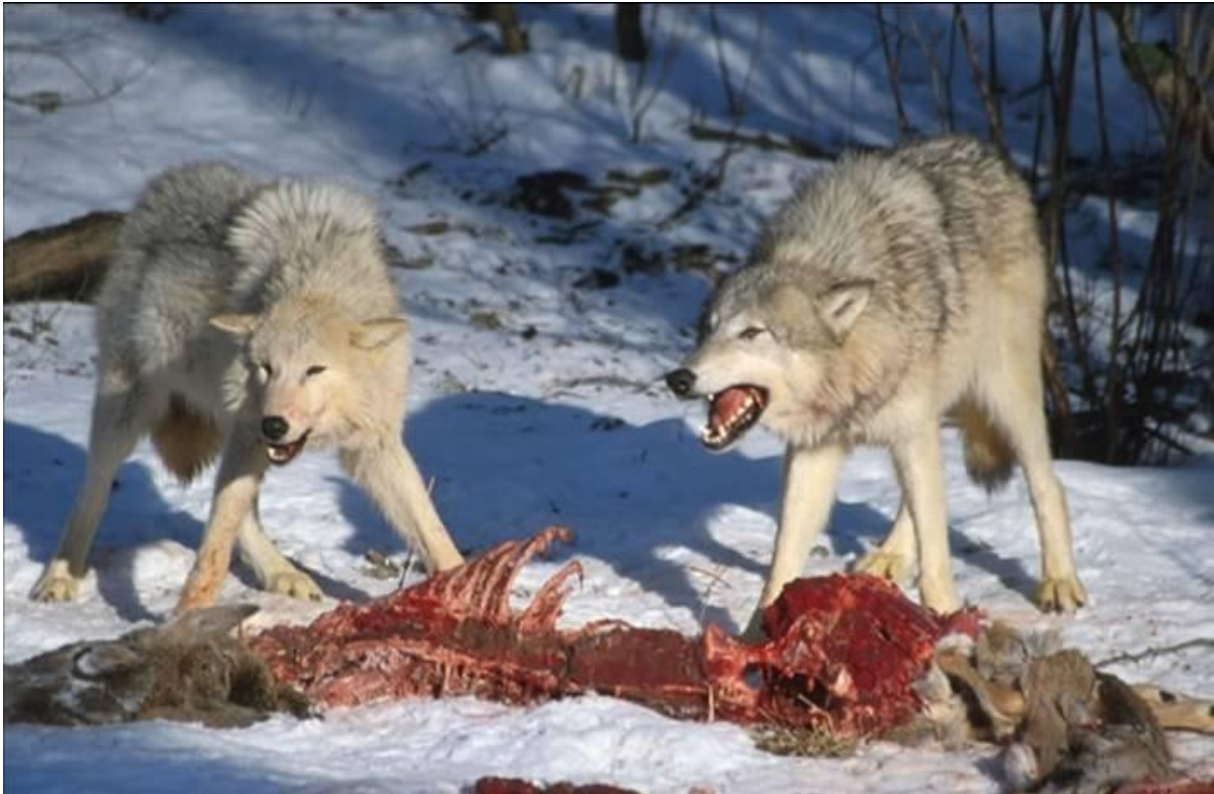
Slika 1. Vukovi konzumiraju sirovo meso jelena

U Hrvatskoj je najpoznatiji BARF (Biologically Appropriate Raw Food, odnosno biološki usklađena sirova hrana, a naglasak te filozofije prehrane je da hrana treba biti sirova i bez štetnih dodataka kojima obiluju drugi načini prehrane. U ovom diplomskom radu opisati ćemo pozitivne i negativne strane prehrane sirovom hranom (BARF-om) u pasa.