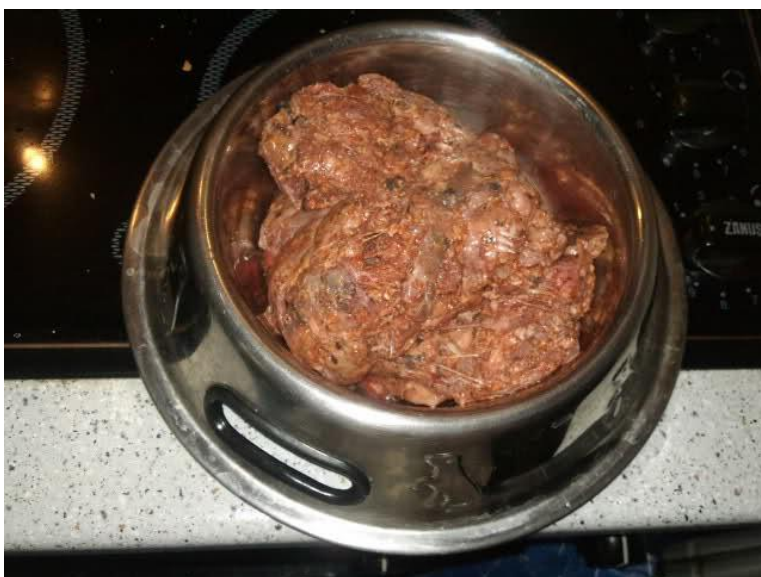
Slika 3. Sirova hrana za pse (BARF) prije hranjenja

Glavna razlika između pojmova BARF i Raw je u vrsti namirnica. Raw prehrana može sadržavati većinu sirovih namirnica npr. i recepte bez kostiju i mesa, a u BARF-u moraju biti kosti i meso. Pravilna prehrana za psa je ona koja psu osigurava uravnotežen unos proteina, bjelančevina, masti, vitamina, minerala i ugljikohidrata. Kod dehidrata to je dobiveno tvorničkim putem i zapakirano u dehidrat (suha hranu za pse). Smisao hranjenja psa BARF-om je omogućiti mu sve to kostima i raznolikim sirovim namirnicama. Nije dovoljno davati mu samo svježe namirnice, već one kao što je slučaj i s dehidratom moraju biti uravnotežene ovisno o veličini psa, pasmini, težini, dobi, trenutnom zdravstvenom stanju, ali i nasljednim bolestima. Sirova prehrana najbližnja je ljudskoj prehrani, odnosno temelji se na pravilnom kombiniranju raznovrsne sirove hrane.