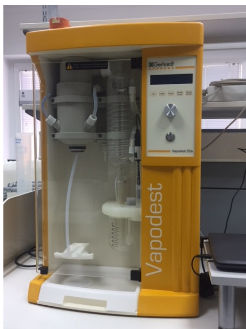
Slika 4.: Uređaj za destilaciju i titraciju, Gerhardt, Vapodest 50s