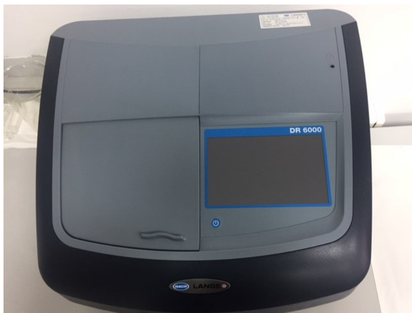
Slika 7.: Spektrofotometar DR 6000, HACH