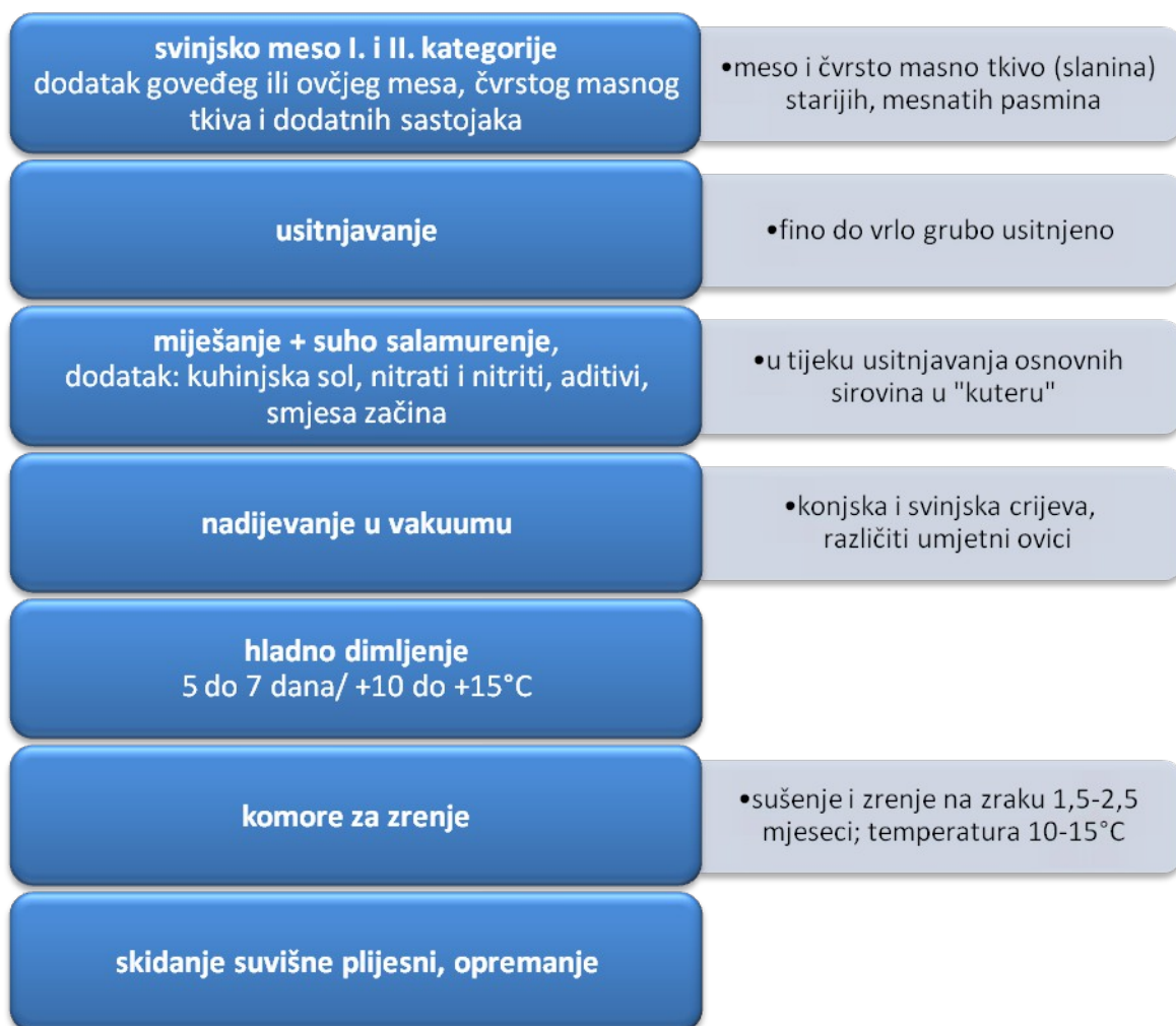
Slika 1.: Tehnološki proces proizvodnje trajnih kobasica

kobasica koriste se prije svega meso i čvrsto masno tkivo (slanina) starijih, mesnatih svinja. U postupku suhog salamurenja, koje se vrši tijekom usitnjavanja osnovnih sirovina u „kuteru“, osim kuhinjske soli, nitrata i nitrita dodaju se i drugi aditivi (GDL, šećeri, škrobni sirup, starter-kulture) i smjesa specifičnih začina. Nakon vakuum-nadijevanja i hladnog dimljenja, koje obično traje 5-7 dana na temperaturi od +10°C do + 15°C, trajne se kobasice prenose u komore za zrenje. Sam proces zrenja trajnih kobasica može se definirati kao skup fizikalno-kemijskih, biokemijskih, mikrobioloških, senzornih i drugih promjena u nadjevu zbog kojih proizvod poprima specifičan izgled, okus i aromu. U zrenju prevladavaju fizikalne promjene nadjeva u smislu gubitka vode zbog sušenja. Pritom vrijedi osnovno pravilo sušenja da količina vode koja migrira od središta prema periferiji proizvoda u svakom razdoblju zrenja mora odgovarati količini vode koja izlazi iz proizvoda. Svako remećenje navedene zakonitosti uzrokuje tehnološke pogreške pa i kvarenje samog proizvoda.