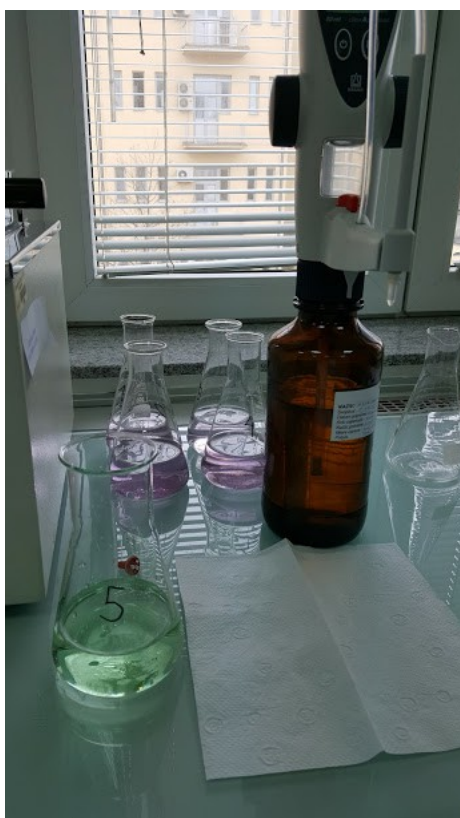
Slika 5.: Titracija sa 0,1 N klorovodičnom kiselinom