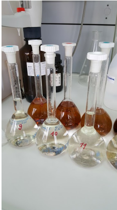
Slika 8.: Standardne otopine hidroksiprolina

dobile koncentracije hidroksiprolina od 0,5 µg/mL i 2 µg/mL (slika 8). Standardne otopine analizirane su na isti način kao i uzorci. Prije očitavanja koncentracije uzoraka očitane su koncentracije standarada te su dobivene vrijednosti uspoređene sa stvarnom koncentracijom.