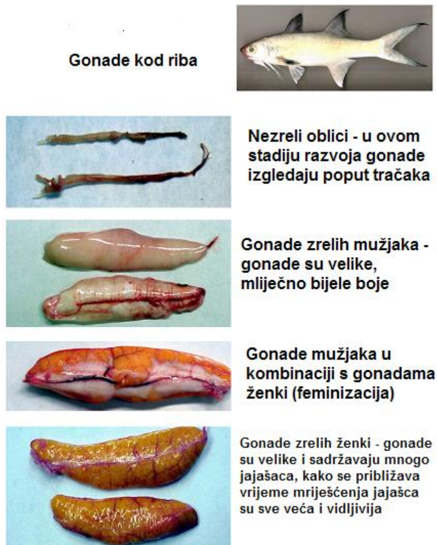
Slika 2. Makroskopski prikaz gonada riba

«Interseksualnost» je istovremena prisutnost muških i ženskih gonada kod individua (TYLER i JOBLING, 2008.). Njena najčešće zabilježena pojava je ona kod odraslih mužjaka u čijem su testikularnom tkivu prisutne jedna ili više oocita. Također, često se mogu pronaći i spermatoocite unutar jajnika, kao i oocite unutar sjemenovoda (NOLAN i sur., 2001.), a ovisno o pojavi kod akvatičnih organizama razlikujemo proces feminizacije (Slika 2.) (NOLAN i sur., 2001.) i maskulinizacije (HINCK i sur., 2007.).