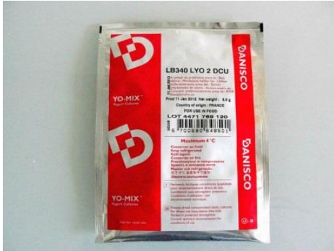
Slika 1. Liofilizirana mljekarska kultura.

Na hrvatskom tržištu dolaze u smrznutom ili liofiliziranom obliku. Smrznuti oblik ima bržu aktivnost, ali skladištenje mora biti na -40 °C. Liofilizirani oblik ima duže vrijeme prilagodbe, no skladištenje je na -18 °C.