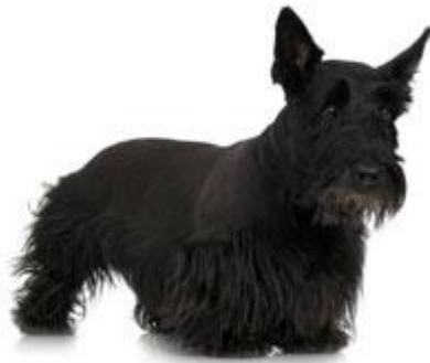
Slika 5. Scotty cramp, hodanje poput guske.

Klinički znakovi se ne javljaju dok pas vježba ili dok je pretjerano uzbuđen, tek nakon toga i mogu potrajati i do trideset minuta, te su praćeni znakovima poput: otežanog disanja i dahtanja, kontrakcija mišića lica, savijanja lumbalne kralježnice, ukočenosti stražnjih udova, hodanje poput guske, dok neki u potpunosti gube mogućnost hodanja ili trčanja pa sve do nastanka mogućeg kolapsa (ETTINGER i FELDMAN, 1995.).