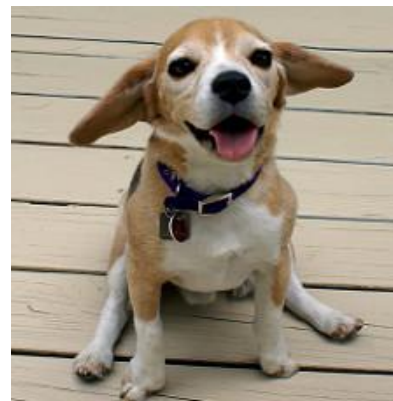
Slika 4. Koso položene oči kod sindroma.

https://www.google.hr/search?q=mitochondrijske+miopatije&rlz=1C1PRFC_enHR711HR711&espv=2&biw=1040&bih=892&source=Inms&tbm=isch&sa=X&ved=0ahUKEwidgP7riKDPAhUDbhQKHbJsBjwQ_AUIBygC#tbm=isch&q=musladin+lueke+&imgsrc=rZiuOuuWumpTXM%3A )