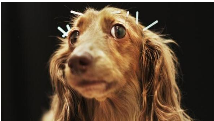
Slika 6. Akupunktura psa.

Akupunktura je tehnika liječenja živčanih i koštano-mišićnih problema.