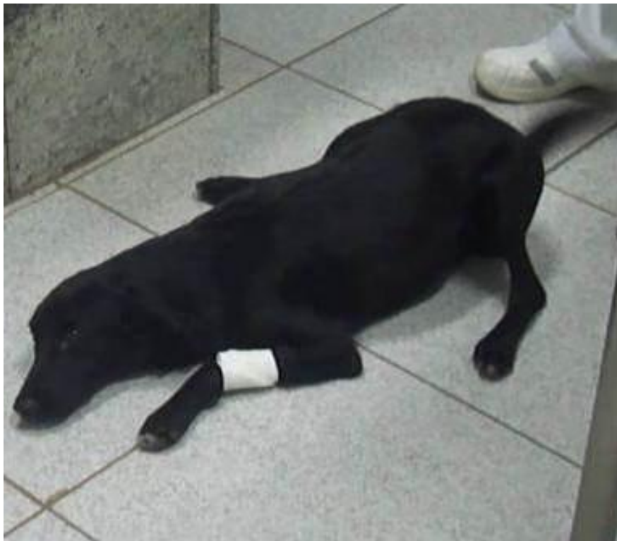
Slika1. Tetrapareza psa.

Klinički simptomi: Bolest se očituje tipičnim kliničkim simptomima podrhtavanja, slabosti, nemoći, posebno nakon šetnje. Najčešće se povlače nakon odmora. Mišići na glavi i vratu također mogu biti zahvaćeni, što kao posljedicu ima opuštenost mišića lica, te čak i otežano gutanje. Može se javiti i regurgitacija ili aspiracija hrane u dušnik što će dovesti do razvoja aspiracijske pneumonije. Javlja se i pojačana salivacija, promuklo lajanje.