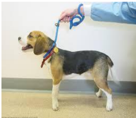
Slika3. Balerina stav.

Uglavnom se stabiliziraju do prve godine života. Kako smo naveli sindrom se manifestira tvrdom kožom ili fibrozom kože i zglobova. On nastaje zbog nedostatka gena koji je odgovoran za fibrilin-1. Genetska osnova Musladin-Lueke sindroma je gen ADAMTSL2 koji je pokazao da je u interakciji s TGF-beta veznim proteinom, koji veže fibrilin-1. Fibrilin je glikoprotein, bitan za formiranje elastičnih vlakana koja se nalaze u vezivnom tkivo, izlučuje se pomoću fibroblasta i osigurava „skelu“ za taloženje elastina. Greška gena koji je u interakciji s fibrilinom manifestira se izostankom elastina i pojavom tvrde, krute kože i zglobova.