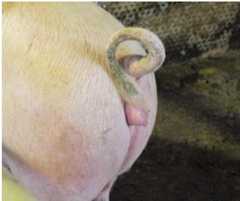
Slika 2. Nazimica sa zacrvenjenom i otečenom stidnicom (MIHALJEVIĆ i sur., 2015.)

U ovaca i koza vrlo visoke doze zearalenona dovode do smanjenja postotka ovulacije i plodnosti. (KANORA, 2009.).