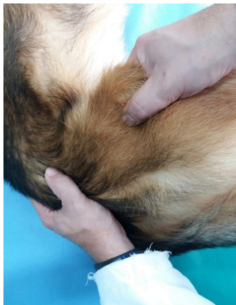
Slika 4. Izvođenje Ortolanijevog testa na boku

Ortolanijev test se izvodi tako da se životinja postavlja na bok ili leđa, zatim se uhvati ekstremitet za koljeno, adducira i potiskuje prema zdjelici, dok se drugom rukom zdjelica pridržava. Na taj način se vrši sublukcija kuka. Kuk se kod abdukcije, podizanjem koljena uz pritisak na trohanter, vraća u acetabulum. Pritom nastaje vidljivi pomak popraćen tupim prizvukom. Ovaj test je preuzet iz humane ortopedske dijagnostike nestabilnosti kukova u djece i naziva se prema autoru, Ortolanijev znak ili Orolanijev manevar (PUERTO et al., 1999).