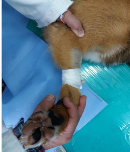
Slika 1. Pregled lakta na lakatnu displaziju, rotacijom lakta u polufleksiji

Kod svih zglobova koje pregledavamo važno je usporediti kutove maksimalne fleksije i ekstenzije s kontralateralnim ekstremitetom. Nakon lakta pregledava se rameni zglob i to probama fleksije i ekstenzije (CANNAP, 2007). Pri pregledu ramena u fleksiji i ekstenziji jednom rukom hvatamo podlakticu i povlačimo je kaudalno ili kranijalno uz tijelo životinje, dok drugom rukom istovremeno palpiramo rameni zglob uz vršenje pritiska prstima. Kod OCD-a ovim postupkom se izaziva bol. Kad rameni zglob postavimo u fleksiju, a prisutna je upala tetive bicepsa, izazvati ćemo bol. Otečenje ramenog zgloba dosta je teško prepoznati palpacijom jer je okružen snažnom muskulaturom koja služi za stabilizaciju. Za dijagnostiku tendinitisa tetive bicepsa brachii izvodi se fleksija ramenog zgloba uz istovremeni palpatorni pritisak u žlijebu iza tubera major s medijalne strane ramena.