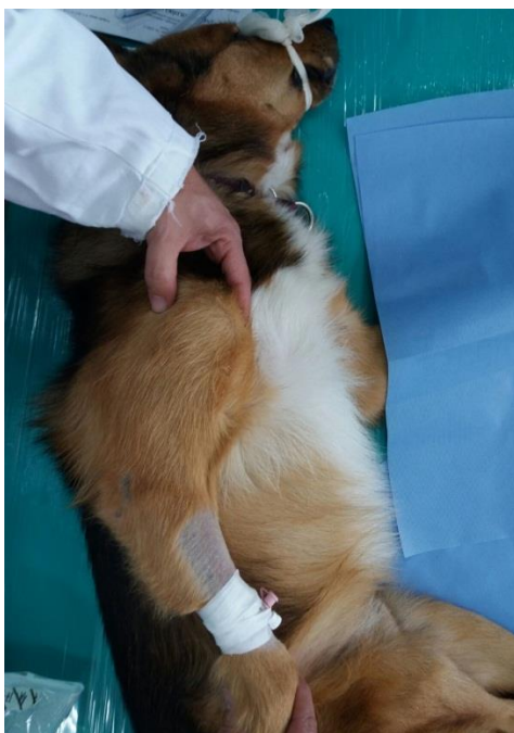
Slika 2. Fleksija ramenog zgloba uz pritisak s medijalne strane

Nakon što smo pregledali sve zglobove prelazimo na palpaciju dugih kosti. Palpaciju radimo da bi eventualno otkrili prisutnost koštanih neoplazija, osteodistrofiju, panosteitis i sl. Važno je da prilikom pregleda palpaciju radimo direktno na kost, a ne preko mišićja jer bi pritisak na mišić životinji mogao izazvati bol te će ona pokazati reakciju boli. Kod pasa starije dobi moramo uzeti u obzir mogućnost nalaza neurofibrosarkoma sa simptomima Hornerovog sindroma (LANG et al., 1998).