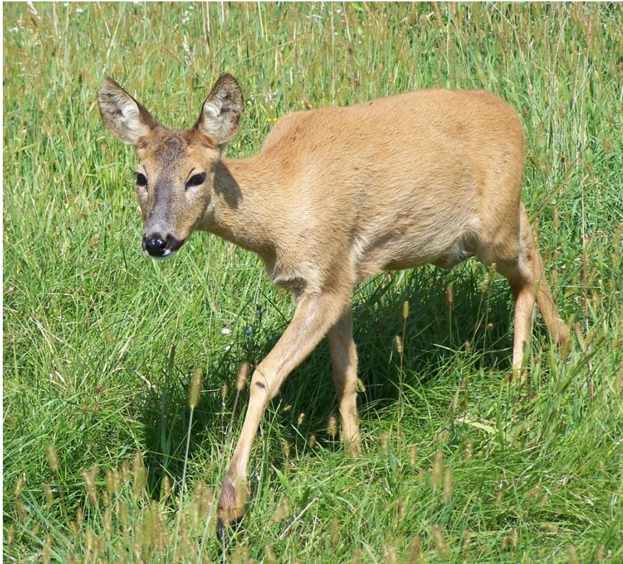
Slika 1. Srna obična, ljetna dlaka, ženka.

U grebenu je srna visoka oko 75 cm, te je dugačka 130 – 140 cm, a rep joj je dugačak do 5 cm. Ženke su manje i lakše od mužjaka za otprilike 5 – 10 %. Tjelesna masa zrelih