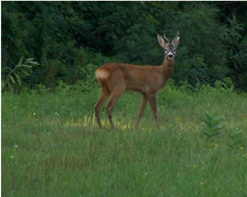
Slika 2. Srnjak.

Srnjaku rastu rogovi kao i većini punorožaca, ali postoji jedna specifičnost, a ona je