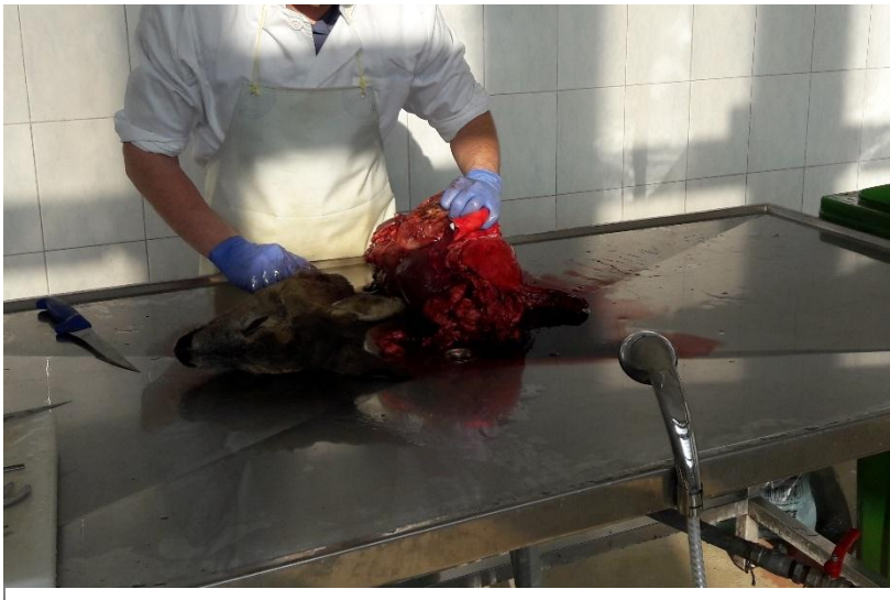
Slika 4. Otvaranje i ispiranje crijeva

Uzorci su pregledani na Zavodu za veterinarsku patologiju Veterinarskog fakulteta