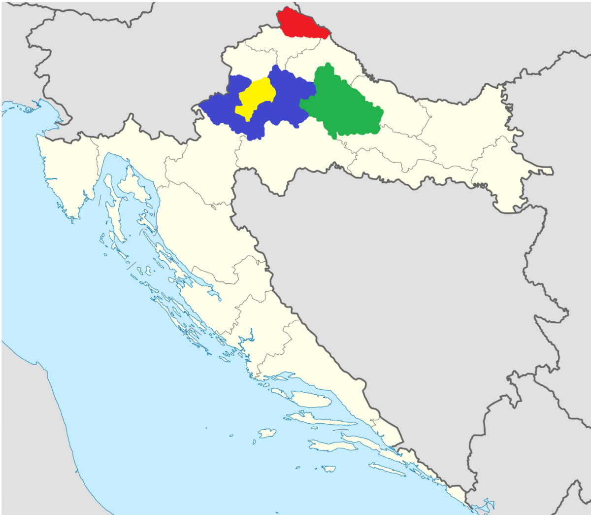
Slika 3. Bojom su označene županije iz kojih potječu uzorci: crveno – Međimurska županija; plavo – Zagrebačka županija; žuto – Grad Zagreb; zeleno – Bjelovarsko bilogorska županija

Uzorci (cijele lešine ili probavni sustav) 30 srna običnih ( Capreolus capreolus ) dostavljeni su na Veterinarski fakultet Sveučilišta u Zagrebu u okviru projekta Hrvatske zaklade za znanost pod nazivom „Molekularna epidemiologija odabranih parazitskih bolesti divljih životinja“. Dostavljene srne odstrijeljene su u sklopu redovite provedbe lovno-gospodarskih osnova, a potječu iz lovišta na području grada Zagreba (označena crvenom bojom na karti; n=1), Zagrebačke županije (označena plavom bojom na karti; n=25), Bjelovarsko-bilogorske (označena zelenom bojom na karti; n=1) i Međimurske županije (označena crvenom bojom na karti; n=3). Uzorci su potjecali iz nizinskog i brdskog staništa. Spolni omjer bio je 1:1.