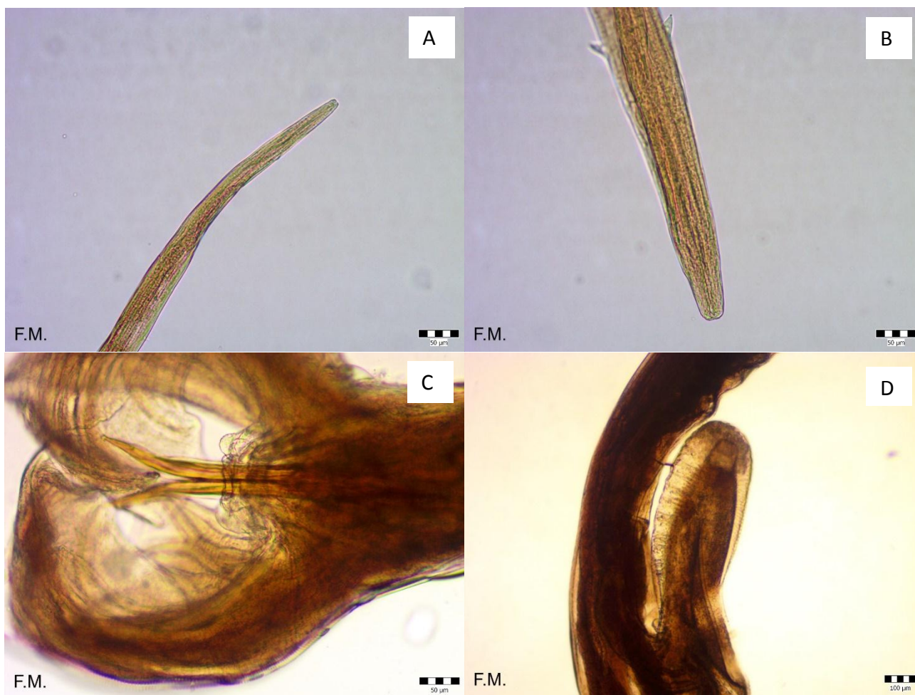
Slika 5. A - Trichostrongylus sp. (prednji kraj); B - Haemonchus contortus (prednji kraj); C - Haemonchus contortus (stražnji kraj mužjaka), D - Haemonchus contortus (vulvarni zalistak ženke).

Najčešće utvrđeni paraziti bili su oblici Trichuris sp. (n=13) s prevalencijom od 43,3% i Chabertia ovina (n=17) s prevalencijom od 56,6%. U samo jednoj jedinki utvrđena je trakavica Moniezia sp, prevalencija 3,3%. Svih pet negativnih jedinki bile su ženke. U sedam jedinki dokazan je oblik Haemonchus contortus (prevalencija 23,3%), u pet jedinki Oesophagostomum sp. (prevalencija 16,6%), u tri Ostertagia sp. (prevalencija 10%), a u dvije Bunostomum sp i Trichostrongylus sp (prevalencija 6,6% svaki).