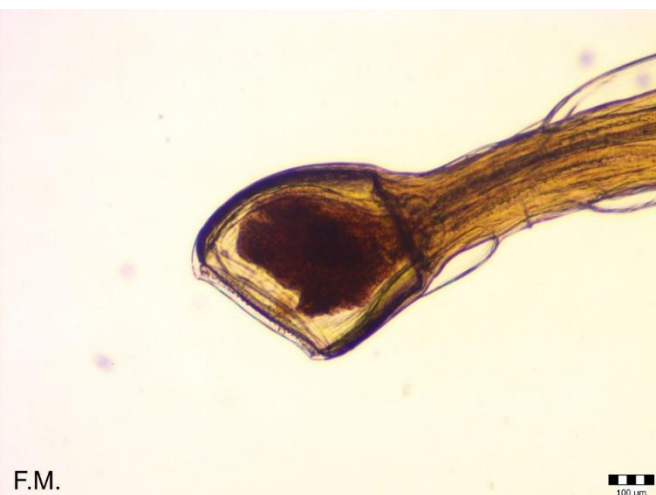
Slika 6. Oesophagostomum sp. (prednji kraj).