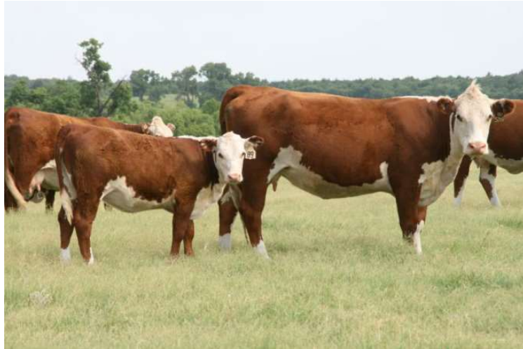
Slika 5. Krava pasmine hereford s teletom