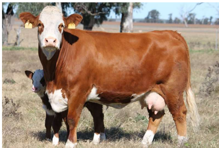
Slika 6. Krava pasmine simentals teletom

Pasmina Simentalac potječe iz Švicarske iz doline rijeke Simme po kojoj je i dobila ime. Pasmina se uzgaja i kao mliječni tip, ali i kao mesni tip. Dugotrajnom selekcijom se žele iskoristiti odlike koje su važne u proizvodnji mesa. Pasminu karakterizira šarena boja i bijela glava. Goveda su uglavnom s rogovima, ali se selekcijom u sustavu krava-tele preferiraju genetski bezrožni bikovi. Plotkinje karakterizira široka, duboka te dugačka zdjelica. Također ih karakterizira dobro i funkcionalno vime koje osigurava dobru mliječnost, čime se postiže veća težina teladi pri odbiću. Simentalac u tovu pokazuje dobar prirast te mogućnost tova do visokih klaoničkih težina.