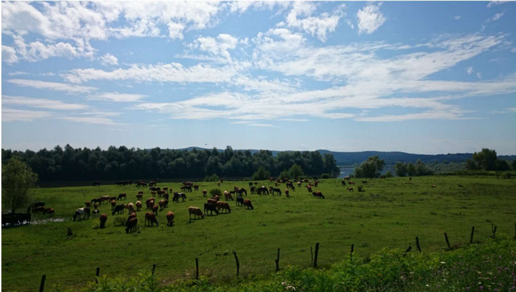
Slika 7. Krave s teladi na pašnjaku

U zimskim mjesecima krave borave u štali s vanjskom klimom na dubokoj stelji. Krave mogu slobodno izlaziti na ispust od 8ha koji je u sklopu same farme. Preko zime krave se hrane TMR obrokom od kukuruzne silaže, suhog sijena lucerne te žitne slame. Veliki dio hrane za stoku se proizvede na 80ha oranica u ratarskoj proizvodnji u sklopu poduzeća.