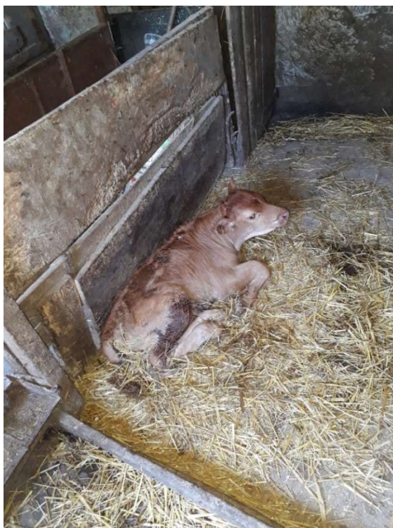
Slika 13. Tele s proljevom