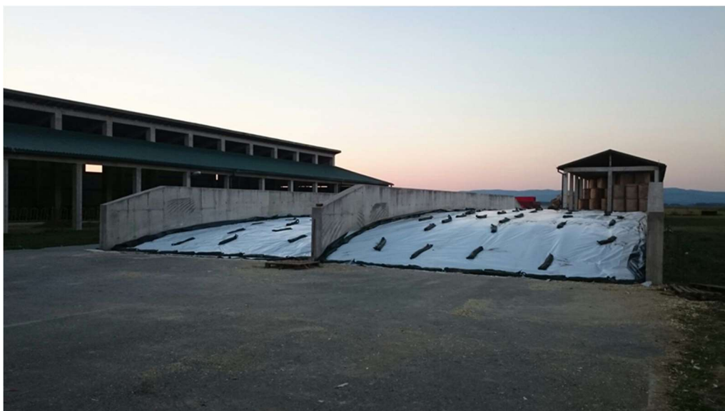
Slika 9. Silaža u horizontalnim silosima

Telad ostaje s kravama do odbića, tj. do napunjenih 4 do 6 mjeseci starosti odnosno do prosječne težine od 180kg. Nakon odbića telad se hrani smjesom za telad do težine 200 do 250kg, ovisno o potrebama tržišta. Muška telad se prodaje za daljnji tov, a ženska telad ostaje na farmi za remont stada.