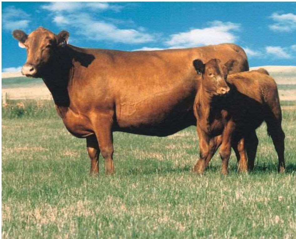
Slika 2. Krava pasmine crveni angus s teletom

U Republici Hrvatskoj je u 2015. godini registrirano 1668 krava pasmine Angus.