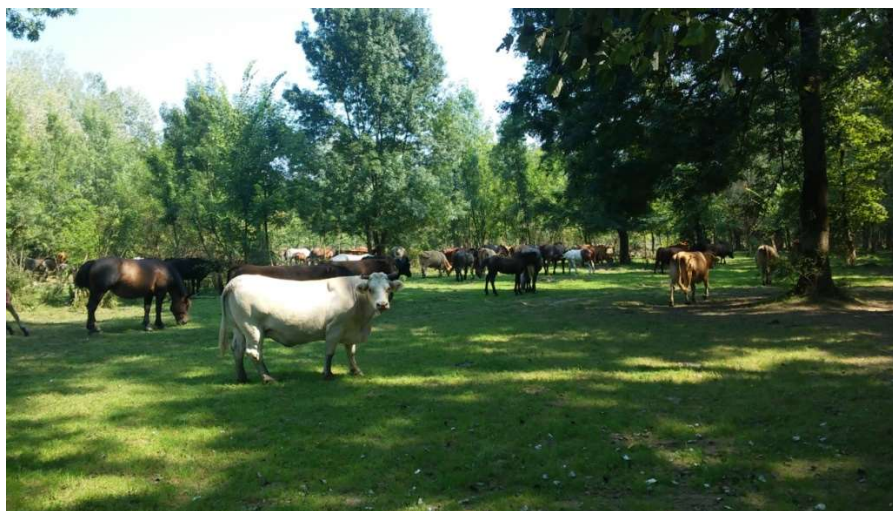
Slika 1. Krave i konji na pašnjaku

Osnovne odlike takvog načina držanja su bolja iskorištenost travnjačkih površina, jer goveda šest do sedam mjeseci provode na pašnjacima gdje se hrane isključivo travom (pašom), kao i proizvodnjom dovoljne količine teladi za proizvodnju govedeg mesa (PP ORAHOVICA, 2018). Krave se slobodno drže na pašnjacima, koji mogu biti koncipirani kao pregonski ili pašnjaci bez pregona, kao jedna cjelina, gdje se same tele i odgajaju telad. Telad se hrani mlijekom, a kasnije i sama pase. Neki proizvođači prakticiraju i prihranu teladi na pašnjaku kako bi postigli veći prirast teladi i veću tjelesnu masu kod ulaska u tov ili daljnju prodaju. Na taj se način osigurava kvalitetna telad za daljnji tov i proizvodnju kvalitetnog, i na tržištu cijenjenog, govedeg mesa. Tijekom zimskog perioda hranidba goveda se bazira na sijenu, sjenaži i kukuruznoj silaži, a pred teljenje se može dodati i smjesa za muzne krave.