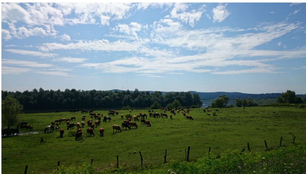
Slika 7. Krave s teladi na pašnjaku

U zimskim mjesecima krave borave u štali s vanjskom klimom na dubokoj stelji. Krave mogu slobodno izlaziti na ispust od 8ha koji je u sklopu same farme. Preko zime krave se hrane TMR obrokom od kukuruzne silaže, suhog sijena lucerne te žitne slame. Veliki dio hrane za stoku se proizvede na 80ha oranica u ratarskoj proizvodnji u sklopu poduzeća.