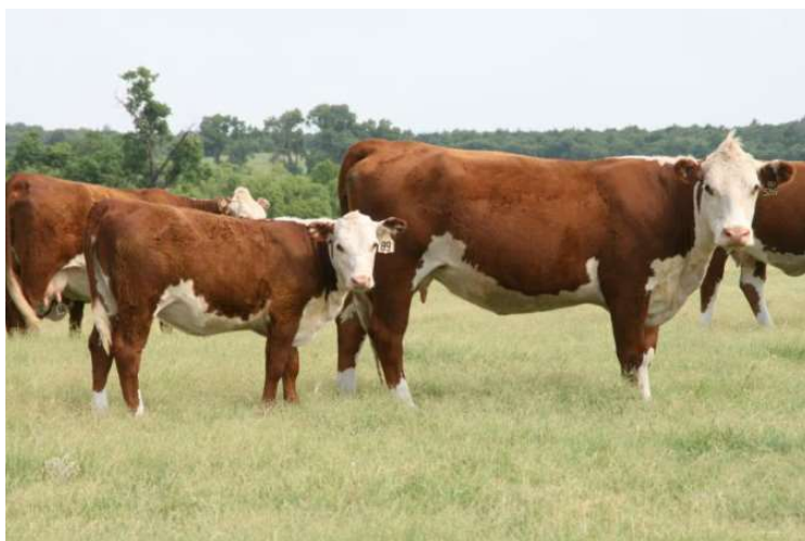
Slika 5. Krava pasmine hereford s teletom