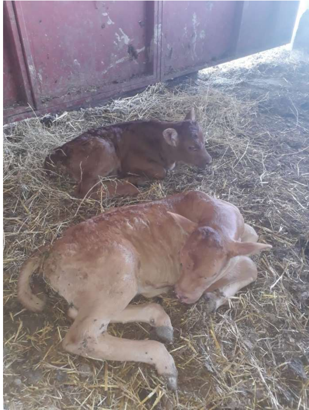
Slika 15. Telad s proljevom odvojeni u zasebni boks