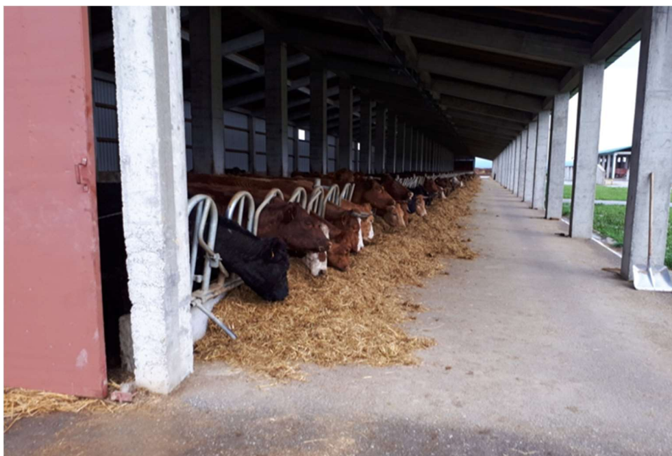
Slika 8. Goveda u štali u zimskom periodu

U zimskim mjesecima krave borave u štali s vanjskom klimom na dubokoj stelji. Krave mogu slobodno izlaziti na ispust od 8ha koji je u sklopu same farme. Preko zime krave se hrane TMR obrokom od kukuruzne silaže, suhog sijena lucerne te žitne slame. Veliki dio hrane za stoku se proizvede na 80ha oranica u ratarskoj proizvodnji u sklopu poduzeća.