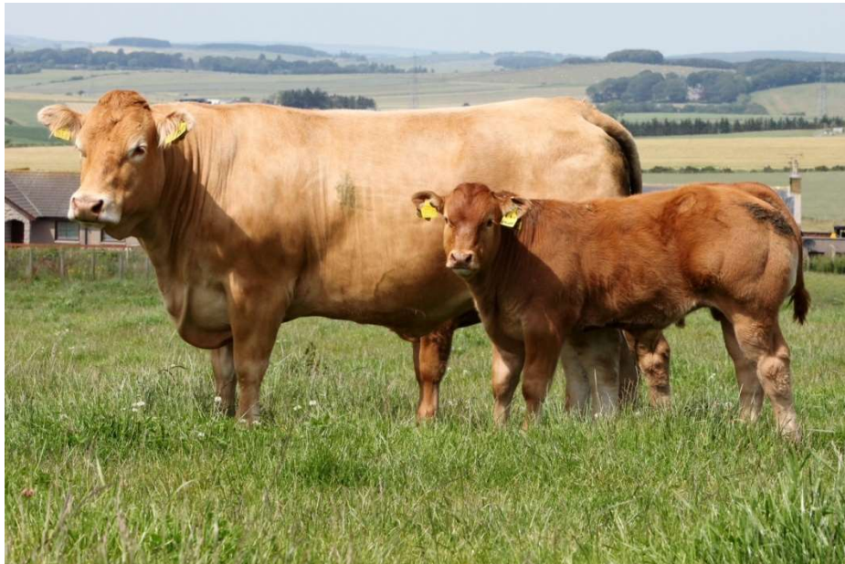
Slika 3. Krava pasmine limousin s teletom

U Republici Hrvatskoj su u 2015. godini registrirane 302 krave pasmine limousin.