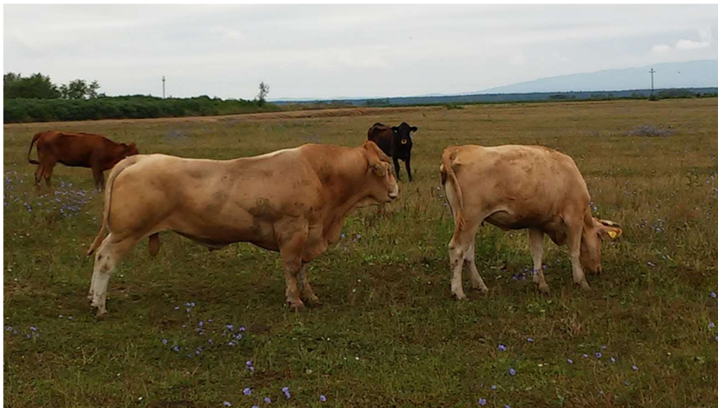
Slika 6. Bik pasmine Blond d'aquitane u prirodnom pripustu

Poljo-Davor d.o.o. je obiteljsko poduzeće kojoj je osnovna djelatnost stočarska proizvodnja i to uzgoj goveda mesnih pasmina u sustavu krava-tele. Sama farma se nalazi oko 3 km van mjesta Davor. Na farmi se nalazi 170 grla matičnog stada te njihov podmladak. Pasmine koje su zastupljene u uzgoju na farmi su Limousin i Angus koje prevladavaju, te Charolais i Hereford koje su manje zastupljene. Krave se pripuštaju prirodno, pod licencirane bikove pasmine Limousin, kojih u uzgoju ima 3 grla, te jednog licenciranog bika pasmine Blond d'aquitane. Bikovi s kravama provode veći dio godine osim u periodu od 15. prosinca do 10. lipnja, kako bi se izbjegla teljenja u zimskom periodu.