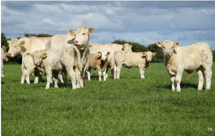
Slika 4. Charolais krave s teladi

U Republici Hrvatskoj su u 2015. godini registrirane 1385 krave pasmine charolais.