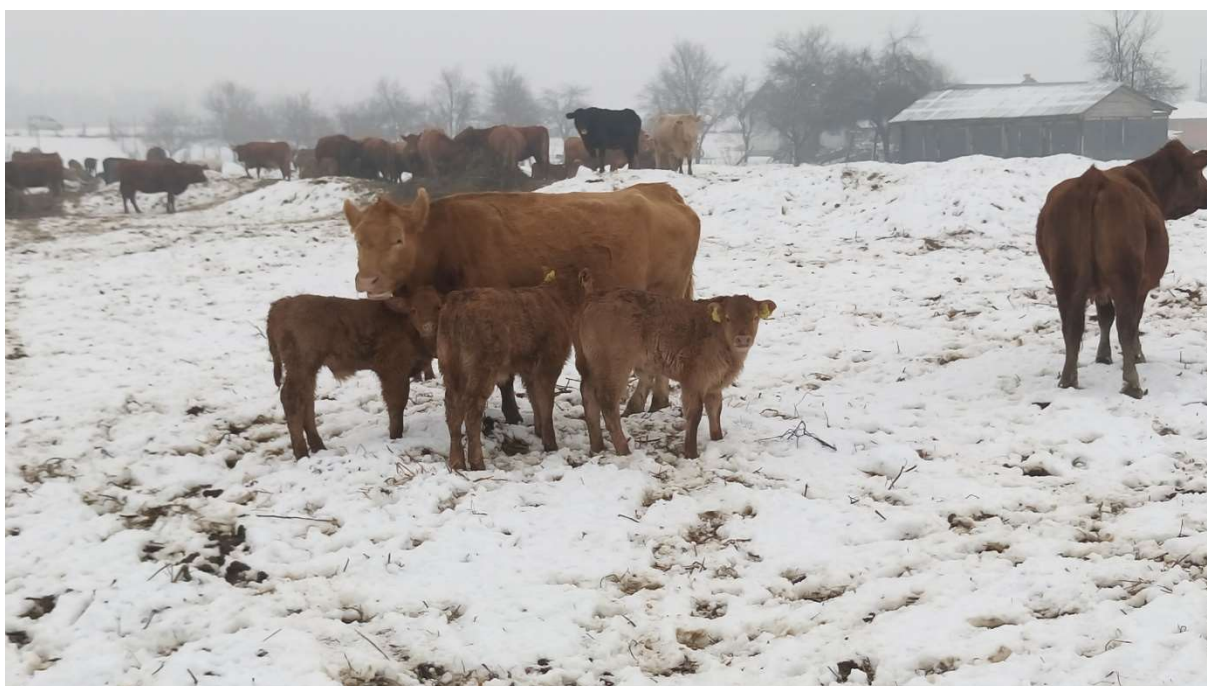
Slika 12. Telad s kravama na ispustu