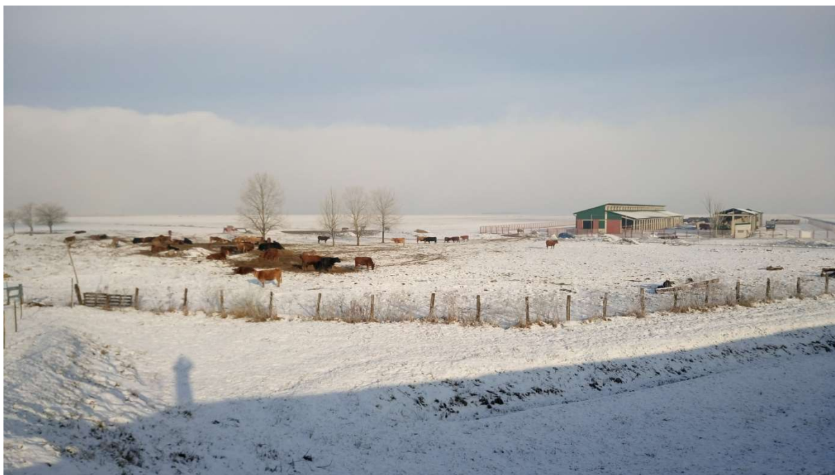
Slika 11. Krave na ispustu u sklopu štale