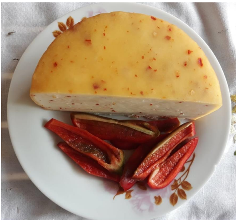
Slika 1. Kuhani sir

Kuhani sir je, uz domaći svježi sir, najzastupljeniji sir koji se proizvodi u seljačkim domaćinstvima u kontinentalnoj Hrvatskoj. Oblika je koluta, odnosno krnjeg stošca različitih dimenzija. Dvije su vrste kuhanog sira: dimljeni i nedimljeni. Kuhani sir se proizvodi najčešće od kravljeg mlijeka, dok se u posljednje vrijeme proizvodi i od kozjeg, odnosno mješavine kravljeg i kozjeg mlijeka. Isto tako, postoje različite kombinacije kuhanih sireva uz razne dodatke biljnog podrijetla. Kuhani sir je na uzroku iz razloga što ima relativno jednostavni način proizvodnje, te osigurava relativno dugu trajnost, prihvatljiva organoleptička svojstva, dobar prinos i brzu novčanu zaradu. Sa stručnog stajališta, kuhani sir predstavlja najjednostavniji oblik iskorištavanja i konzerviranja mliječnih bjelančevina (KIRIN, 2006.).