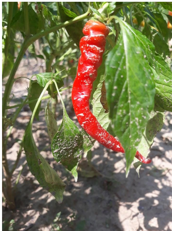
Slika 2. Ljuta paprika

Antimikrobna djelovanja i njihovi spojevi su naročito izraženi kod začinskog povrća: alicin u bijelom luku, kapsaicin u ljutim paprikama, piperin u papru, cimet aldehid u cimetu, eugenol u karanfilićima, karvakol u origanu, timol u majčinoj dušici, alil izotiocijanat u gorušici, oleuropen u maslinovom ulju i mnogi drugi.