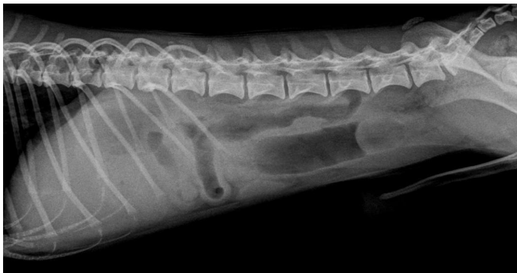
Slika 1. Rendgenogram trbušne šupljine psa (malteški psić) s nalazom okruglastog stranog tijela koje opstruira lumen tankog crijeva (nalaz native rendgenografije potvrđen kontrastnom pretragom i operativno).

U tablici 4. prikazan je broj i postotak linearnih i nelinearnih stranih tijela te njihov učinak na opstrukciju crijeva. Signifikantno je veći postotak nelinearnih tijela (78,89%) naspram linearnih (21,11%). Nelinearna strana tijela najčešće su dovela do potpune opstrukcije crijeva, u 42,25% slučajeva, dok su linearna u 47,37% slučajeva uzrokovala parcijalnu opstrukciju.