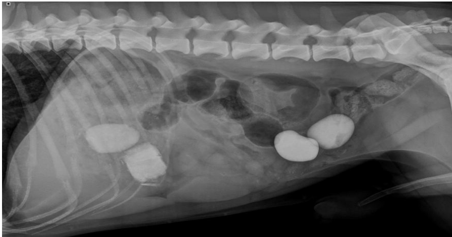
Slika 2. Rendgenološki prikaz abdomena psa (križanac) s dvije sjene stranih tijela u želucu, i dvije sjene stranih tijela (nelinearnog oblika) u silaznom kolonu.

Jejunum je segment crijeva u kojem su se najčešće nalazila strana tijela i to u 30 pasa odnosno 40,54% od ukupno 74 životinje kod kojih je jasno utvrđeno u kojem se dijelu crijeva strano tijelo nalazilo. Također, ta su strana tijela najčešće uzrokovala potpunu opstrukciju, u 53,57% slučajeva. Uz jejunum, strana tijela su se najviše zadržavala u duodenumu, u 13 pasa ili 17,57% od ukupnog broja životinja, te ileumu u 12 pasa odnosno 16,21%. Ostatak podjele stranih tijela po segmentima crijeva, njihov postotak te utjecaj na prohodnost crijeva prikazan je u tablici 7.