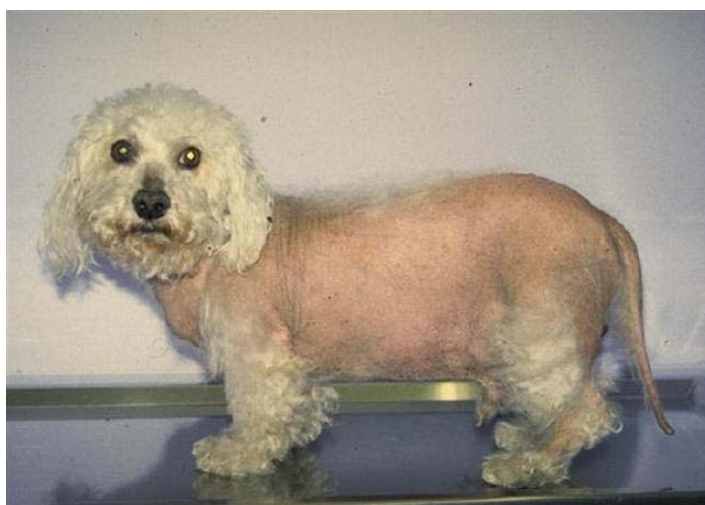
Slika 1. Alopecija u psa s Cushingovim sindromom.