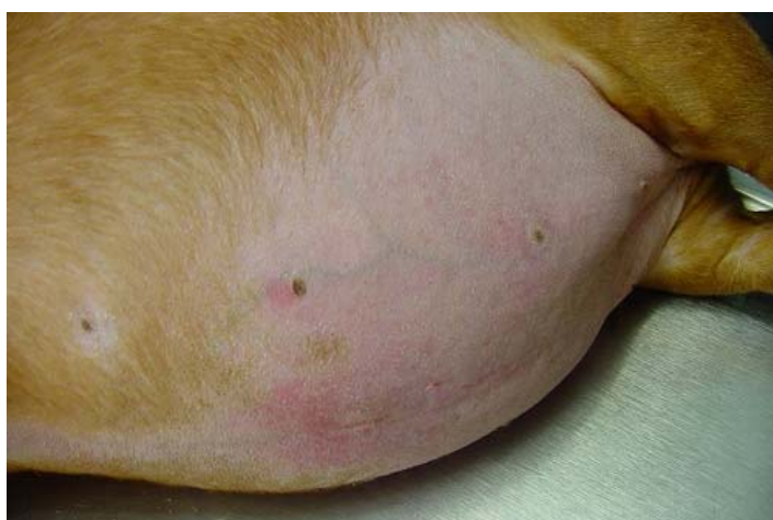
Slika 2. Proširen abdomen psa s alopecijom i tankom kožom te vidljivim krvnim žilama.

Kod ljudi bolest se, najčešće, javlja u žena srednjih godina s nalazom pretilosti trupa, pojačane obraslosti dlakama te povišenim krvnim tlakom. Intolerancija na glukozu je česta. Pacijent je slab, sklon zadobivanju masnica i emotivno lako uznemiren. Dobiva na tjelesnoj masi, ali primarno u području trupa i to s pojavom crvenih strija na koži.