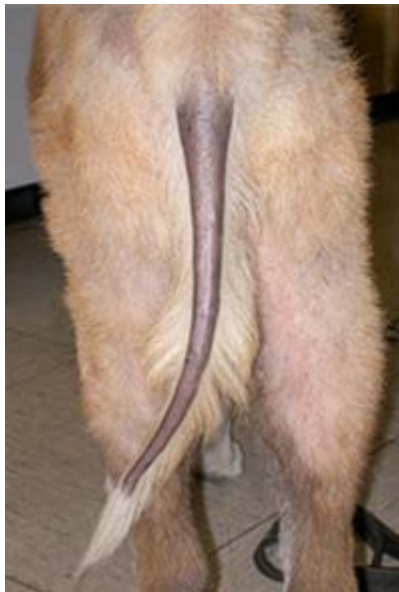
Slika 4. „Štakorski rep“

repa“ (Slika 4.), alopecije, piodermija, otitis, odebljala koža, polineuropatija, periferni vestibularni sindrom, pareza n. facialis , ataksija, kruženje, epileptiformni napadaji, suhi keratokonjunktivitis, dilatativna kardiomiopatija (DCM), aritmije, anestrus, neplodnost, prerastanje bakterija u probavnom traktu te konkurentne autoimunosne endokrinopatije (HERAK-PERKOVIĆ i sur., 2012.). Manjak hormona štitnjače rezultira negativnim inotropnim i kronotropnim učinkom na srce. Ova je promjena posebno bitna ukoliko pas otprije ima poteškoća s radom srca, jer će se nakon dijagnoze hipotireoidizma to stanje pogoršavati. Nalaz EKG-a pokazuje smanjeni QRS-kompleks i preuranjenu ventrikularnu akciju, a rendgenološki nalaz kardiomegaliju. Ono što, također, narušava normalnu funkciju srca su i infiltracija miokarda mukopolisaharidima te smanjena sposobnost vazodilatacije koronarnih arterija uslijed ateroskleroze (KARLAPUDI i sur., 2012.).