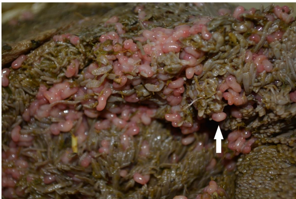
Slika 2. Burag odstrijeljene košute, na sluznici su vidljivi metilji (jedan primjerak označen strelicom)