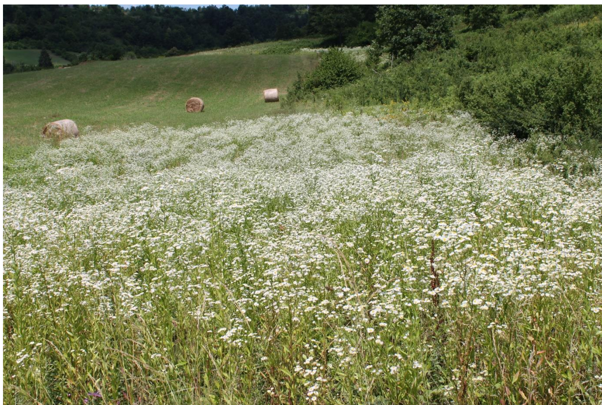
Slika 3. Pašnjak s područja Crkvine, u vlasništvu GEA-COM d.o.o. tijekom druge polovice svibnja 2018

maksimalnom pogreškom od < 4\% . Automatski postupak uzorkovanja napravljen je sa službenim reagensima (Daitro Lyse_DIFF, Diatro Cleanerand Diatro-Rinse) u četiri faze. Hematološki parametri su obuhvaćali ukupan broj bijelih krvnih stanica (WBC), broj limfocita (LYM), broj stanica srednje veličine (MID), broj granulocita (GRA), postotak limfocita (LY%), postotak stanica srednje veličine (MI%), postotak granulocita (GR%), broj crvenih krvnih stanica (RBC), hemoglobin (HGB), hematokrit (HTC), prosječni volumen eritrocita u litri krvi (MCV), prosječna količina hemoglobina u eritrocitu (MCH), prosječna koncentracija hemoglobina u eritrocitu (MCHC), širina raspodjele crvenih stanica (RDWc), broj trombocita (PLT), postotak trombocita (PCT), prosječni volumen trombocita (MPV) i širina raspodjele trombocita (PDWc). Krvni razmaz za diferencijalnu krvnu analizu su obojani panoptičkom metodom po Pappenheimu (koristeći May- Grünwald i Giemsa otopinu).