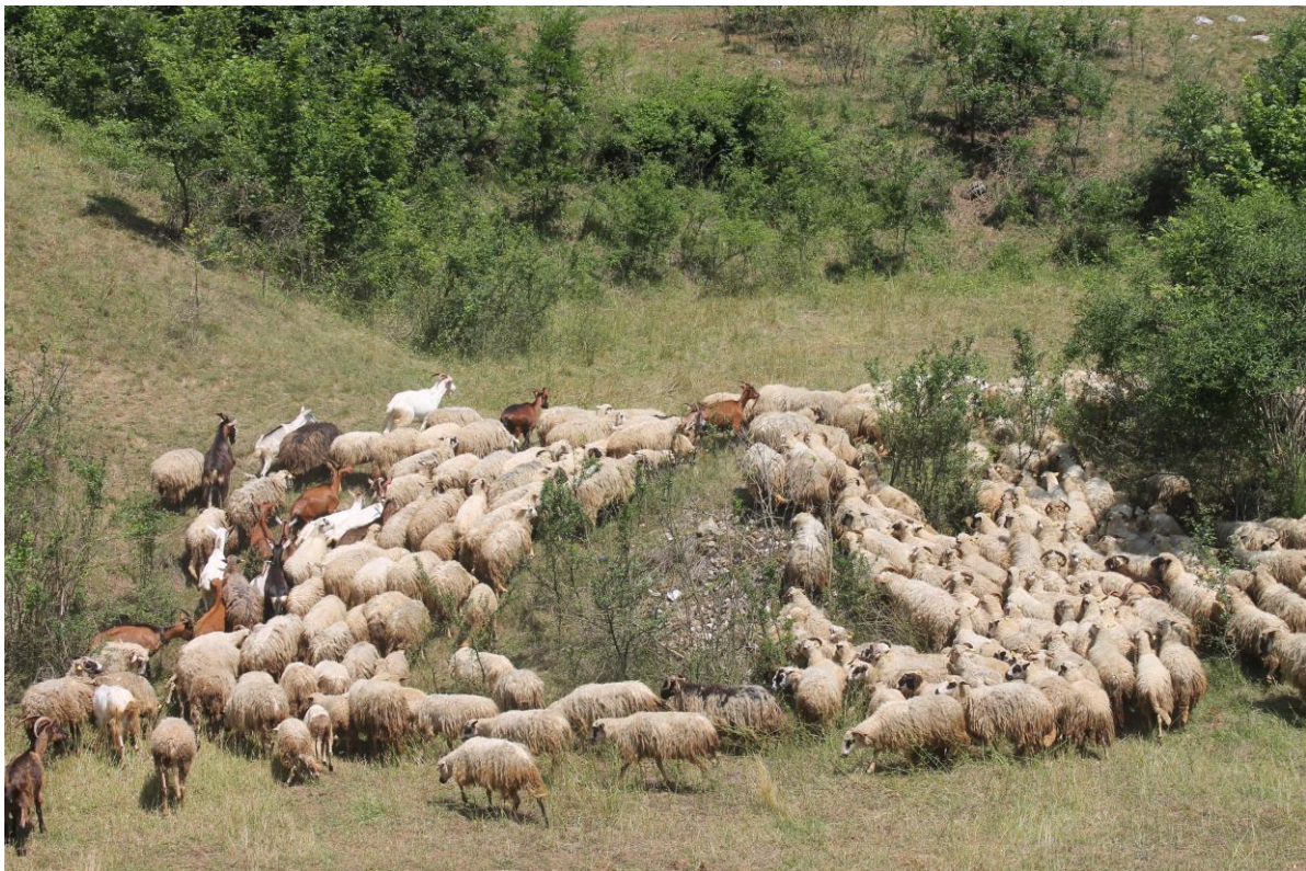
Slika 2. Stado ovaca pasmine Lička pramenka farme u vlasništvu GEA-COM d.o.o., Budačka rijeka

Istraživanje je provedeno na 36 nasumično odabranih ovaca pasmine lička pramenka, u dobi od 2 do 5 godina, prosječne tjelesne mase 35 kg. Farma se nalazi na području općine Krnjak, mjesto Crkvina. Na farmi je smješteno stado od ukupno 200 ovaca i 20 ovnova pasmine lička pramenka, različite dobi. Ovce se drže ekstenzivno, u toplijim mjesecima godine na ispaši (Slika 2.), a zimi u staji. Životinje se u vrijeme pašne sezone drže na ispaši tijekom cijeloga dana, dok se zimi hrane sijenom s okolnih pašnjaka.