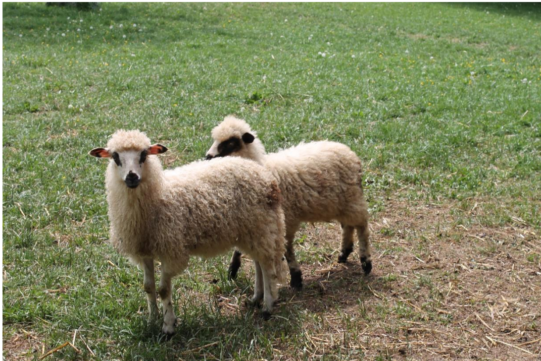
Slika 1. Janjad ličke pramenke

su dlakom, a ostali dio tijela vunom. Ovnovi imaju snažne rogove, a ovce su najčešće bez rogova. Boja je vune pretežno bijela, ali učestalo se javlja i siva, smeđa ili crna boja vune. U većine bijelih grla na glavi i nogama javljaju se točkasta i veća područja tamne dlake (Slika 1.). Jedno od najvažnijih osobina pramenke jest njezina velika otpornost i izdržljivost za kretanje na velike udaljenosti te dobro iskorištavanje travnjaka loše kvalitete. Tjelesna masa je jedno od obilježja koje pokazuje najveći opseg varijacija. Tako je, ovisno o uvjetima hranidbe, tjelesna masa ovaca od 25 do 70 kg, a ovnova od 30 do 90 kg. Runo je otvorenog tipa, sa šiljastim pramenovima, a finoća vlakna je prosječno 30 do 50 mikrona. Godišnji nastrig vune je nizak, od 1,0 do 3,0 kg. Duljina pramenova je od 12 do preko 20 cm, a randman vune je relativno visok (50 do 70 %). Pramenke su izrazito kasnozrele ovce koje se prvi put pripuštaju u dobi od godine i pol. Plodnost ovaca je prosječno 90 %. Porodna masa janjadi je od 2 do 4,5 kg. Proizvodnja mesa po ovci je niska. Janjad se kolje s malom tjelesnom masom, prosječno oko 20 kg žive vage. Klaonička iskoristivost zaklane janjadi također je relativno niska i kreće se oko 45 %. Međutim, kvaliteta mesa je izvrsna stoga se smatra kulinarskim specijalitetom. Prosječna proizvodnja mlijeka u pramenke je varijabilna i kreće se od 30 do 60 L (bez mlijeka koje posiše janje) u laktaciji koja traje oko šest mjeseci.