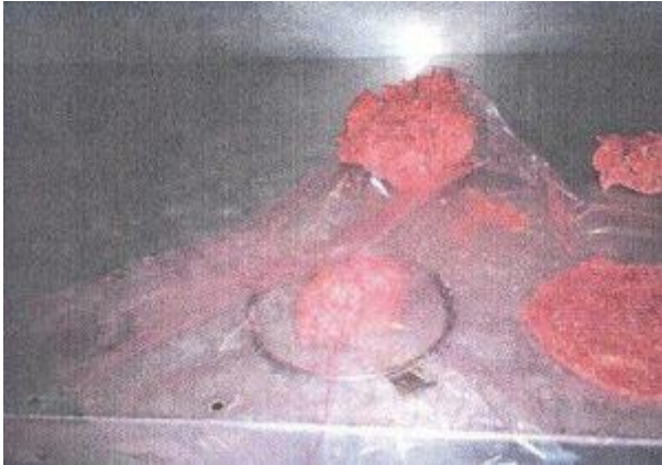
Slika 4. Izrada pljeskavica (prof. dr Ahmed Smajić, 2014.)

Pljeskavice se proizvode od usitnjenog goveđeg i ovčjeg mesa, a rjeđe svinjskog. Smjesa od koje se proizvode priprema se na isti način kao i za ćevapčiče.