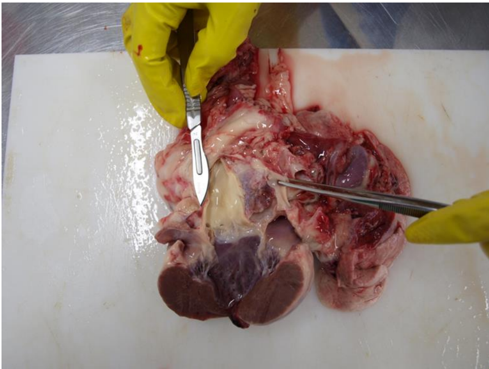
Slika 4. Pas, srce; kemodektom na bazi srca uz aortu