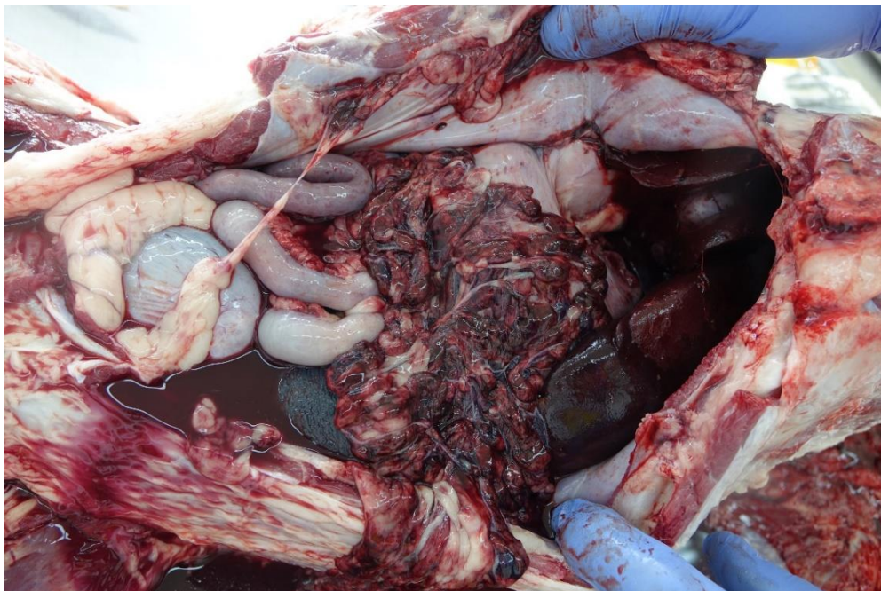
Slika 5. Pas, trbušna šupljina; opsežna, multifokalna do konfluentna krvarenja po velikom omentumu i mezenteriju crijeva sa nakupljanjem krvave tekućine u trbušnoj šupljini