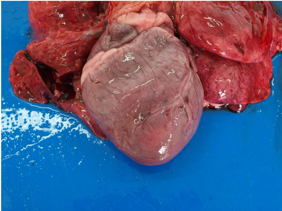
Slika 2. Pas, srce; dilatativna kardiomiopatija