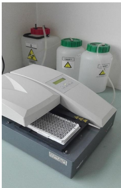
Slika 1. Ispiranje jažica mikrotitracijske plitice u automatskom uređaju za ispiranje mikrotitracijskih plitica.

U sljedećoj fazi se u svaku jažicu dodaje po 50 \mu l otopine supstrata te se plitica inkubira pri sobnoj temperaturi ( 21^{\circ}\text{C} \pm 5^{\circ}\text{C} ) tijekom 10 minuta ( \pm 1 minuta) na mjestu nedostupnom svjetlosti (slika 2.)