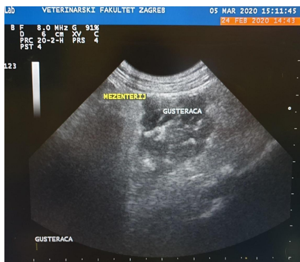
Slika 2. Ultrazvučni prikaz akutnog pankreatitisa.