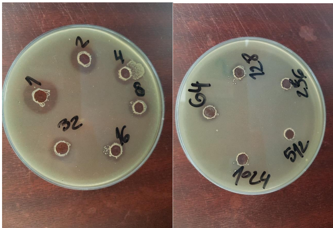
Slika 2. Određivanje aktivnosti bakteriocina iz nadtaloga E. faecalis EF-101

Soj E. faecalis EF-101 korišten je za karakterizaciju i određivanje njegove koncentracije postupkom serijskih razrjeđivanja (slike 2 i 3).