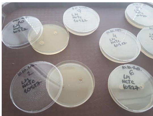
Slika 1. Ispitivanje antimikrobne aktivnosti enterokoka

Rezultati testiranja antimikrobne aktivnosti enterokoka prema različitim sojevima L. monocytogenes , L. ivanovii , L. innocua , Y. enterocolitica i S. Typhimurium prikazani su u tablicama 1–7. Detalj pretraga prikazan je slikom 1.