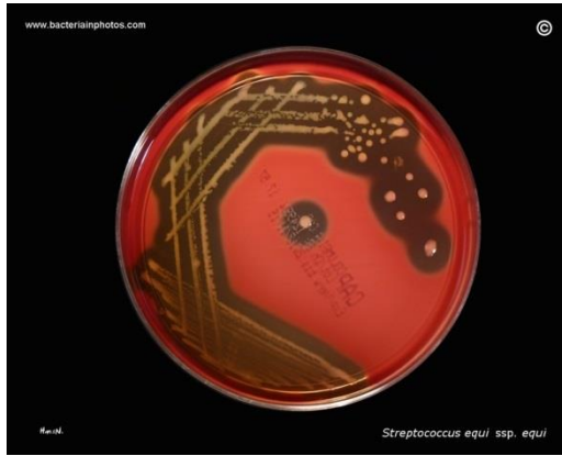
Slika 1. Streptococcus equi subsp. equi na krvnom agaru