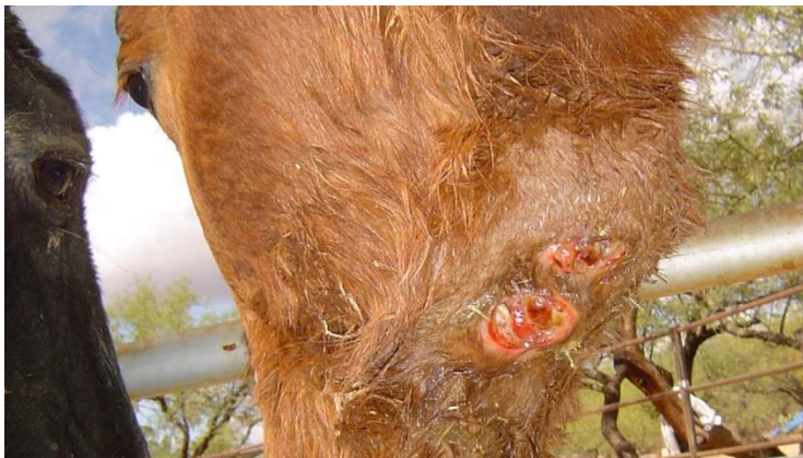
Slika 3. Rupturirani limfni čvorovi konja

S. equi se može proširiti u bilo koji dio tijela – hematogeno, limfogeno, zbog blizine žarišta ili pak aspiracijom purulentog sadržaja s uzročnikom. Takav metastatski oblik bolesti se još naziva i "putujući ždrebećak". Najčešća mjesta metastaziranja su pluća, mezenterij, jetra, slezena, bubrezi i mozak. Do pritiska na dušnik dolazi uslijed metastaziranja na medijastinalne limfne čvorove, a nerijetko dolazi i do gnojne bronhopneumonije. Zahvaćenost mezenterijalnih limfnih čvorova može biti praćena ascitesom. Širenje infekcije na sinuse i zračne mjehure također predstavlja značajnu komplikaciju, s obzirom na to da takvi konji mogu ostati dugotrajni izvori infekcije za druge životinje. Od rjeđih komplikacija još se mogu javiti miokarditis, endokarditis, panoftalmitis, periorbitalni apscesi, apscesi mozga, ulcerativni keratitis, septični artritis (SELLON i LONG, 2007.). Liječenje takve proširene infekcije uključuje dugotrajnu antimikrobnu terapiju, lokalnu terapiju te drenažu dostupnih apscesa (BERLIN i sur.,2013.;PUSTERLA i sur., 2007.).