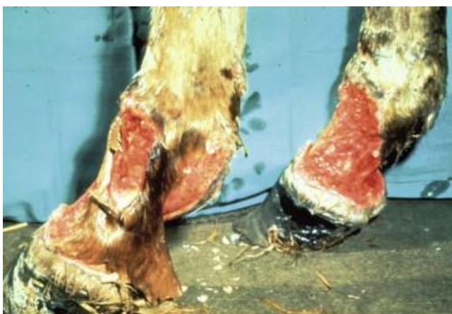
Slika 4. Oguljena koža kao posljedica purpure

Purpura hemorrhagica je imunoposredovano stanje čija patogenezna nije u potpunosti razjašnjena, no smatra se da nastaje kao posljedica odlaganja imunih kompleksa na stijenke krvnih žila. Važno je napomenuti da do takvog stanja ne dolazi isključivo u prisutnosti S. equi u organizmu – i neki drugi patogen može polučiti isti imunski odgovor inficiranog organizma. Radi se o aseptičnom nekrotizirajućem vaskulitisu uslijed kojeg dolazi do edema, petehijalnih i ekhimotičnih krvarenja. Edemi se javljaju na glavi, trupu i ekstremitetima, a mogu biti toliko teški da uzrokuju guljenje kože na tim područjima. Osim navedenog, vaskulitis može zahvatiti i gastrointestinalni trakt, pluća i mišiće što rezultira intususcepcijom tankog crijeva (DUJARDIN, 2011.), respiratornim poteškoćama i bolnošću mišićja. Liječenje se provodi kortikosteroidima, antibioticima, nesteroidnim protuupalnim lijekovima te potpornom terapijom koja uključuje intravensku tekućinsku terapiju, hidroterapiju i stavljanje povoja. Purpura hemorrhagica je ozbiljna komplikacija koja nerijetko završava fatalno (BOYLE i sur., 2018.).