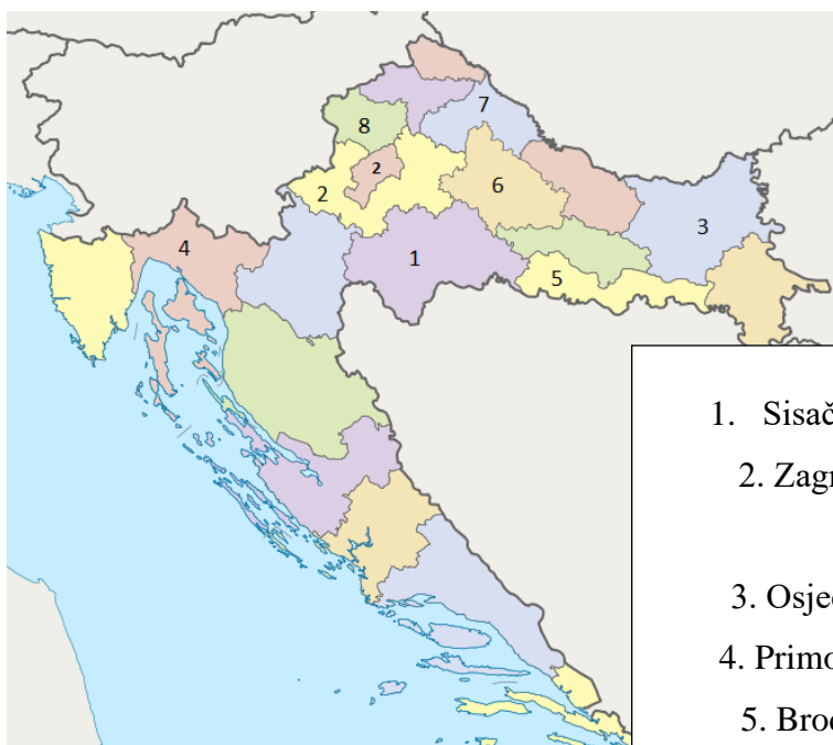
Slika 5. Prevalencija po županijama