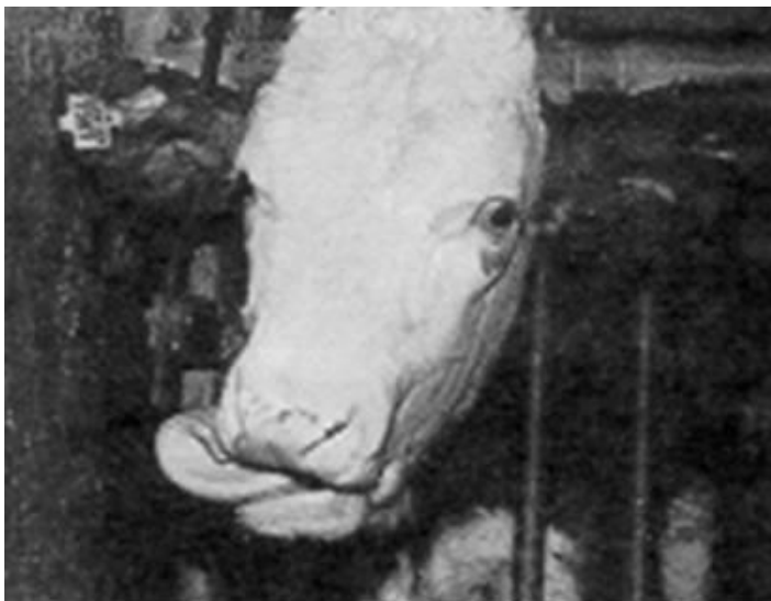
Slika 3. Igranje jezikom kod goveda.

Stereotipija u obliku igranja jezikom (engl. tongue-rolling ) izražava se na način da govedo uvijajućim pokretima izvlači i uvlači jezik iz usta, no bez prisutnosti supstrata za