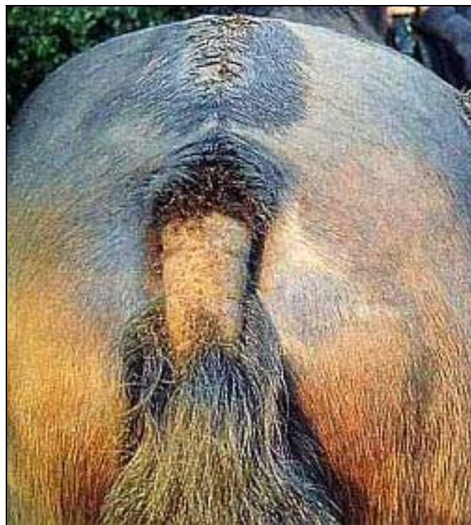
Slika 8. Posljedice trljanja repom kod konja.

Trljanje repom (engl. tail-rubbing ) može biti znak parazitarnih ili gljivičnih bolesti, ali može postati učestalo i kada nisu prisutni znakovi infekcije i invazije parazitima (slika 8). Konj prisloni stražnji dio tijela o drvo, ogradu ili dio staje te ritmički pomiče rep s jedne na drugu stranu dok ga ne potisne u perinealno područje (Broom i Fraser, 2007.).