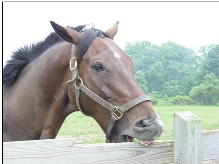
Slika 4. Stereotipno grizenje jasli kod konja.

zahvatom. Osim resekcije pojedinih mišića, modificirana tehnika obuhvaća i neurektomiju ventralne grane 11. mozgovnog živca ( n. accesorius ). Ventralna grana n. accesorius inervira sternomandibularni mišić koji je najveći mišić vrata kojim se konj služi pri fleksiji vrata. Samom neurektomijom ne postižu se željeni rezultati, stoga se zahvat upotpunjuje djelomičnom resekcijom mišića ( http://www-staro.vef.unizg.hr/org/kirurgija/wp-content/uploads/2015/07/radisic-bolesti_lokomotornog_sustava.pdf ). Operacijsko je liječenje krajnja, prinudna mjera sprječavanja ovog stanja, koje je uzrokovano neodgovarajućim upravljanjem uzgoja i životnim uvjetima konja (Broom i Fraser, 2007.).