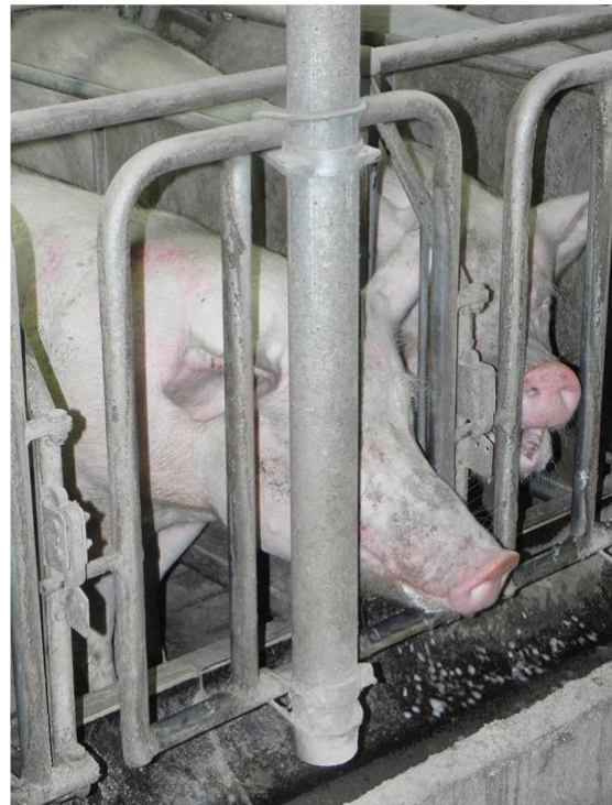
Slika 1. Žvakanje krmača u prazno.

Žvakanje u prazno (engl. sham-chewing , vacuum-chewing ) se očituje pokretima čeljusti kao pri žvakanju hrane, no bez supstrata za hranjenje. Ovakvo ponašanje uobičajeno se javlja kod krmača držanih pojedinačno u odjeljcima bez stelje. Životinja energično žvače i nakon što je pojela hranu. Žvačni pokreti uzrokuju pjenušanje sline, koja se sakuplja na rubovima usana i kutovima usta te pada na tlo, što može poslužiti kao dokaz ove stereotipije (slika 1). U takvom ponašanju krmače mogu provesti i do nekoliko sati dnevno. Učestalost izražavanja žvakanja u prazno može se smanjiti ako se krmačama osigura slama ili piljevina koju mogu žvakati ili rovati po njoj (Broom i Fraser, 2007.).