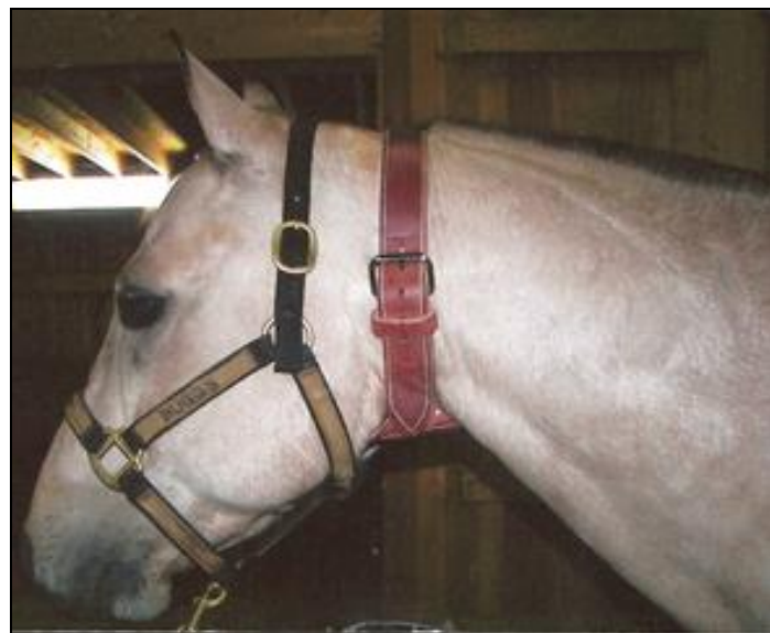
Slika 5. Remen za sprječavanje gutanja zraka kod konja.