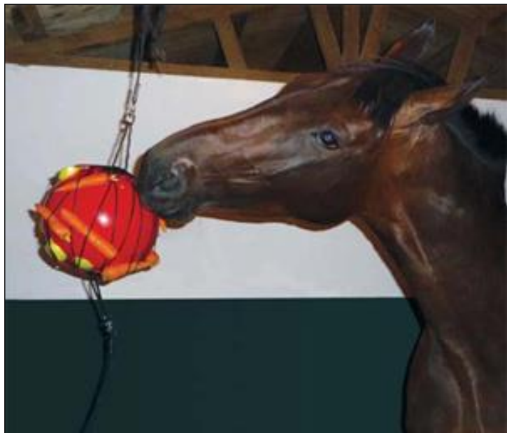
Slika 6. Predmet za obogaćivanje okoliša konja.

Pod stereotipnim udaranjem po staji (engl. stall-kicking ) podrazumijeva se opetovano udaranje kopitima i zglobovima o zidove i/ili pregrade u staji ili konj udara nogama o pod bez ikakvog cilja ili funkcije. To uzrokuje trajna oštećenja kostiju i zglobova. Pogodovni čimbenici su nedovoljna aktivnost, višak hrane i neprestana promjena mjesta boravka. Konji mogu biti i genetski predisponirani na ovo stanje ili se ono može jednostavno razviti tijekom života. Treba imati na umu da je udaranje dio društveno prihvatljive igre između konja, odnosno prirodno ponašanje, ali može brzo postati pretjerana i opsesivna navika. Kao i mnogi drugi nenormalni oblici ponašanja, tako se i ova stereotipija može razviti kao rezultat oponašanja drugih konja ili kao izraz zadovoljstva zbog proizvedenog zvuka udaranjem. Naime, konji koji su smješteni u neposrednoj blizini mogu oponašati takvu stereotipiju te ju smatrati kao interaktivnu igru.