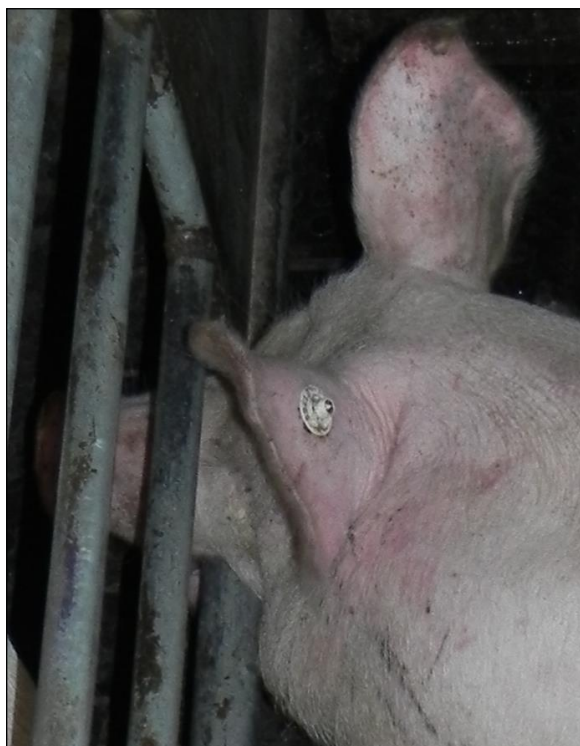
Slika 2. Nazimica grize pregradu.

Grizenje pregrada (engl. bar-biting ) je stereotipija koja se izražava na način da životinja ustima obavija pregradu odjeljka ili boksa, uključujući jezik i zube, te obavlja žvačne pokrete (slika 2). Životinja stavlja u usta jednu od poprečnih pregrada odjeljka i grize ju, trlja jezikom ili ritmičkim pokretima kliže ustima po pregradi s jedne na drugu stranu – brusenje (Ostović i sur., 2015.). Uobičajena je pojava kod suprasnih krmača smještenih pojedinačno u strogo prostorno ograničenim odjeljcima u kojima se ne mogu niti okrenuti, s punim ili rešetkastim betonskim podom. Odjeljci su najčešće izrađeni od metalnih cijevi. Ova se stereotipija može djelomično kontrolirati poboljšanjem