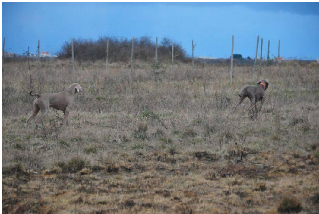
Slika 7. Sekundiranje