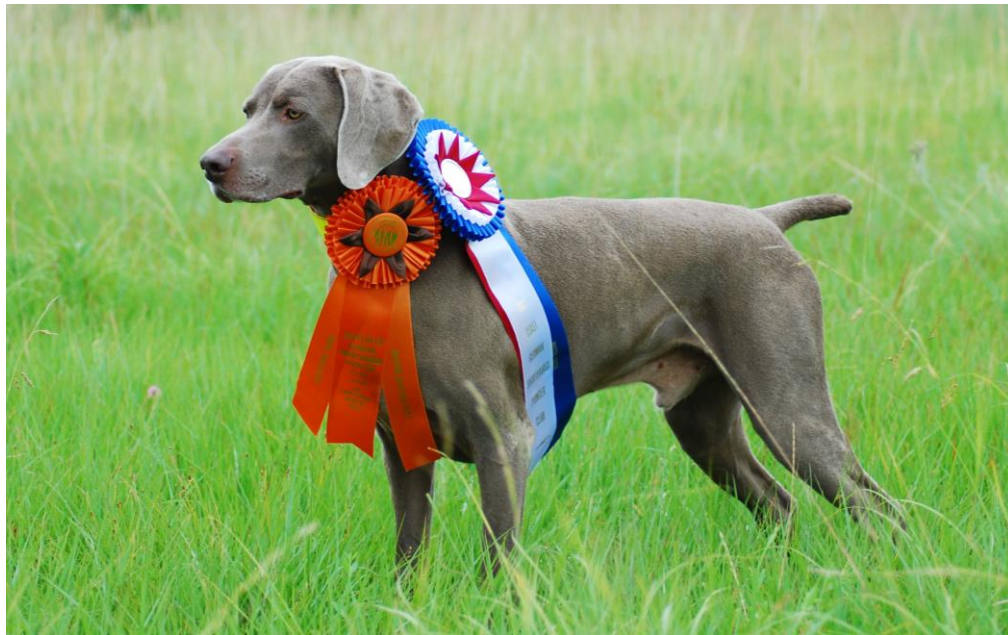
Slika 13. Ch. Adonai's Twenty-One Gun Salute, MH SDX, NRD, V

Dodatno, postoji i kategorija svestranosti unutar koje su razine od V (eng. Versatile ) do VX7 (eng. Versatile Excellent 7 ). Propisan je broj bodova koje pas može dobiti za pojedine položene ispite, poput AKC radnih i lovačkih ispita, agilnosti, ispita poslušnosti i drugih. Zbrojem tih bodova WCA izravno dodjeljuje nagradu za svestranost na pojedinoj razini.