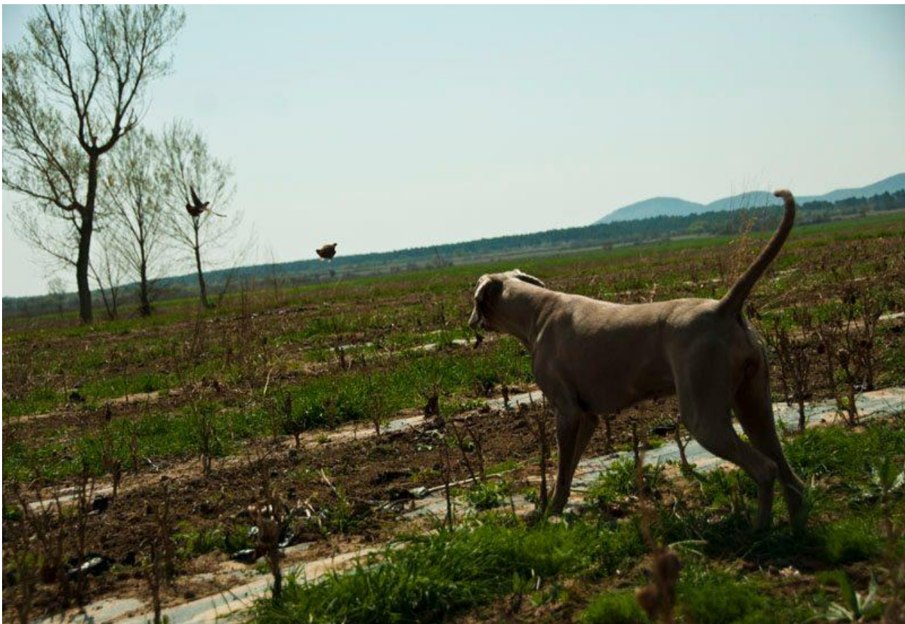
Slika 10. Rad u polju, pokazivanje