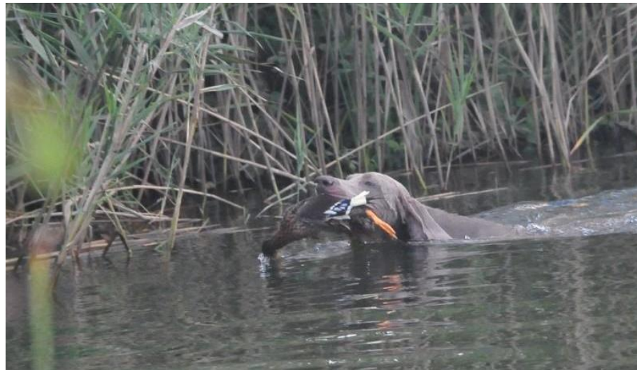
Slika 9. Donošenje patke iz duboke vode