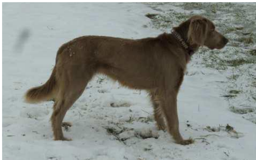
Slika 6. Dugodlaki vajmarski ptičar