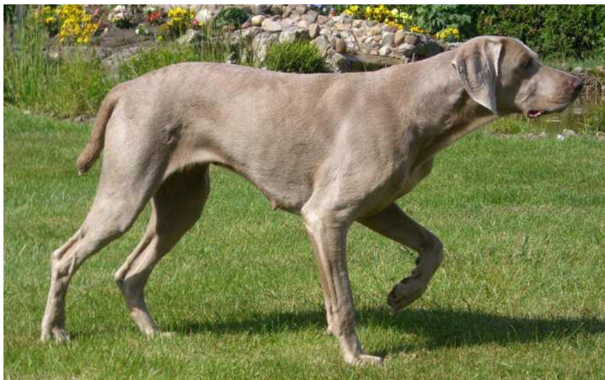
Slika 5. Kratkodlaki vajmarski ptičar