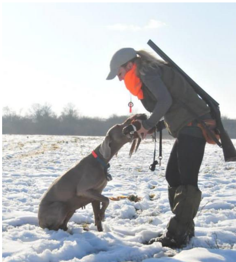
Slika 8. Predaja divljači vodiču u ruku u sjedećem položaju