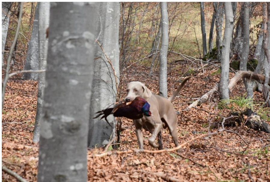
Slika 11. Rad u šumi, donošenje divljači

Svestrani ispit provodi se na svakom psu pojedinačno u svim disciplinama. Preduvjet je neizostavan položeni ispit prirođenih osobina, neovisno o dobi. Ocjenjuju se sljedeće discipline: