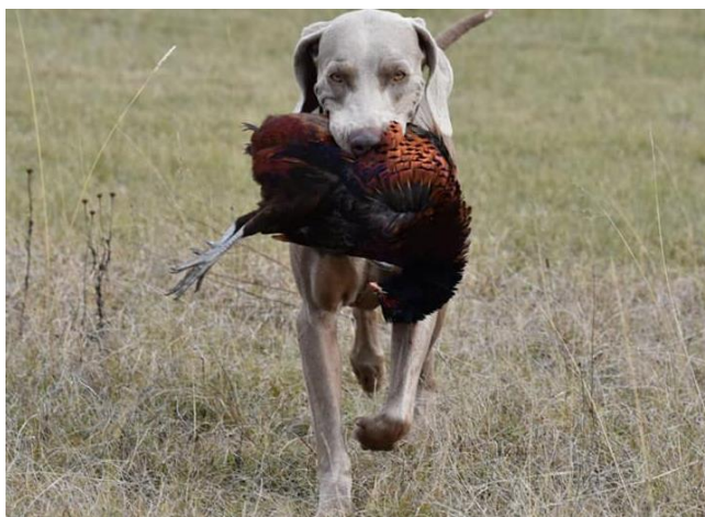
Slika 1. Dianas Argentum Promise

U ovom radu prikazat ćemo osnovne karakteristike i radne sposobnosti vajmarskih ptičara u lovu s ciljem boljeg razumijevanja pasmine i njezine uloge u današnjoj lovnoj kinologiji.