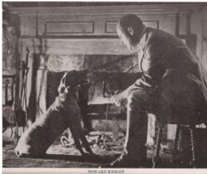
Slika 4. Sir Howard Knight

Krajem 19. stoljeća podnesen je zahtjev za priznanje vajmarskog ptičara kao čistokrvne pasmine u Njemačkoj, što je naišlo na veliko protivljenje jer su mnogi smatrali da je on podvrsta njemačkog kratkodlakog ptičara. Ipak, pasmina je priznata 1896. godine, dok je prvi pasminski standard donesen dvije godine ranije. 20. lipnja 1897. u Erfurtu Karl Brandt osnovao je Njemački klub vajmarskih ptičara. Major Robert Herber, „otac vajmarskog ptičara“ i predsjednik kluba od 1912. do 1946. godine, imao je značajnu ulogu u uzgoju vajmarskih ptičara te je postavio stroga pravila uzgoja i selekcije. Tek 1929. godine Howard Knight postaje prvim amerikancem članom njemačkog Kluba vajmarskih ptičara, čime započinje njihov uzgoj u Americi. Tako je 1941. osnovan američki klub, a dvije godine kasnije je AKC (eng. American Kennel Club ) službeno priznao vajmarskog ptičara. Dugodlaku varijantu vajmarskog ptičara AKC još uvijek nije priznao. Pedesetih godina prošlog stoljeća započinje uzgoj vajmarskih ptičara i u Velikoj Britaniji te ostatku Europe, a početkom ovog stoljeća i u Hrvatskoj.