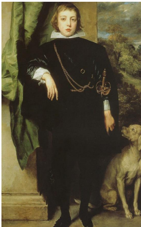
Slika 3. Prince Rupert of the Palatinate, Sir Anthony van Dyck, 17. st.

Neovisno o brojnim teorijama, nadvojvoda Karl August (1757. – 1828.) od Weimara, središta današnje njemačke savezne pokrajine Tiringije, smatra se začetnikom vajmarskog ptičara. On je početkom 19. stoljeća na svojem dvoru uzgajao pse srebrnosive dlake namijenjene za lov u šumama Tiringije. Neki vjeruju da je nadvojvoda te pse zapravo dobio od princa Eserhazyja iz Češke te ih je sa svojim plemstvom nastavio uzgajao u tajnosti tako da nisu bili dostupni pučanstvu. Iako je isprva bio namijenjen za lov na krupnu divljač, selektivnim križanjem s ptičarima postao je svestran lovački pas. Najraniji dokumenti o čistokrvnosti pasmine spominju da je otac Baruna von Wintzingerode – Knorra uzgajao vajmarske ptičare, što potvrđuje i slika baruna sa svojim psom Nimrodom iz 1871. godine. Izvješće iz 1882. navodi da se vajmarski ptičar pojavio na izložbi njemačkog Kluba uzgajivača čistokrvnih pasmina pasa te da se ne preporučuje križanje ovih pasa sa drugim njemačkim ptičarima jer se tako dobiva nepoželjan grubi tip crvenkastosmeđe boje. Kao značajni uzgajivači toga doba spominju se F. Pitschke, P. Wittekop i Lindblohm od čijih su pasa potekle tri linije vajmarskih ptičara.