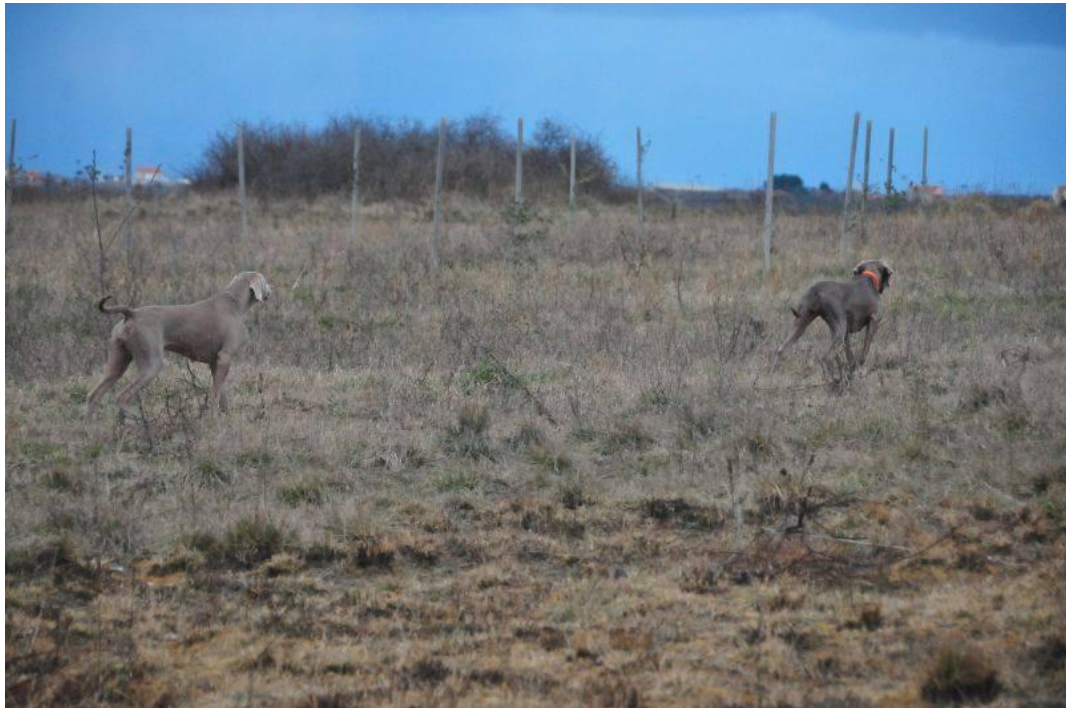
Slika 7. Sekundiranje