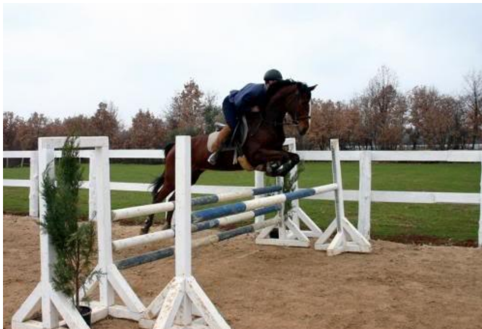
Slika 3. Konj u preponskom natjecanju