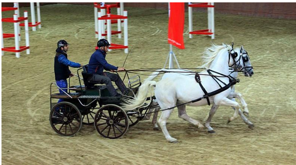
Slika 4. Konj u zaprežnom natjecanju

Vrijeme hranidbe konja je od presudne važnosti, kako zbog uspjeha na treninzima i natjecanjima, tako i zbog održavanja dobrog zdravstvenog stanja konja. Tako će male količine sijena date prije natjecanja pomoći u održavanju hidratacije jer potiče konzumaciju vode. Isto tako žitarice se ne daju 3 do 5 sati prije natjecanja radi pravilnog iskorištavanja ugljikohidrata i masti. No, 1,5 h nakon rada ili natjecanja potrebno je konju omogućiti sijeno, obrok sa koncentratom i vodu, što će mu pomoći u oporavku. Konje koji su izloženi teškom radu neposredno prije natjecanja treba tretirati na određeni način tako da im se daje voda po volji, no da im se ukine "zrno" 8 sati i sijeno 12 sati prije natjecanja. Ako su pak u pitanju natjecanja umjerenog intenziteta sa srednjim vremenskim trajanjem, treba dati vodu po volji, sijeno u malim količinama i ne davati "zrno" 8 sati prije. Natjecanja maloga intenziteta i dugog trajanja treba pratiti davajući vodu po volji, bez sijena i "zrna" cijeli taj dan, uz udavanje elektrolita neposredno prije i za vrijeme natjecanja.