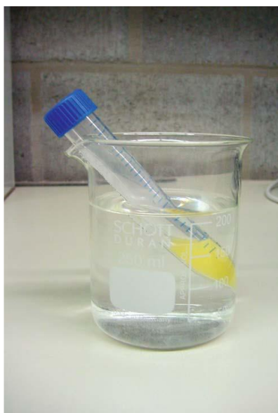
Slika 2. Uzorak razrijeđene sperme uronjen u posudu s vodom na temperaturu od 37°C (RIJSSELAERE i sur., 2011. )

Nekoliko istraživanja pokazalo je da je moguće uspješno duboko smrznuti ohlađenu spermu nakon 2 do 3 dana pohrane. To omogućuje prikupljanje, hlađenje i transport sjemena psa do najbližeg reproduktivnog centra gdje će biti smrznuto i pohranjeno na -196°C za kasniju upotrebu (RIJSSELAERE i sur., 2011.).