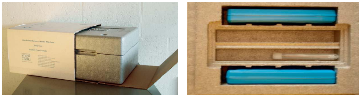
Slika 3. Transport ohlađenog sjemena u kutiji od neopora (RIJSSELAERE i sur., 2011.)

postepeno hladi tijekom transporta. Temperatura 4-5°C ostaje tijekom 48 sati, unutar kojih sjeme mora doći na željenu destinaciju (LINDE FORSBERG, 2010.).