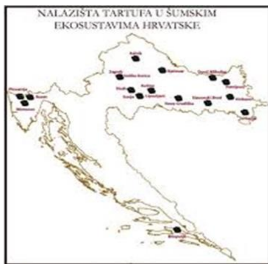
Slika 1 Nalazišta tartufa u Republici Hrvatskoj

U sezoni 2018. tijekom 12.mjeseca autor je osobno istražio kontinentalne dijelove Republike Hrvatske u potrazi za bijelim i crnim tartufom. Pronađen je bijeli tartuf ( T.