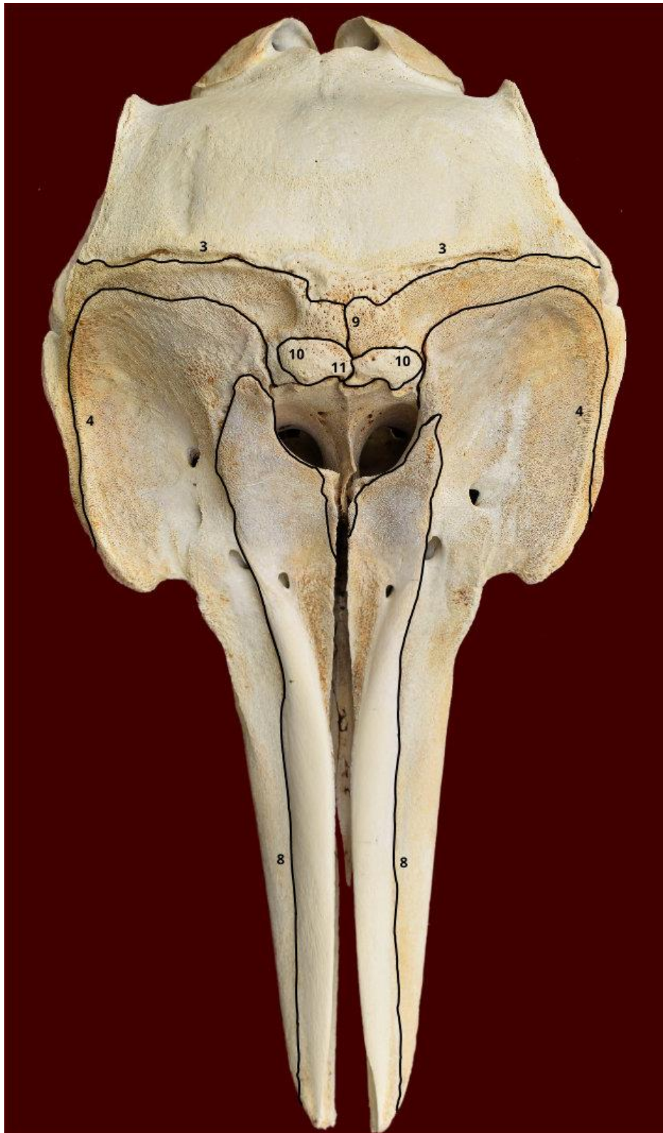
Slika 2. Lubanja dobrog dupina iz Jadranskog mora - norma dorsalis. Označeni su sljedeći šavovi: sutura coronalis (3), sutura frontomaxillaris (4), sutura maxilloincisiva (8), sutura interfrontalis (9), sutura frontonasalis (10) i sutura internasalis (11).