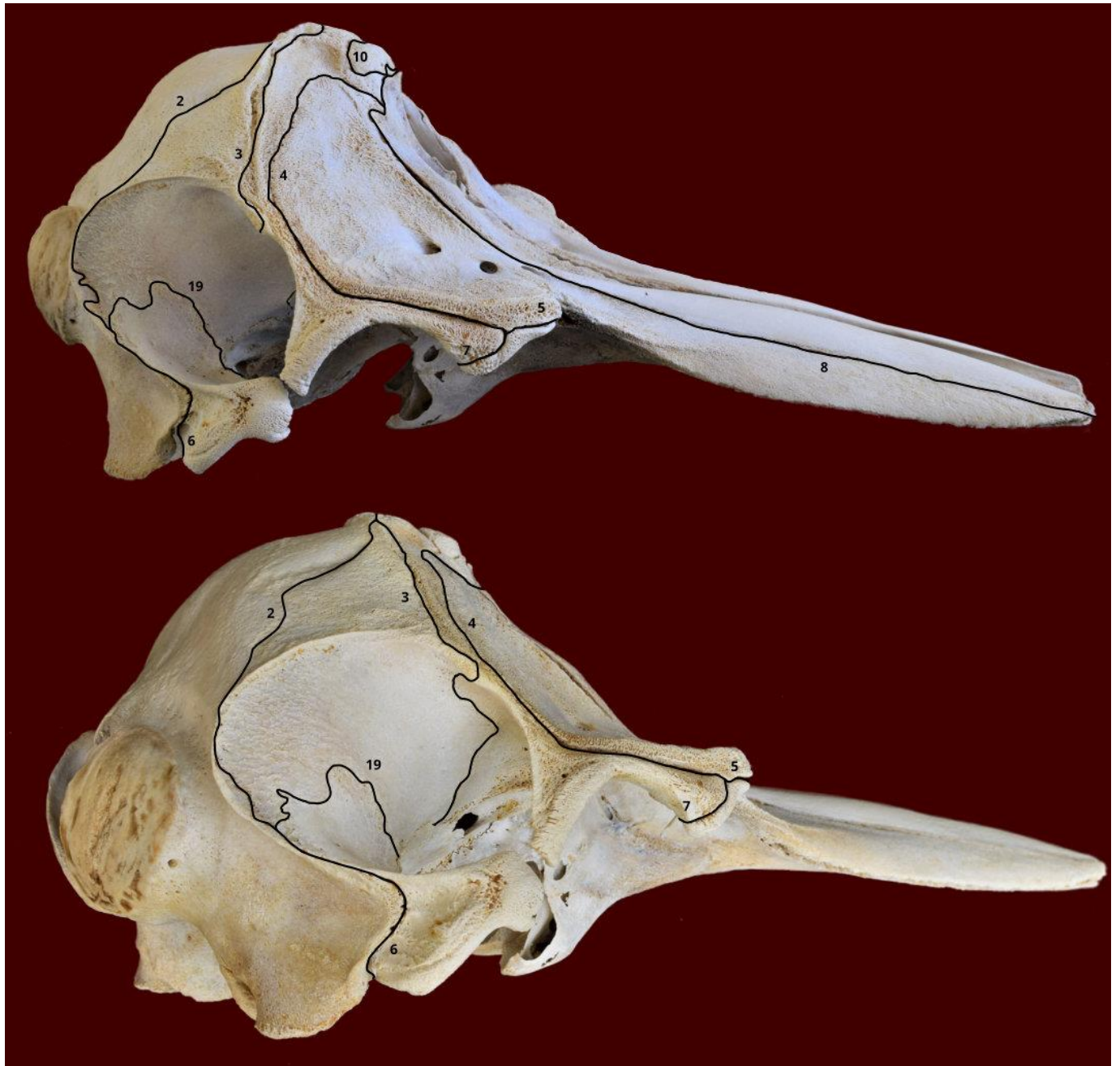
Slika 3. Lubanja dobrog dupina iz Jadranskog mora - norma lateralis (gore i dolje). Označeni su sljedeći šavovi: sutura lambdoidea (2), sutura coronalis (3), sutura frontomaxillaris (4), sutura lacrimomaxillaris (5), sutura occipitosquamosa (6), sutura frontolacrimalis (7), sutura maxilloincisiva (8), sutura frontonasalis (10) i sutura squamosa (19).