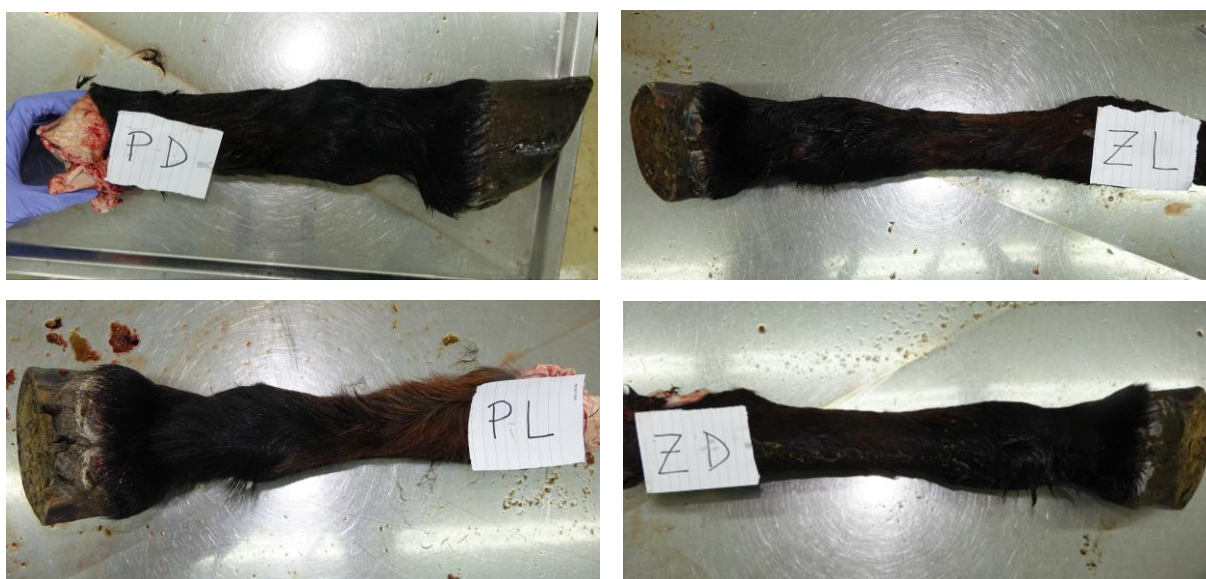
Slika 4. Konj broj 7, kobila, 20 godina. Eutanazija zbog ulkusa tankog crijeva i kroničnog peritonitisa. Slike prikazuju noge bez i najmanjih kožnih lezija.

Uzroci smrti konja bili su raznoliki. Jedanaest konja uginulo je ili bilo eutanazirano zbog problema koji nisu bili vezani uz ekstremitete. Bili su to: kolike različitog podrijetla, opstrukcija jednjaka, ruptura želuca, ruptura kolona, perforacije i ulkusi crijeva, ruptura arterije i sl.