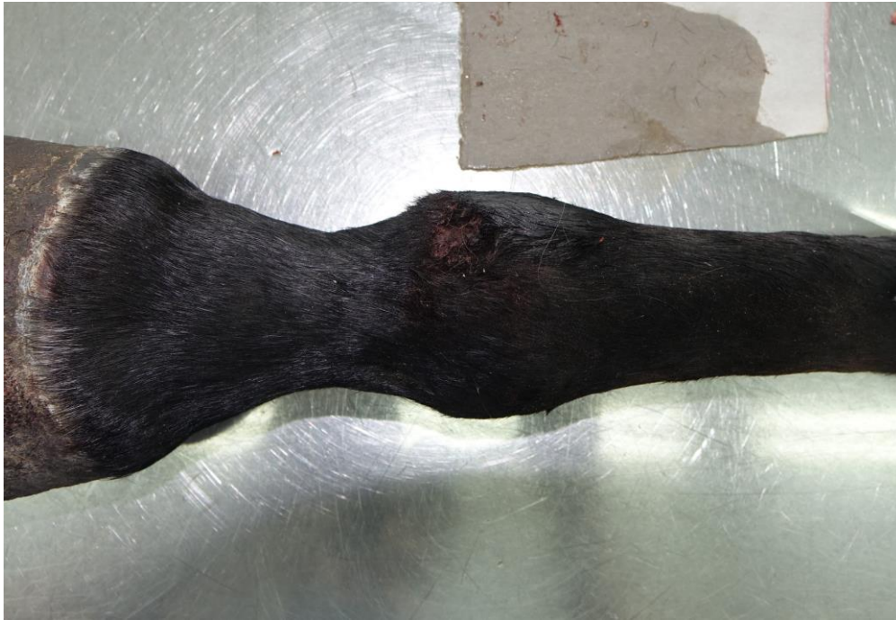
Slika 8. Konj broj 6, kobila, 12 godina, prednja lijeva noga. S lateralne strane putične regije nalazi se ozljeda veličine 2x2 cm, čija je okolina uprljana s manjom količinom skorenog tamno crvenog sadržaja; kronična lezija.