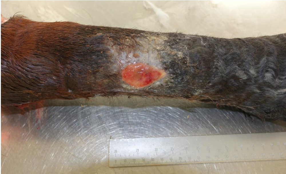
Slika 6. Konj broj 1; kobila 1,5 godina; rana s granulacionim tkivom na stražnjoj desnoj nozi, dorzolateralna strana cjevanice; kronična lezija.

U pregledanoj populaciji konja nije nađena niti jedna lezija u području kičica, niti su nađene patološke promjene koje bi ukazivale na prisutnost zvjerinca.