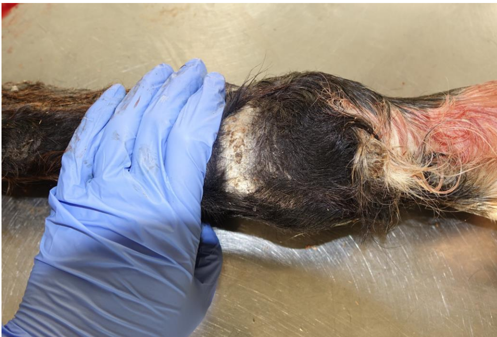
Slika 7. Stražnja desna noga, bezdlačno područje s plantarne strane iznad putičnog zgloba, odgovara ožiljkastom tkivu; kronična lezija (konj broj 1).